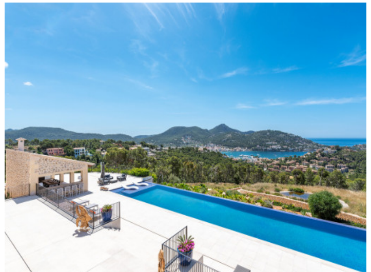
Blick auf die Terrasse