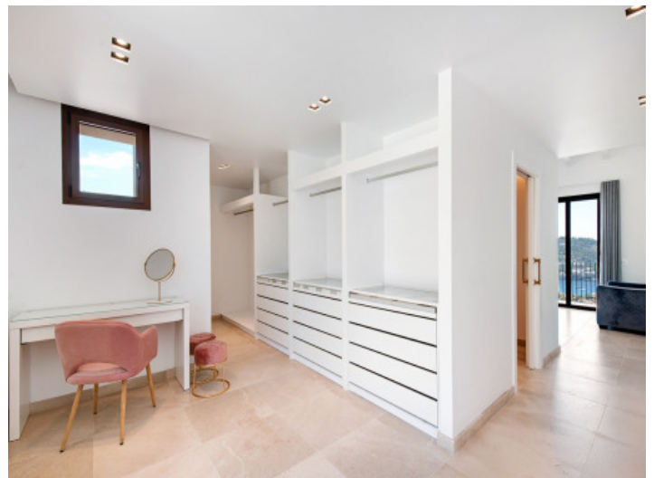
Ansicht des Ankleidezimmers

Alle Angaben nach bestem Wissen. Irrtum und Zwischenverkauf vorbehalten. Dieses Exposé ist eine Vorinformation, als Rechtsgrundlage gilt allein der notariell abgeschlossene Kaufvertrag.