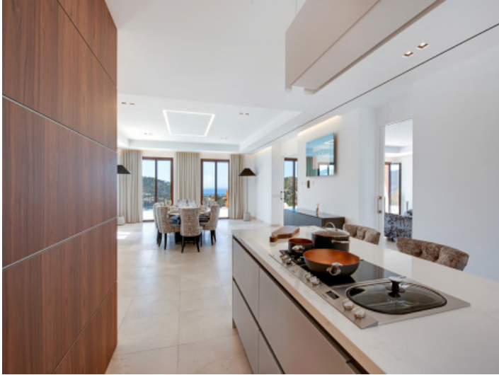
Die Küche verfügt über eine Kochinsel