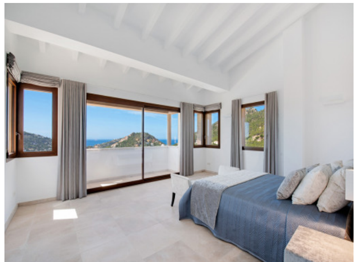
Große Suite mit Badezimmer en Suite

Alle Angaben nach bestem Wissen. Irrtum und Zwischenverkauf vorbehalten. Dieses Exposé ist eine Vorinformation, als Rechtsgrundlage gilt allein der notariell abgeschlossene Kaufvertrag.