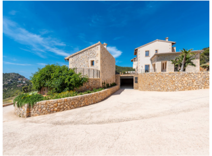
Zufahrt zur Garage