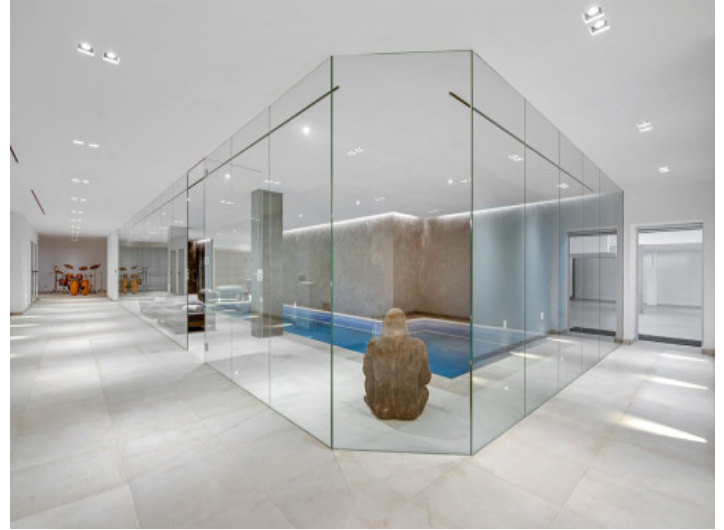
Großflächiger Spa Bereich