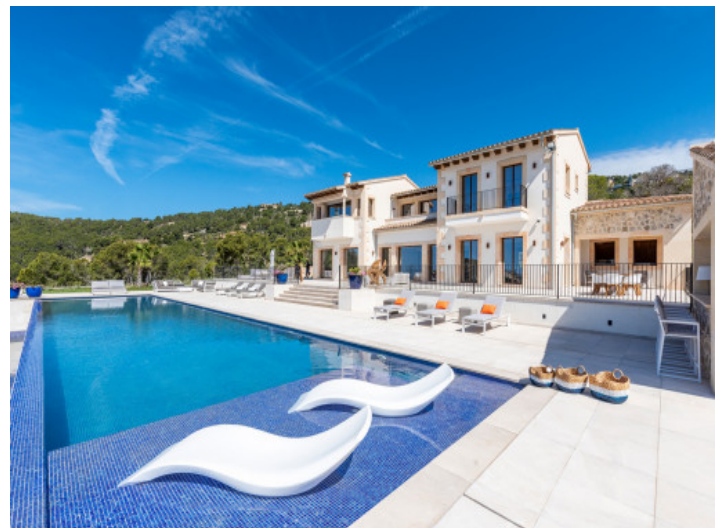
Alternative Außenansicht der Villa

Alle Angaben nach bestem Wissen. Irrtum und Zwischenverkauf vorbehalten. Dieses Exposé ist eine Vorinformation, als Rechtsgrundlage gilt allein der notariell abgeschlossene Kaufvertrag.