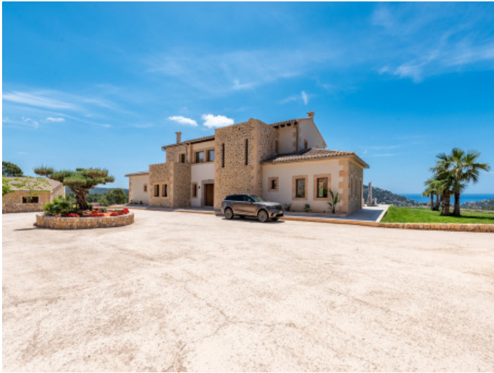
Außenansicht der Villa