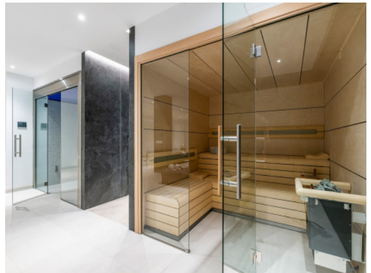
Ansicht der Sauna