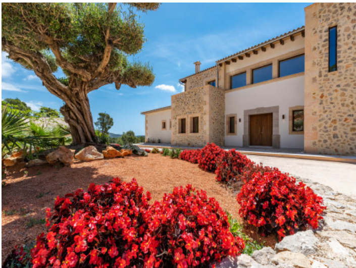
Alternative Außenansicht der Villa

Alle Angaben nach bestem Wissen. Irrtum und Zwischenverkauf vorbehalten. Dieses Exposé ist eine Vorinformation, als Rechtsgrundlage gilt allein der notariell abgeschlossene Kaufvertrag.