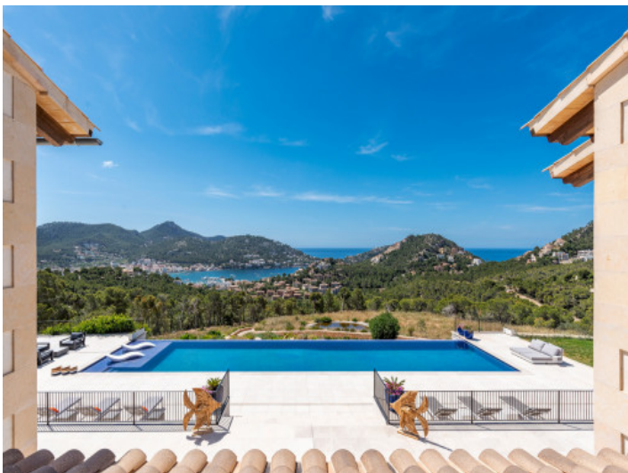
Blick auf den Poolbereich