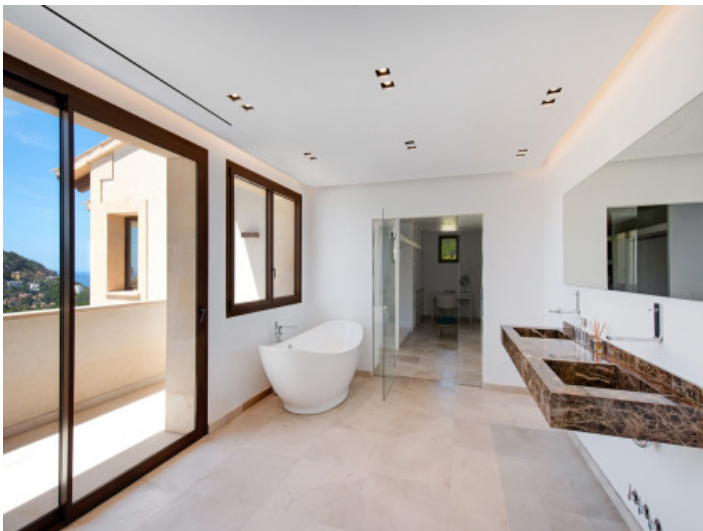
Alternative Ansicht des Badezimmers