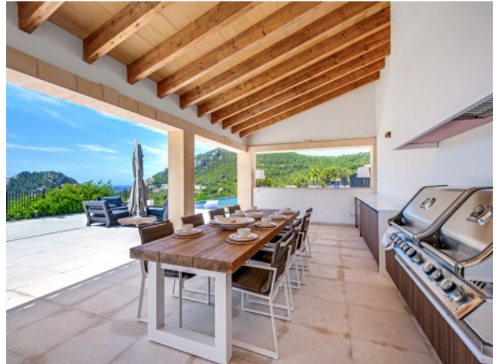
Überdachte Außenküche und Essbereich