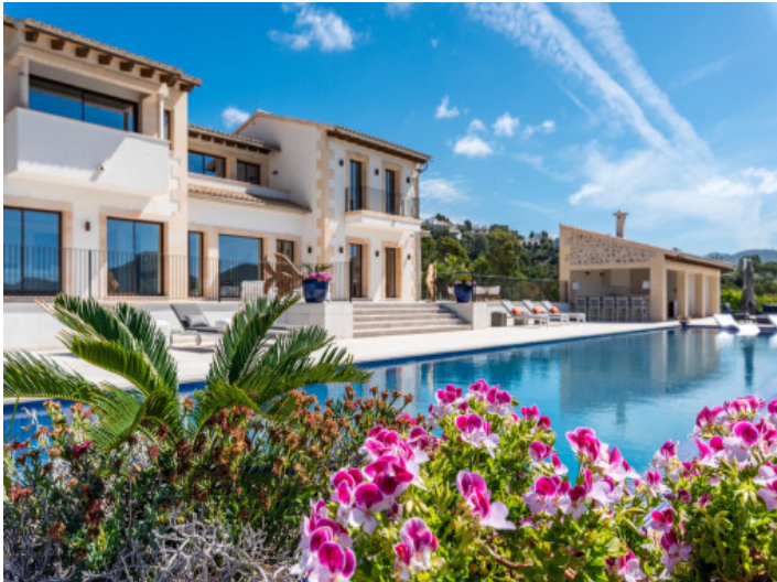
Blick auf den Pool