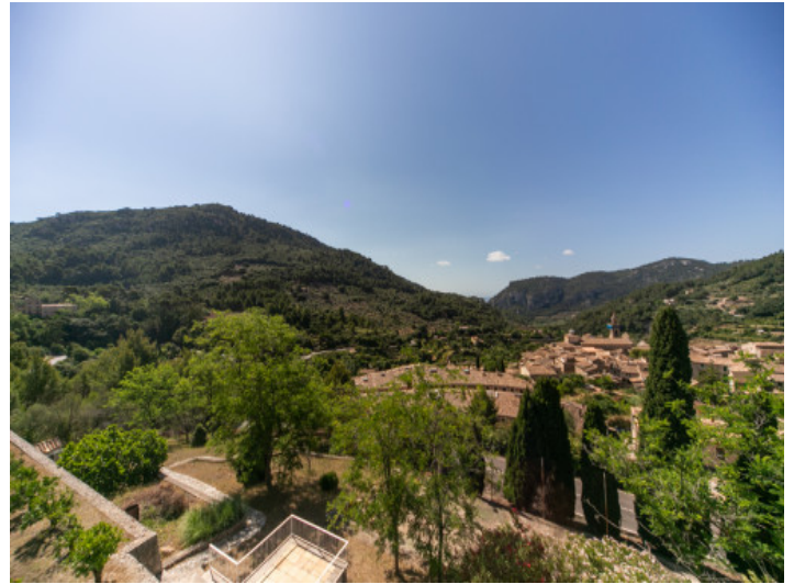
Beeindruckender Blick auf Valldemossa