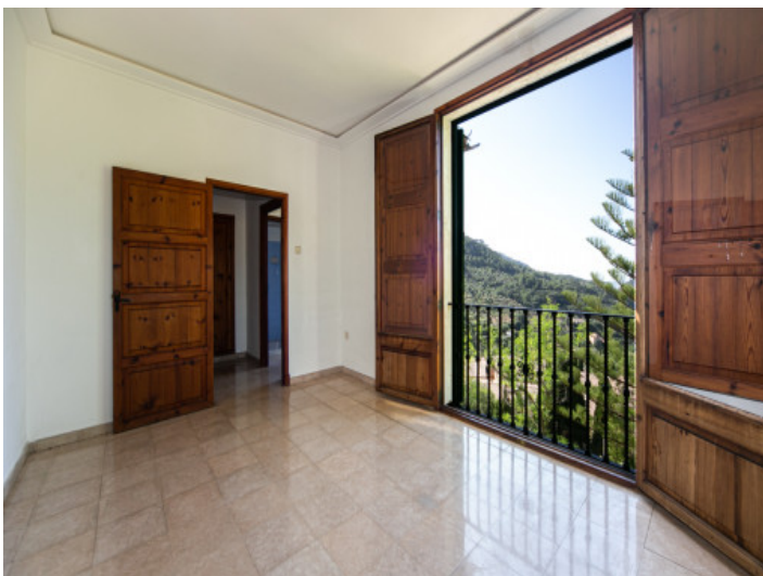
Eines von 8 Schlafzimmern