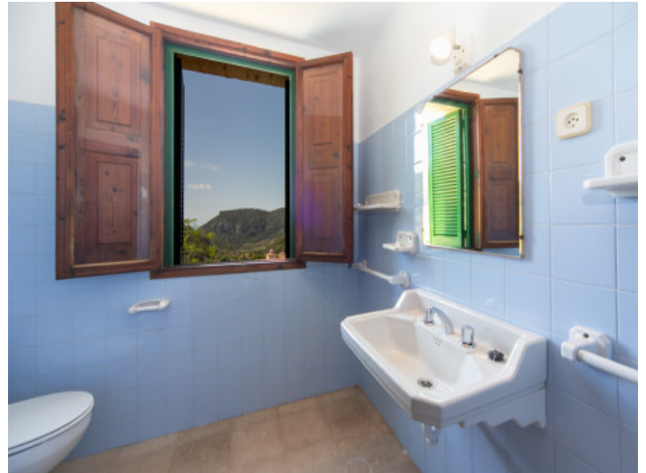
Eines von 5 Badezimmer