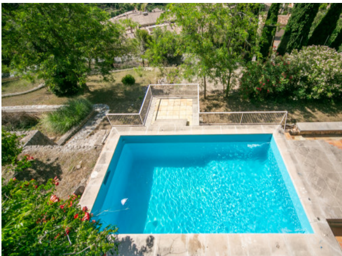
Blick zum Pool