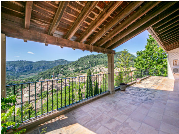
Große Terrasse mit Dorfblick