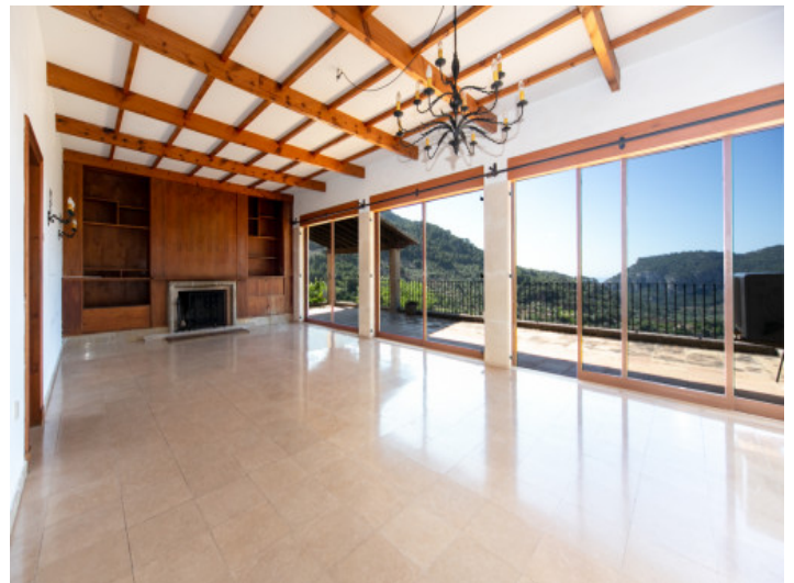
Lichtdurchfluteter Wohnbereich mit Panoramafenstern