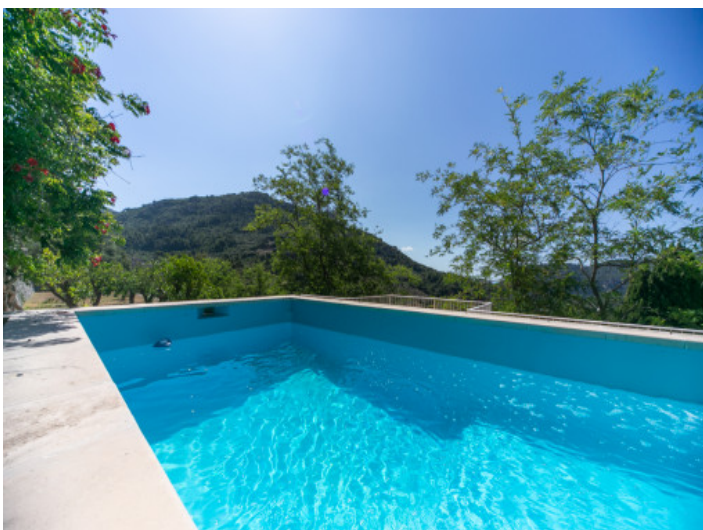
Pool für heiße Sommertage