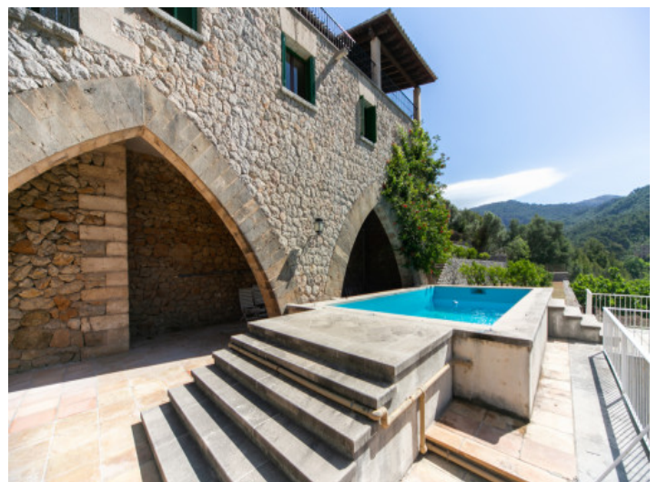
Pool mit teilweise überdachter Terrasse

Alle Angaben nach bestem Wissen. Irrtum und Zwischenverkauf vorbehalten. Dieses Exposé ist eine Vorinformation, als Rechtsgrundlage gilt allein der notariell abgeschlossene Kaufvertrag.