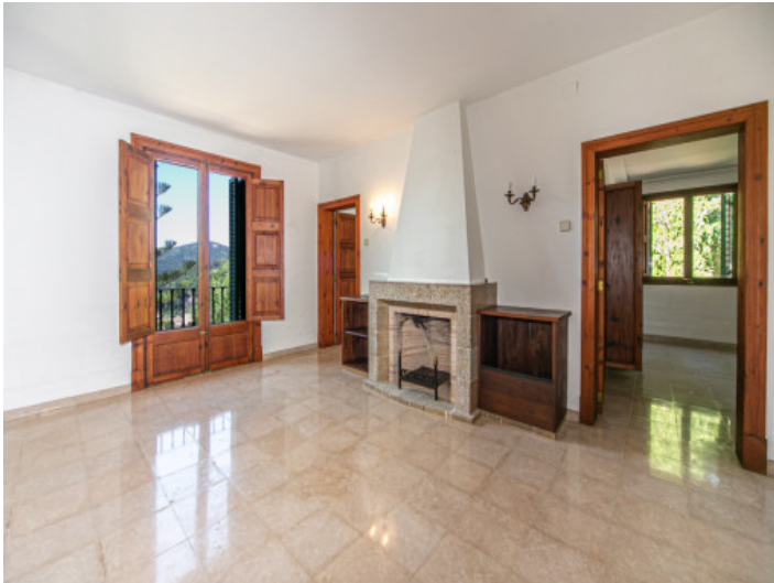
Raum mit Kamin