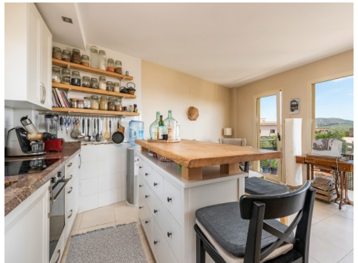
Offene, helle Küche