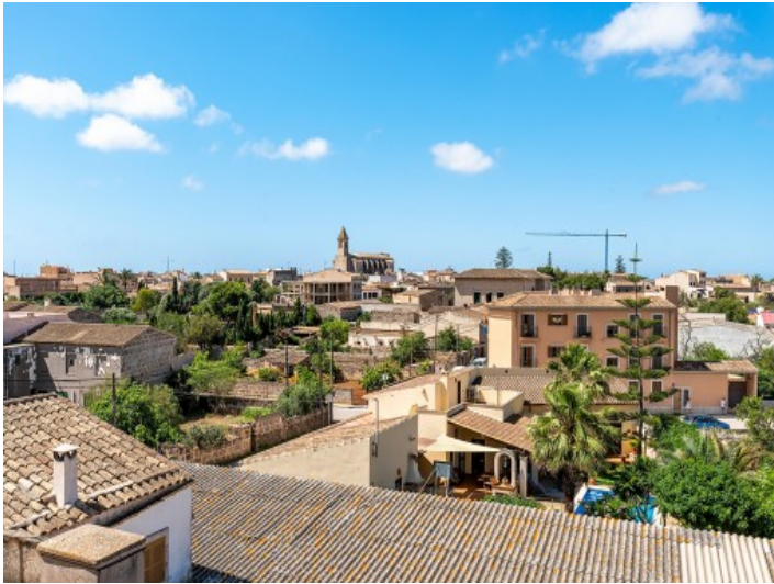
Schöner Blick auf das Dorf