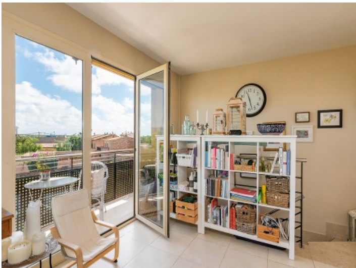
Zugang zum Balkon