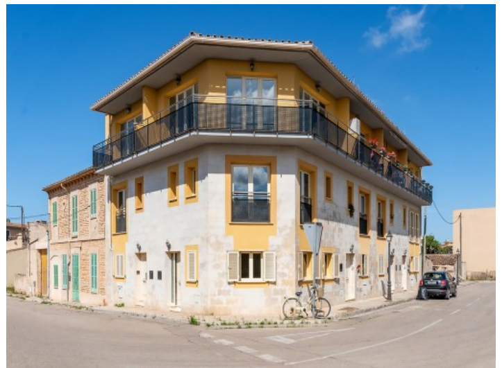
Außenansicht des Hauses

Alle Angaben nach bestem Wissen. Irrtum und Zwischenverkauf vorbehalten. Dieses Exposé ist eine Vorinformation, als Rechtsgrundlage gilt allein der notariell abgeschlossene Kaufvertrag.