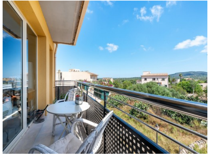
Balkon mit Weitblick