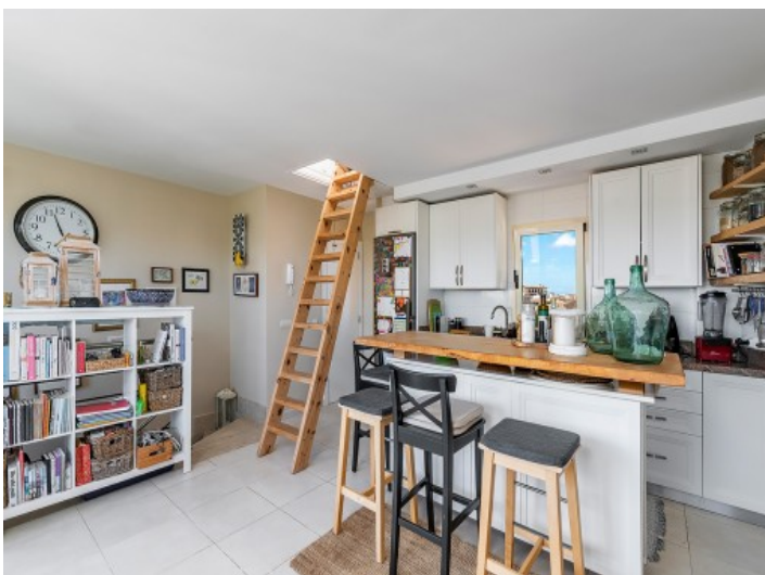
Gemütliche Küche mit Zugang zur Dachterrasse