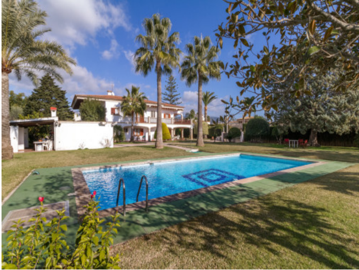
Pool und Villa