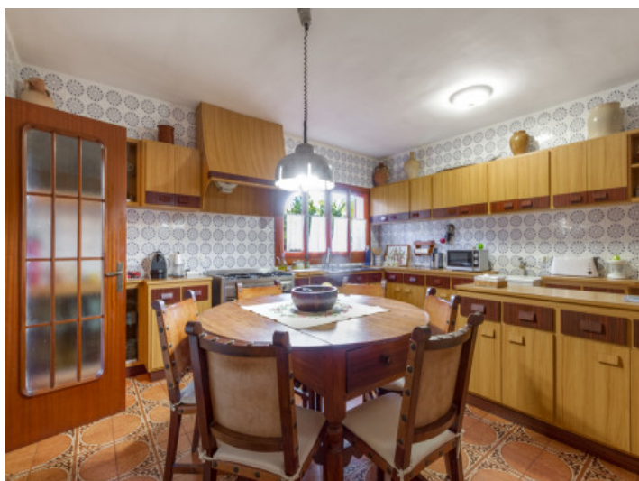
Weiterer Essbereich in der Küche