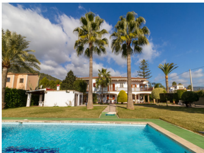
Sonniger Poolbereich mit Palmen