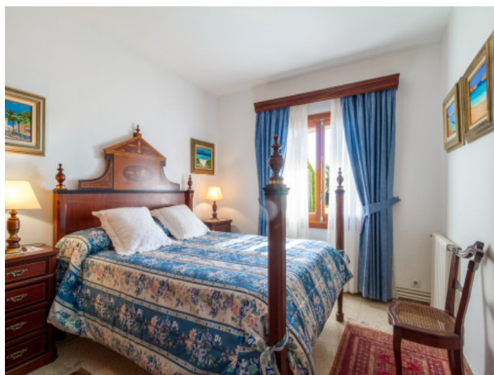
Eines von 6 Schlafzimmern