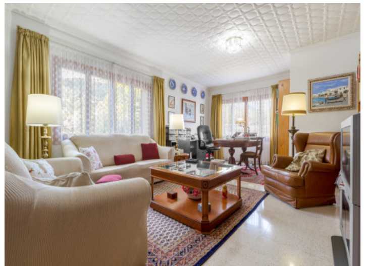
Einladender Wohn- und Arbeitsbereich

Alle Angaben nach bestem Wissen. Irrtum und Zwischenverkauf vorbehalten. Dieses Exposé ist eine Vorinformation, als Rechtsgrundlage gilt allein der notariell abgeschlossene Kaufvertrag.