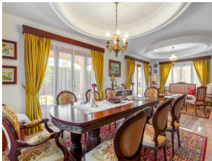
Heller und großzügiger Essbereich