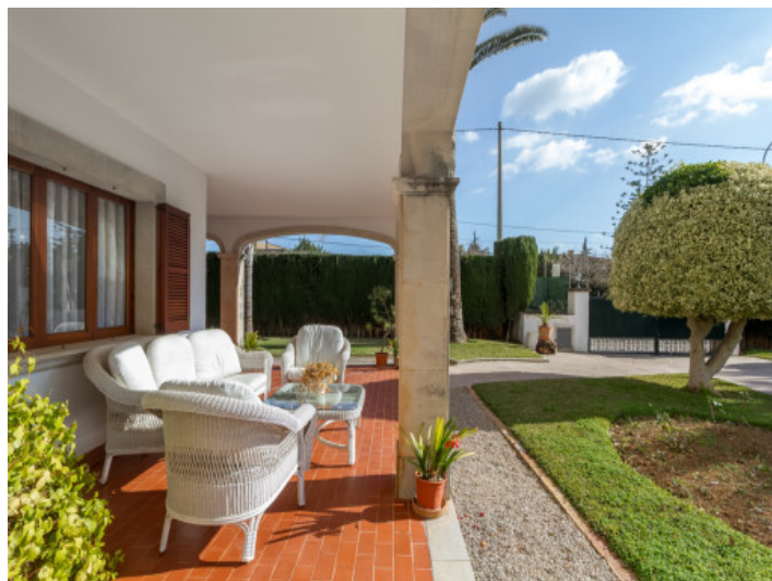
Weitere überdachte Terrasse