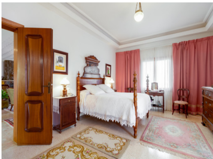
Eines von 6 Schlafzimmern