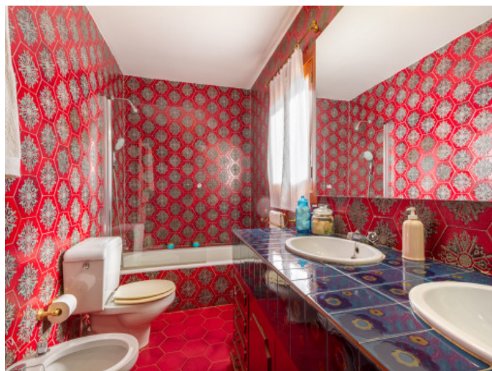
Eines von 5 Badezimmern

Alle Angaben nach bestem Wissen. Irrtum und Zwischenverkauf vorbehalten. Dieses Exposé ist eine Vorinformation, als Rechtsgrundlage gilt allein der notariell abgeschlossene Kaufvertrag.