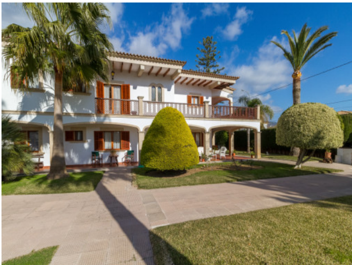
Außenansicht der Villa