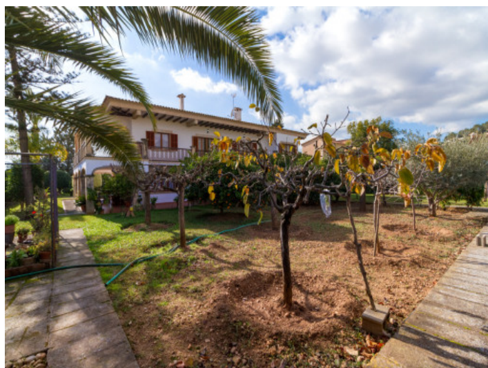
Garten mit Obstbäumen