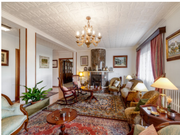
Einzigartiger Wohnbereich mit Kamin