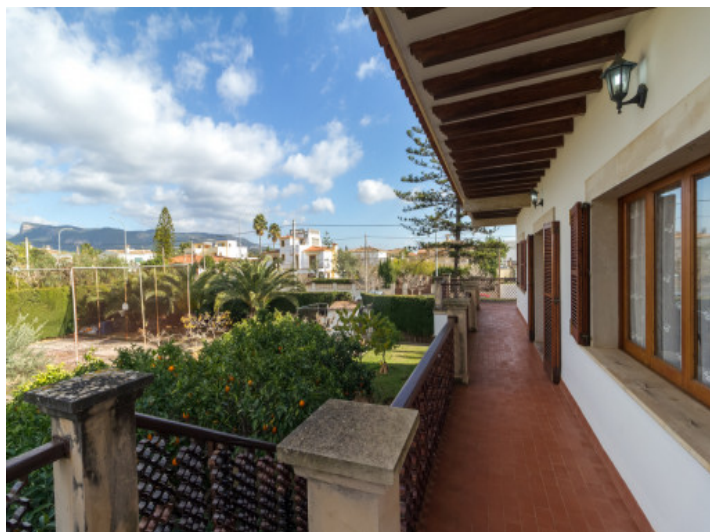
Gartenbereich mit Obstbäumen