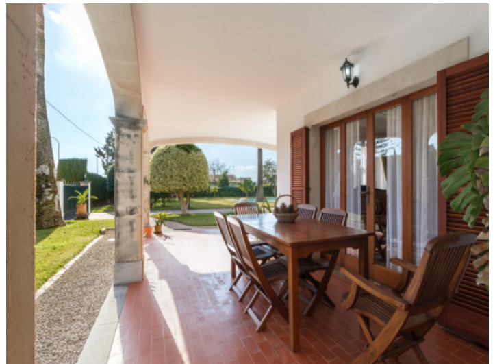
Wundervoller Essbereich auf der Terrasse