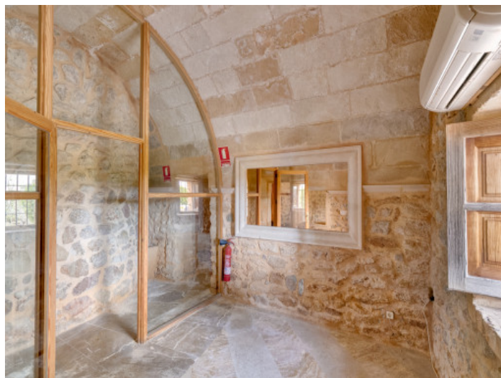
Lagerraum mit Klimaanlage