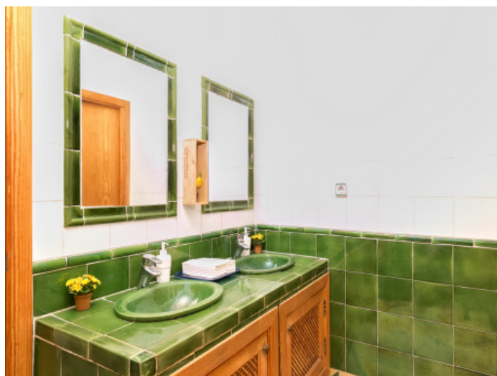
Toilettenraum mit Doppelwaschbecken