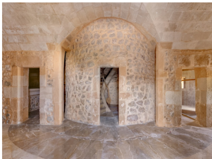
Eine Umwandlung zu einem eindrucksvollen Wohnhaus ist möglich

Alle Angaben nach bestem Wissen. Irrtum und Zwischenverkauf vorbehalten. Dieses Exposé ist eine Vorinformation, als Rechtsgrundlage gilt allein der notariell abgeschlossene Kaufvertrag.