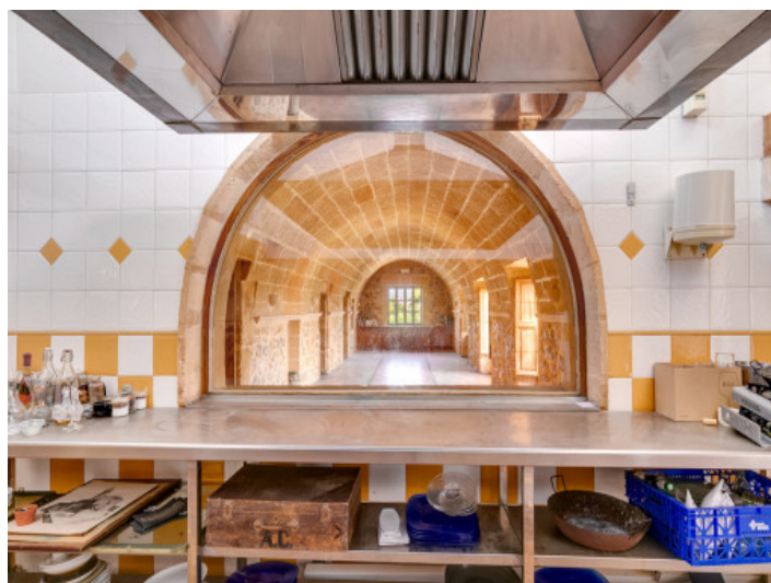
Fantastischer Blick von der Küche in den Gastraum