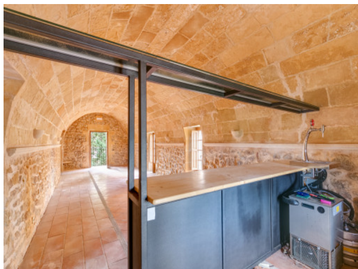
Hervorragende und spezielle Location für ein Restaurant

Alle Angaben nach bestem Wissen. Irrtum und Zwischenverkauf vorbehalten. Dieses Exposé ist eine Vorinformation, als Rechtsgrundlage gilt allein der notariell abgeschlossene Kaufvertrag.