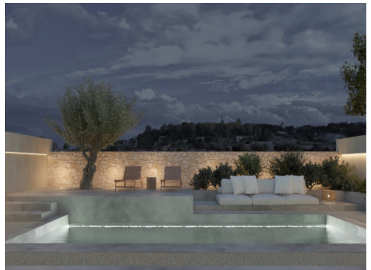
Beleuchtete Terrasse und Pool bei Nacht

Alle Angaben nach bestem Wissen. Irrtum und Zwischenverkauf vorbehalten. Dieses Exposé ist eine Vorinformation, als Rechtsgrundlage gilt allein der notariell abgeschlossene Kaufvertrag.