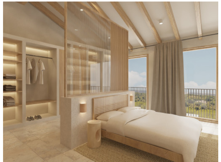
Schlafzimmer mit Weitblick