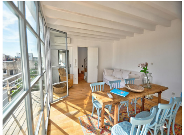
Heller Wohn- und Essbereich