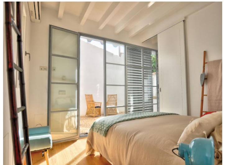
Schlafzimmer im Erdgeschoss