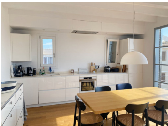
Moderne und helle Küche mit Balkon