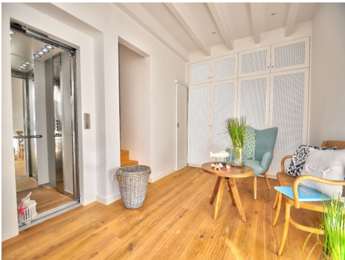
Stadthaus mit Fahrstuhl