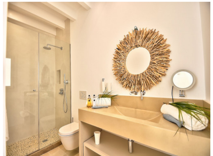
Badezimmer im Erdgeschoss

Alle Angaben nach bestem Wissen. Irrtum und Zwischenverkauf vorbehalten. Dieses Exposé ist eine Vorinformation, als Rechtsgrundlage gilt allein der notariell abgeschlossene Kaufvertrag.