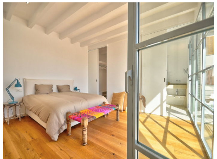
Mastersuite mit privater Terrasse

Alle Angaben nach bestem Wissen. Irrtum und Zwischenverkauf vorbehalten. Dieses Exposé ist eine Vorinformation, als Rechtsgrundlage gilt allein der notariell abgeschlossene Kaufvertrag.