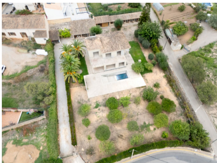
Villa im Rohbau