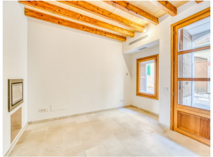
Eingangs- und Wohnbereich