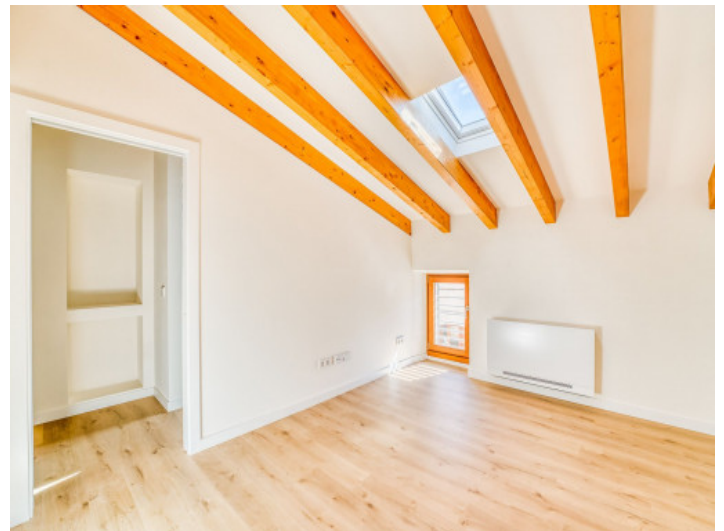
Schlafzimmer auf der 2. Etage