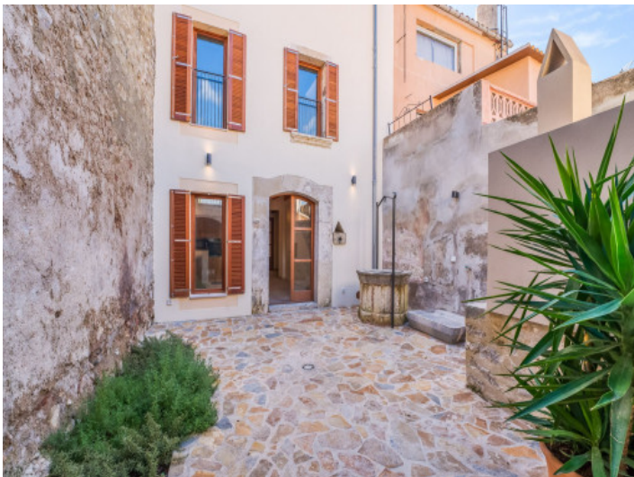
Patio de Houses