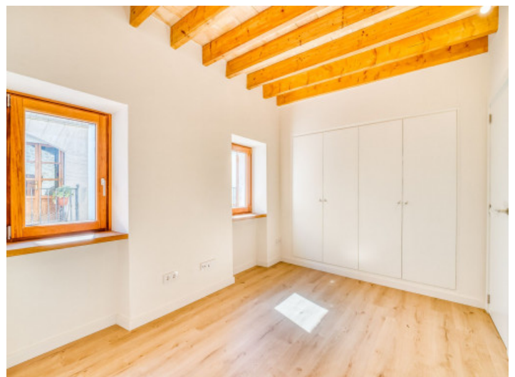
Zweites Schlafzimmer auf der 1. Etage

Alle Angaben nach bestem Wissen. Irrtum und Zwischenverkauf vorbehalten. Dieses Exposé ist eine Vorinformation, als Rechtsgrundlage gilt allein der notariell abgeschlossene Kaufvertrag.