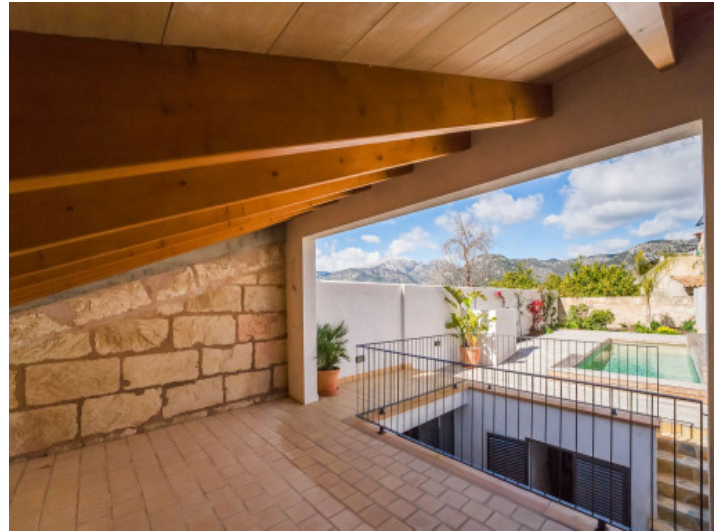
Loungeterrasse neben dem Pool