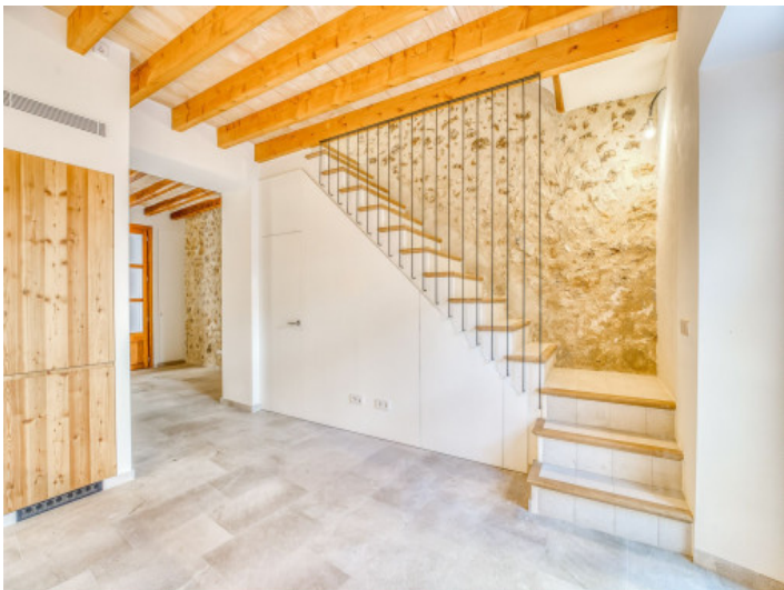
Treppe nach oben