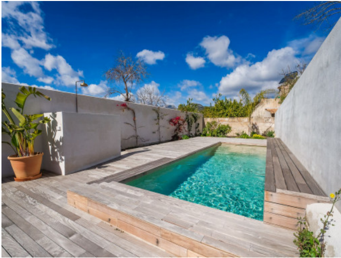
Private Sonnenterrasse mit Pool