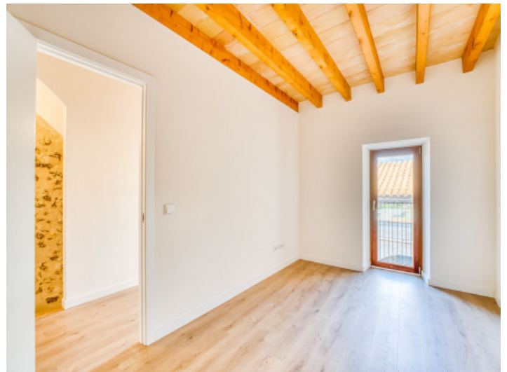
Erstes Schlafzimmer in der ersten Etage