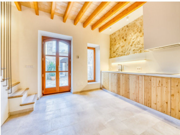
Küche mit Patiozugang