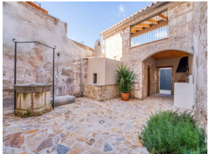
Zugang zum Poolbereich und ins Haus