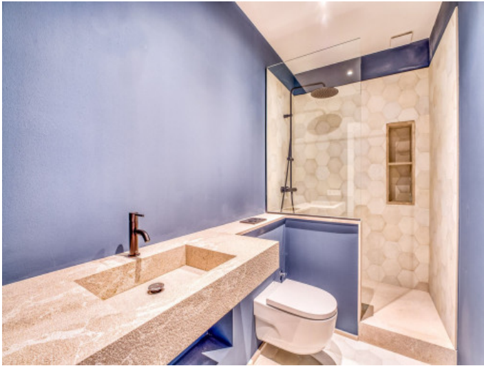
Badezimmer auf der 1. Etage