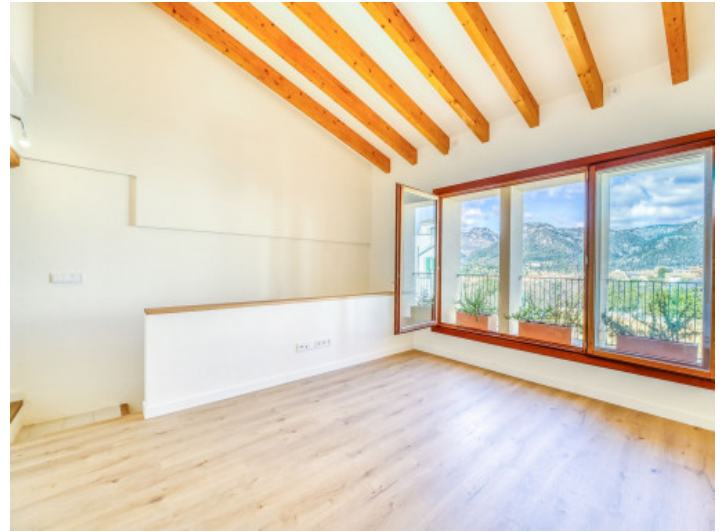
Wohnbereich auf der 2. Etage