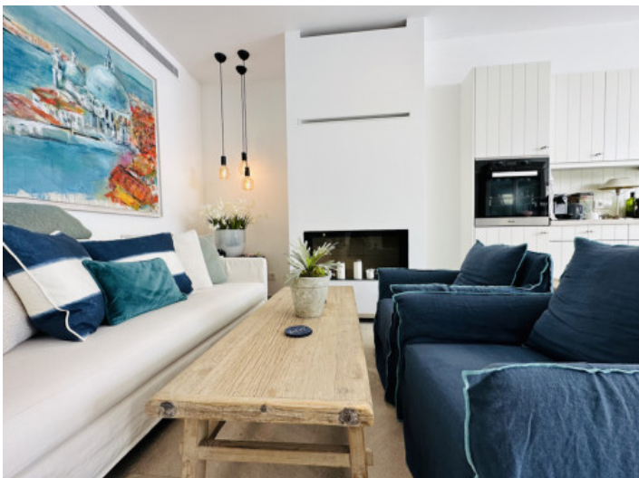
Gemütlicher Wohnbereich mit Kamin