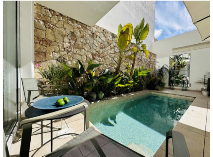
Mediterraner, geräumiger Patio mit Pool