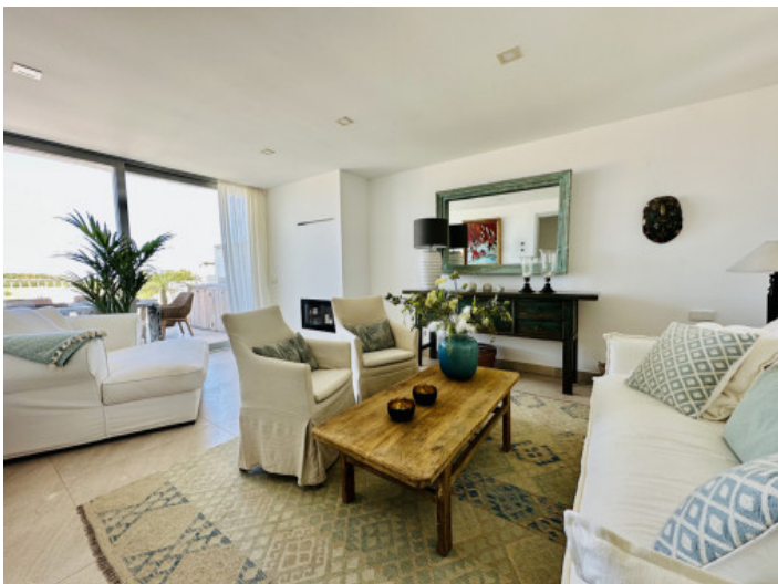
Wohnbereich auf der obersten Etage