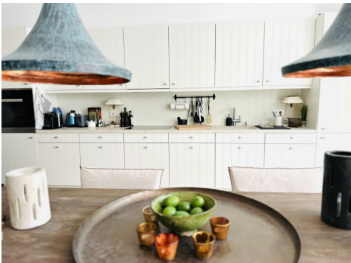
Küche im Landhausstil