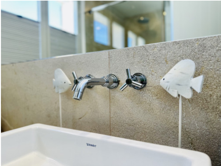
Detailaufnahme im Badezimmer