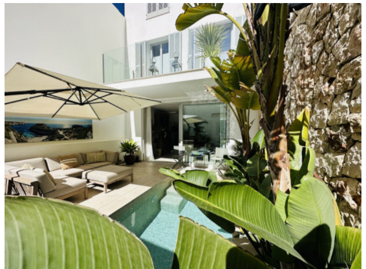
Wohlfühloase mit einheimischen Pflanzen

Alle Angaben nach bestem Wissen. Irrtum und Zwischenverkauf vorbehalten. Dieses Exposé ist eine Vorinformation, als Rechtsgrundlage gilt allein der notariell abgeschlossene Kaufvertrag.