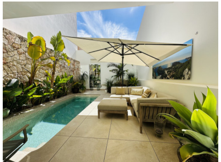
Patio mit Pool und Chill-Out-Bereich