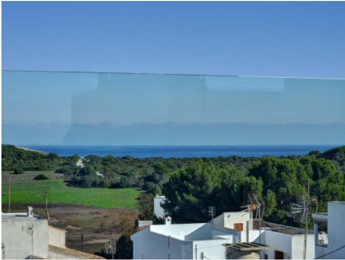
Traumhafter Panoramablick bis zum Meer