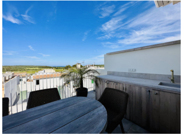
Einladende Sitzmöglichkeit auf der Terrasse