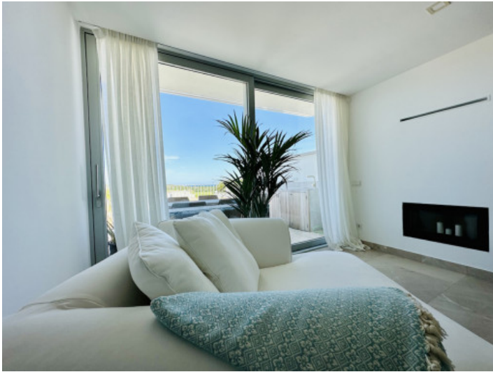
Zweiter Wohnbereich mit Kamin