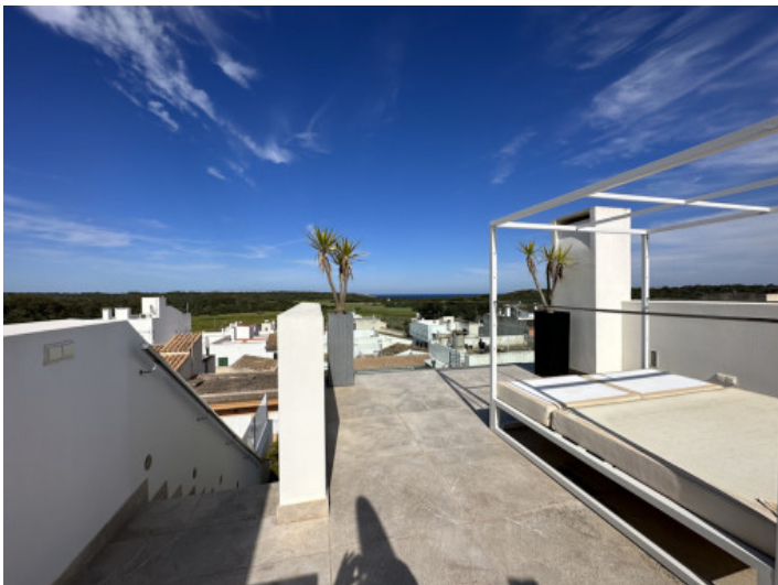
Große Dachterrasse mit spektakulären Blick