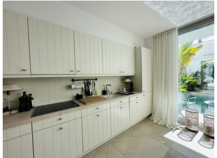
Offene, komplett ausgestattete Küche