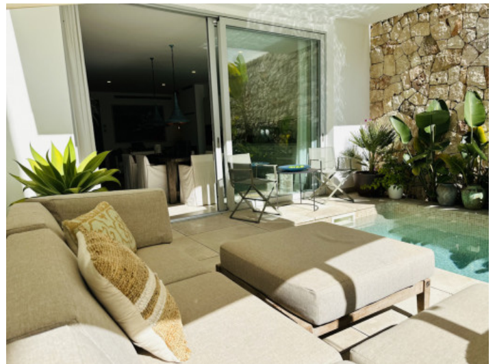
Einladender Chill-Out-Bereich am Pool