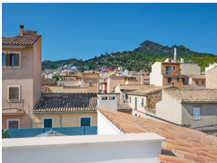
Blick über die Dächer von Andratx