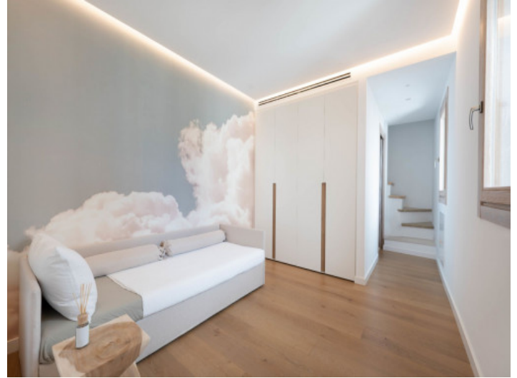
Eines von 3 Schlafzimmern