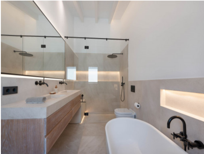
Badezimmer en Suite