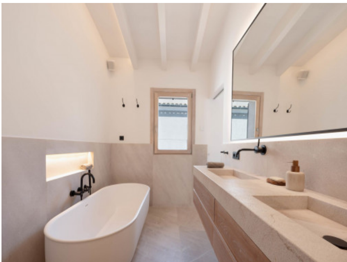
Eines von 3 Badezimmern