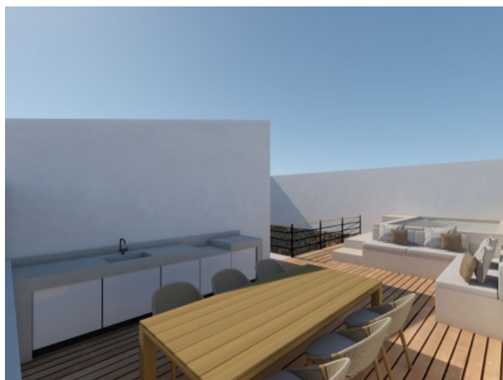
Ansicht auf den zukünftigen Pool