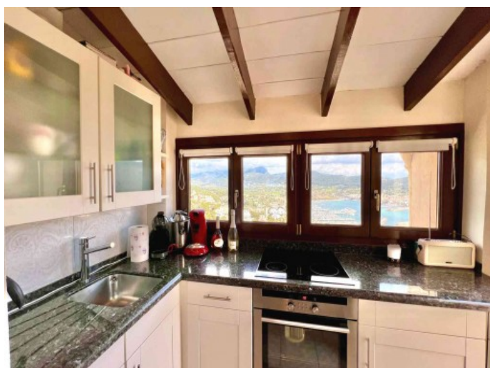
Küche mit Ausblick