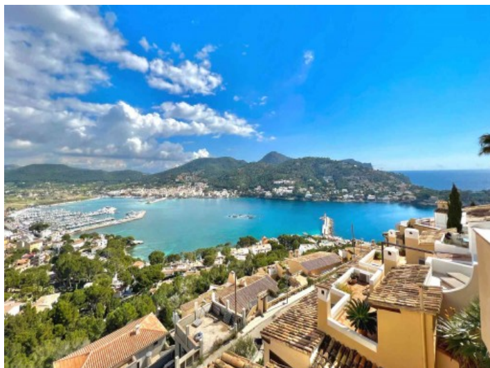
Blick auf den Hafen Port Andratx