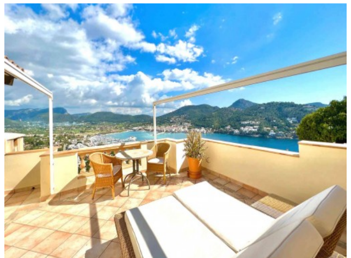
Dachterrasse mit Weitblick

Alle Angaben nach bestem Wissen. Irrtum und Zwischenverkauf vorbehalten. Dieses Exposé ist eine Vorinformation, als Rechtsgrundlage gilt allein der notariell abgeschlossene Kaufvertrag.