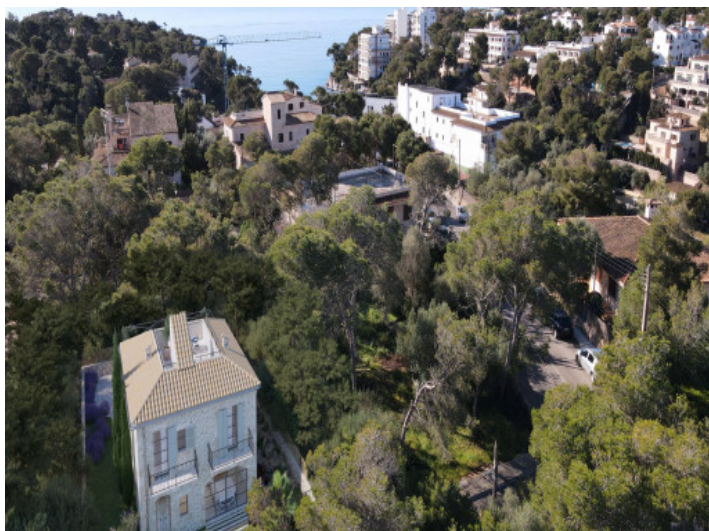
Blick zur Bucht