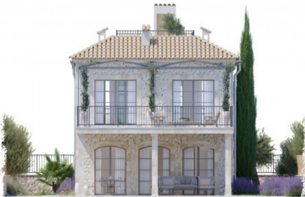
Fassade mit Balkon