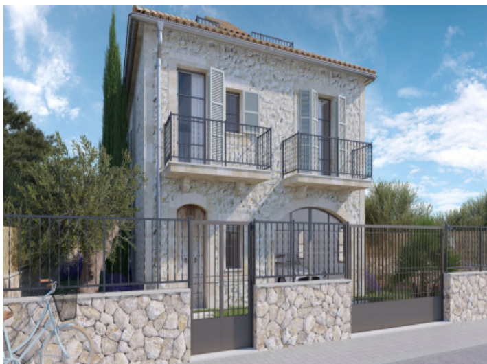
Blick von der Straße auf das Haus