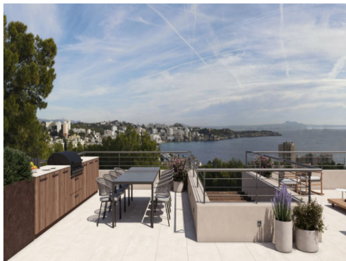
Komfortable Dachterrasse mit Aussenküche