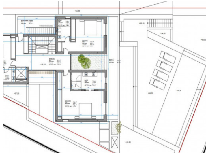
Grundriss 1. Etage

Alle Angaben nach bestem Wissen. Irrtum und Zwischenverkauf vorbehalten. Dieses Exposé ist eine Vorinformation, als Rechtsgrundlage gilt allein der notariell abgeschlossene Kaufvertrag.