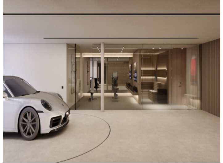
Fitnessraum und Sauna