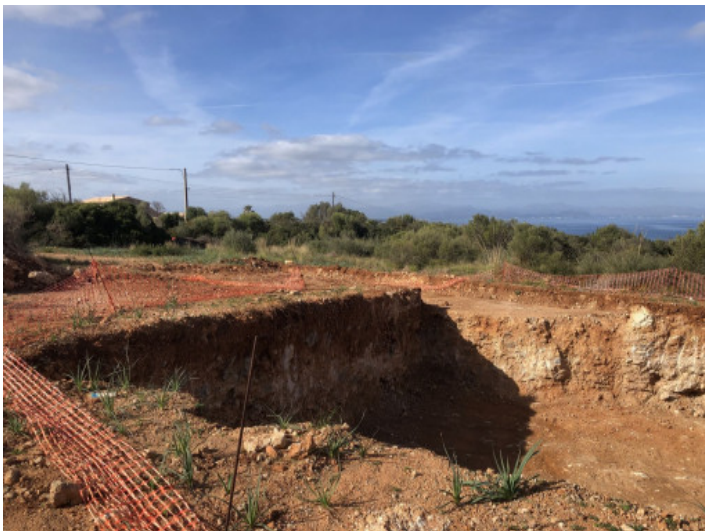
16.000 qm Bauland