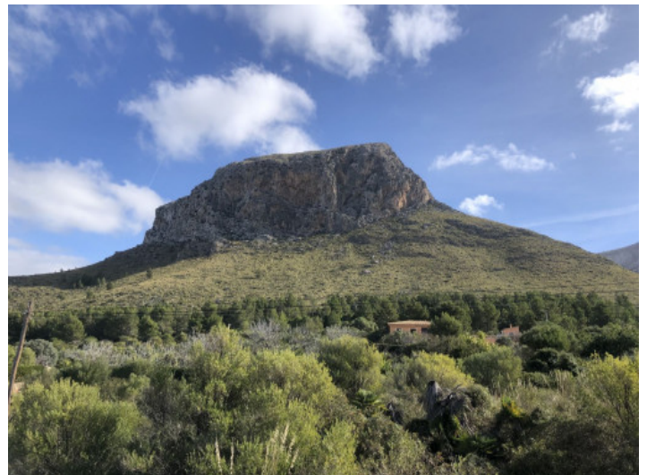
Aussicht auf den Mont Ferrutx