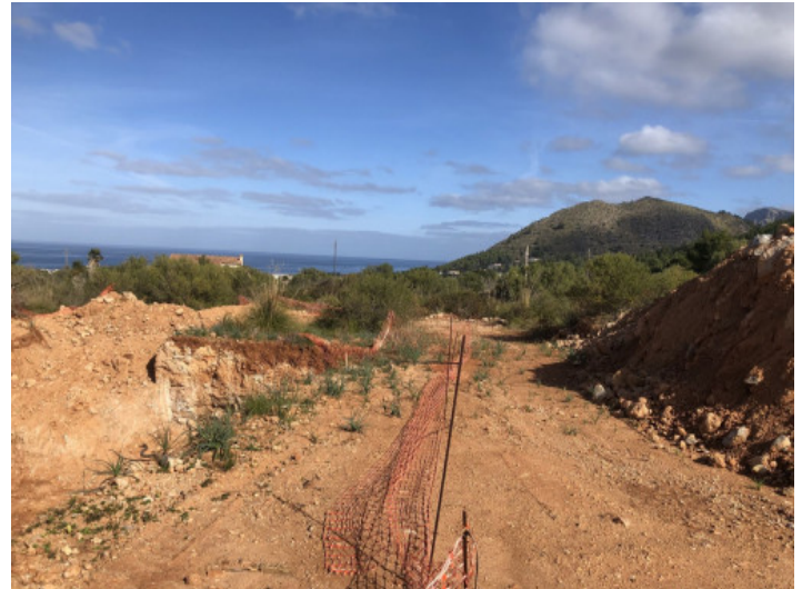
16.000 qm Bauland