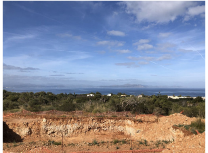
Weitblick bis hin zum Meer