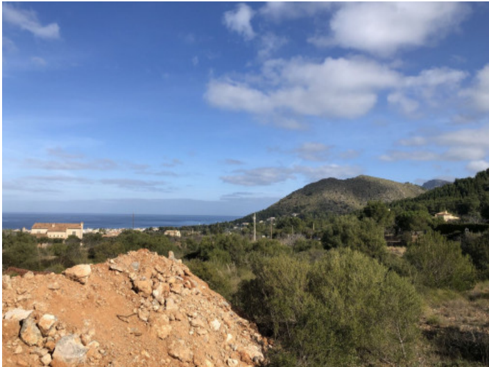
Arta ist ca. 6km entfernt