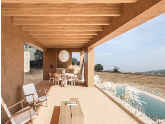
Baugrundstück mit Projekt in Villafranca de Bonany