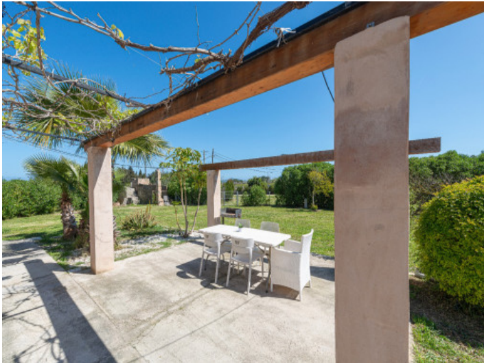
Essbereich im Freien mit Pergola und Naturblick