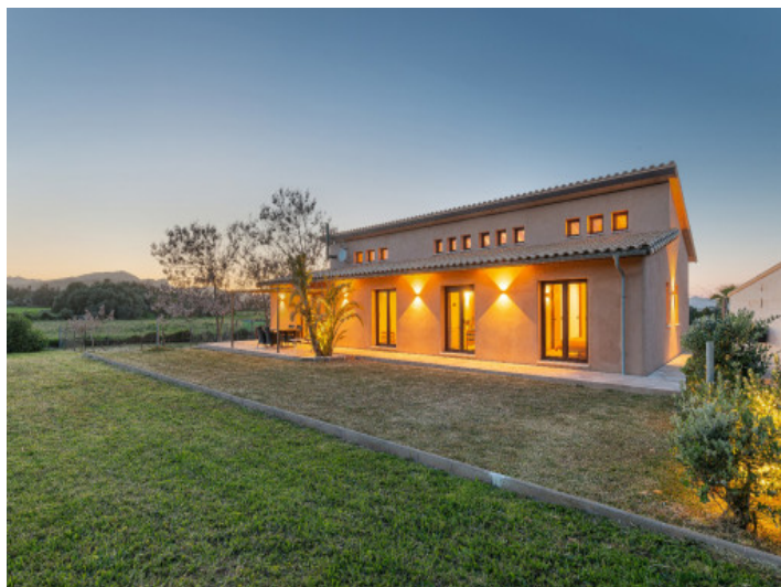
Natürliches Licht trifft Öko-Design