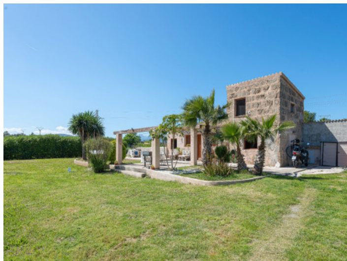
Steinhaus mit mallorquinischem Charme