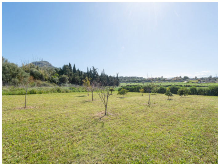
Obstgarten mit Weitblick und junger Bepflanzung