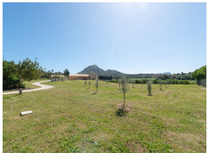
Panoramablick auf das Grundstück mit Olivenbäumen, Finca und Garage

Alle Angaben nach bestem Wissen. Irrtum und Zwischenverkauf vorbehalten. Dieses Exposé ist eine Vorinformation, als Rechtsgrundlage gilt allein der notariell abgeschlossene Kaufvertrag.