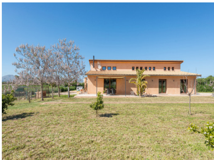
Nachhaltiges Haus mit Blütengarten und Ausblick