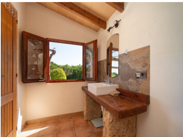
Rustikales Bad mit Blick ins Grüne