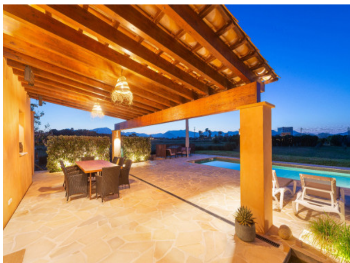
Abende mit Tramuntana-Blick genießen