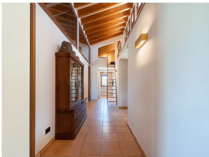
Heller Flur zu den Schlafzimmern und vielseitige Galerie – perfekt für