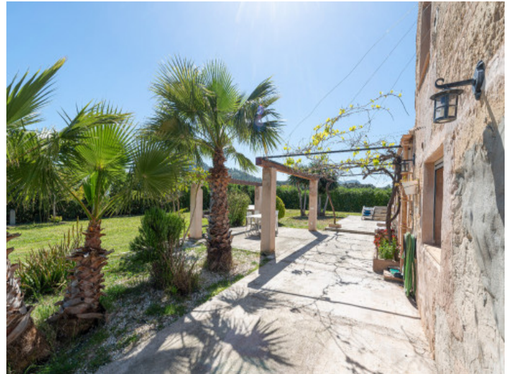
Mediterrane Terrasse am Gästehaus