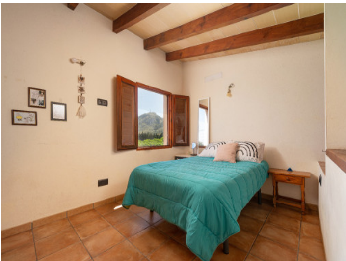
Charmantes Schlafzimmer mit Bergblick