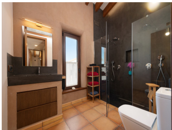
Duschbad en suite