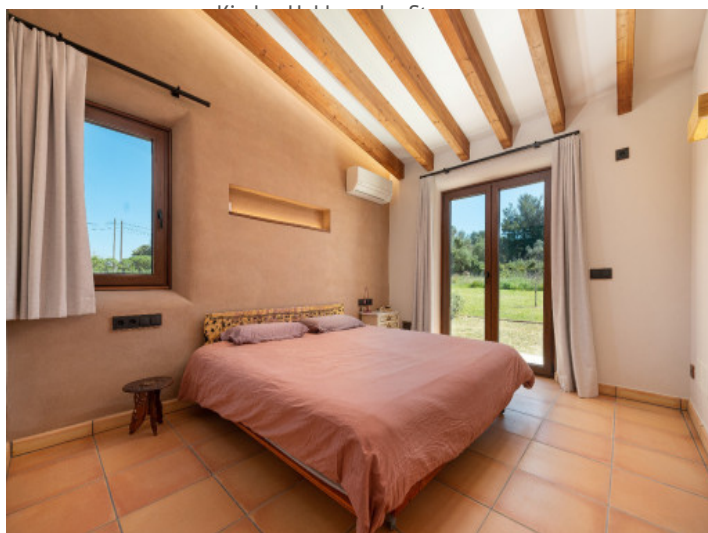
Hauptschlafzimmer mit direktem Gartenzugang.