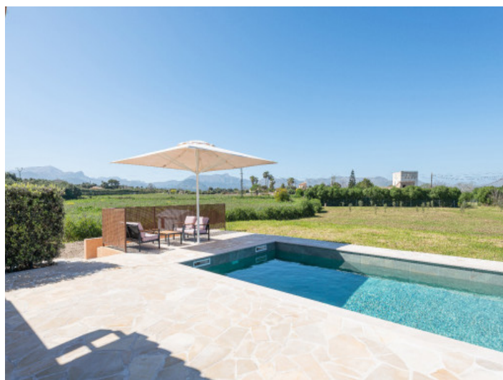
Pool mit Blick aufs ländliche Idyll