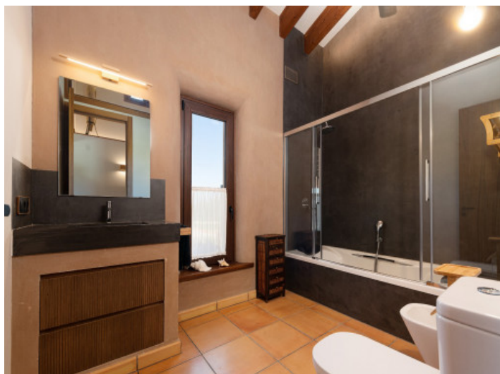
Separates individuelles Badezimmer mit Badewanne