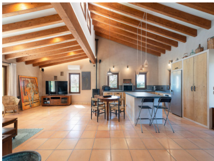
Offene Küche mit natürlicher Wärme

Alle Angaben nach bestem Wissen. Irrtum und Zwischenverkauf vorbehalten. Dieses Exposé ist eine Vorinformation, als Rechtsgrundlage gilt allein der notariell abgeschlossene Kaufvertrag.