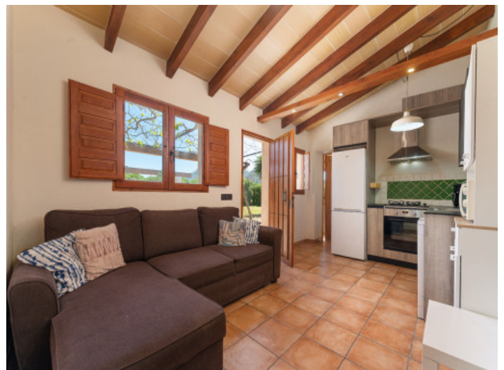
Wohn-Essbereich mit offener Küche im Gästehaus