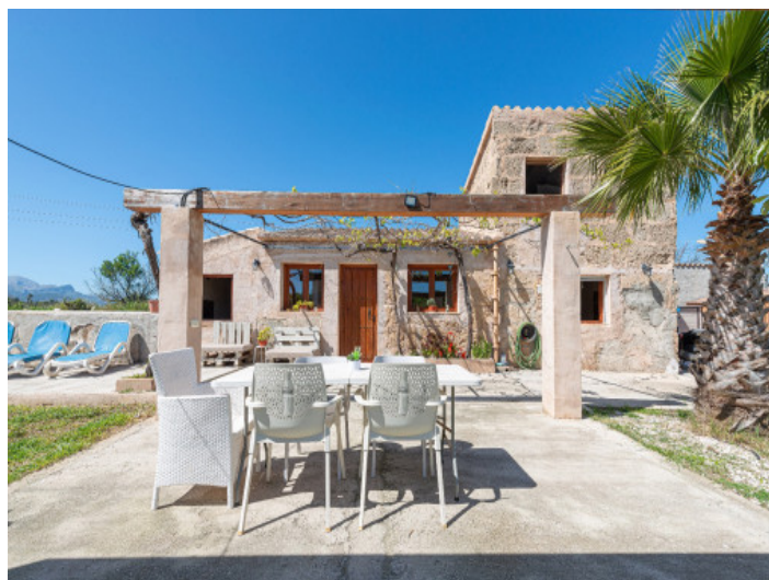
Historisches Gästehaus mit sonniger Terrasse

Alle Angaben nach bestem Wissen. Irrtum und Zwischenverkauf vorbehalten. Dieses Exposé ist eine Vorinformation, als Rechtsgrundlage gilt allein der notariell abgeschlossene Kaufvertrag.