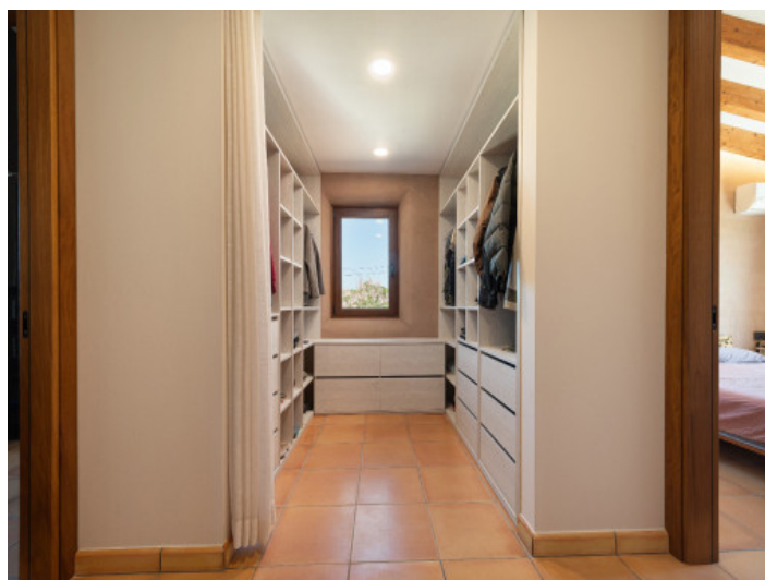
Heller, großzügiger Ankleideraum mit Außenfenster.