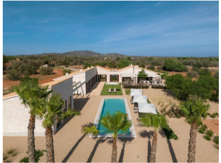
Pool und Terrasse