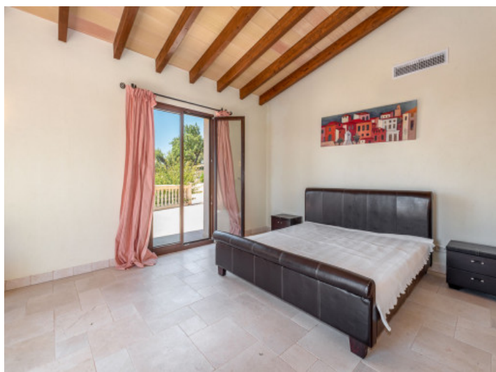
Eines von 10 Schlafzimmern