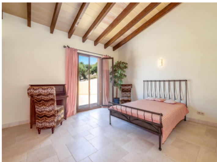
Eines von 10 Schlafzimmern