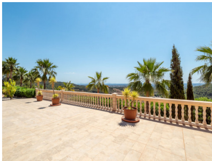
Terrasse mit Blick über die Landschaft