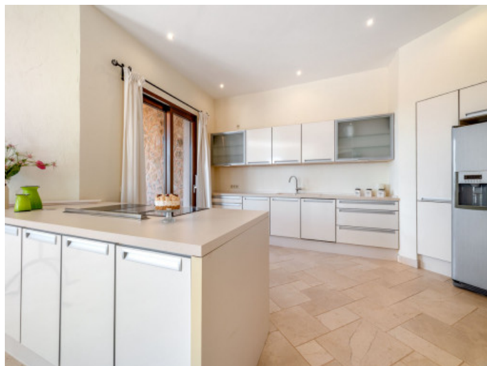
Große, moderne Küche