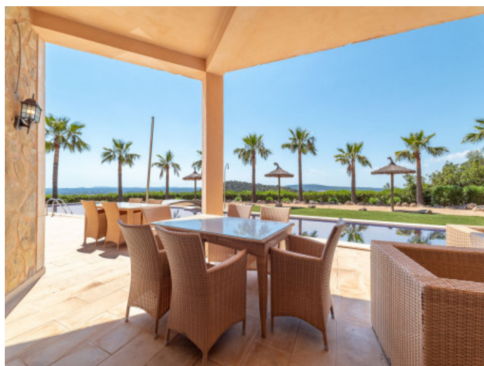
Überdachte Terrasse mit Essbereich