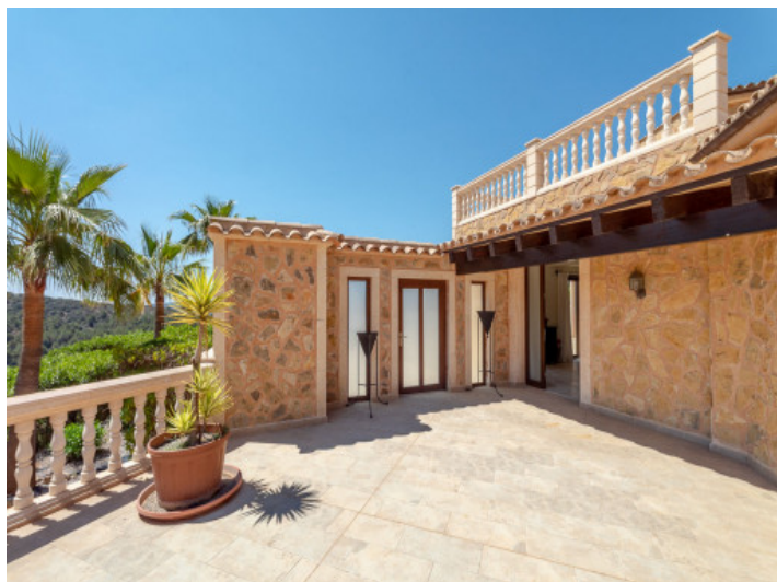
Obere, sonnige Terrasse