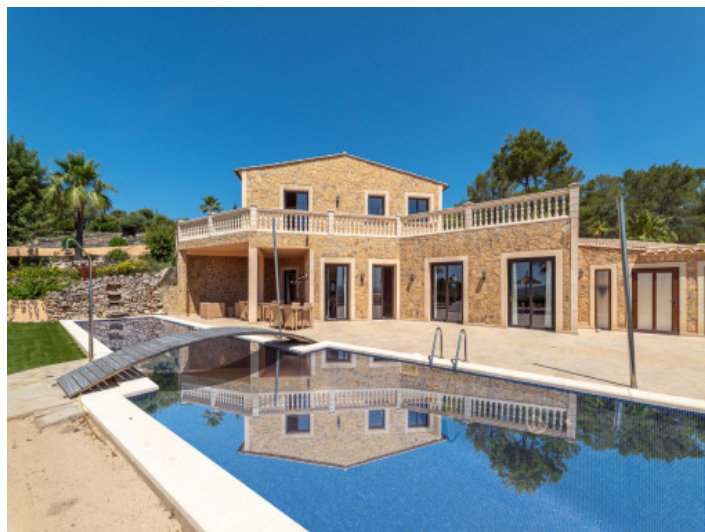
Außenansicht und Poolbereich