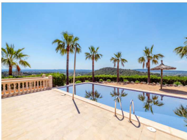
Poolbereich mit schönem Weitblick