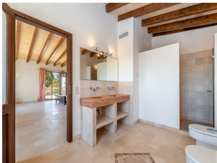
Eines von 6 Badezimmern