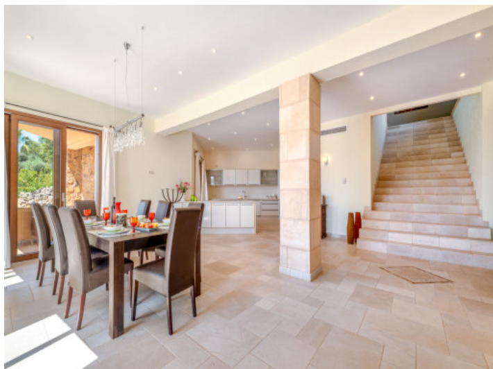
Essbereich und offene Küche