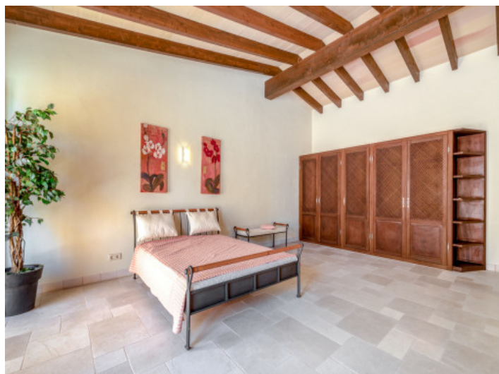
Eines von 10 Schlafzimmern

Alle Angaben nach bestem Wissen. Irrtum und Zwischenverkauf vorbehalten. Dieses Exposé ist eine Vorinformation, als Rechtsgrundlage gilt allein der notariell abgeschlossene Kaufvertrag.