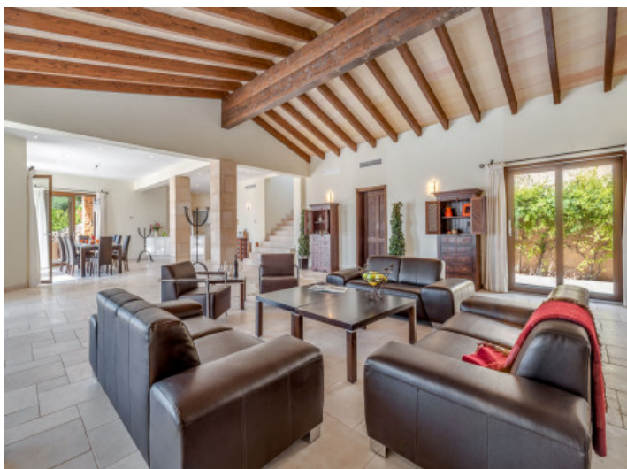
Offener Wohnbereich mit Holzdeckenbalken