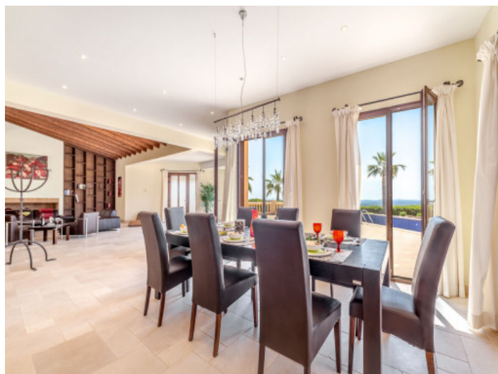
Lichtdurchfluteter Essbereich mit Terrassenzugang

Alle Angaben nach bestem Wissen. Irrtum und Zwischenverkauf vorbehalten. Dieses Exposé ist eine Vorinformation, als Rechtsgrundlage gilt allein der notariell abgeschlossene Kaufvertrag.