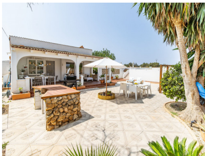
Grillbereich auf der Terrasse