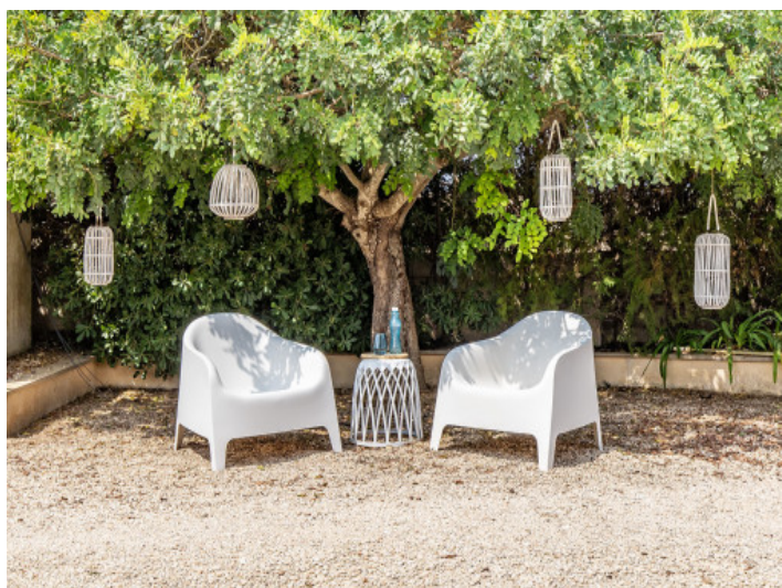
Schattiges Plätzchen im Garten