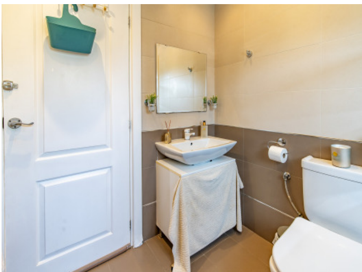
Die Finca verfügt über 2 Badezimmer