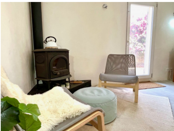
Kaminecke im Wohnbereich