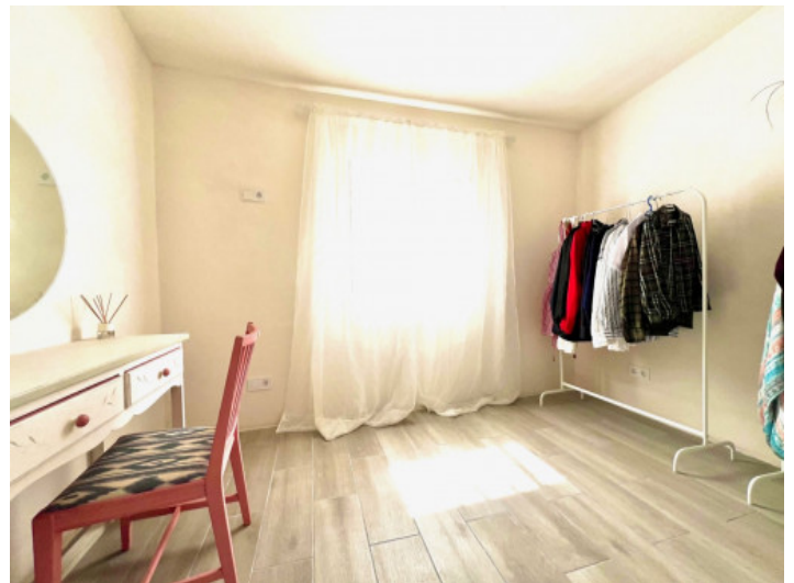
Büro oder Schlafzimmer