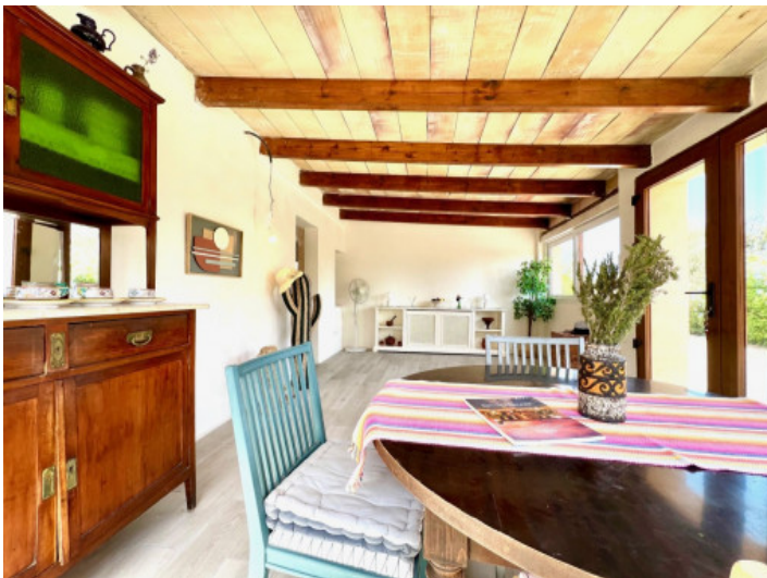
Essbereich im Wintergarten