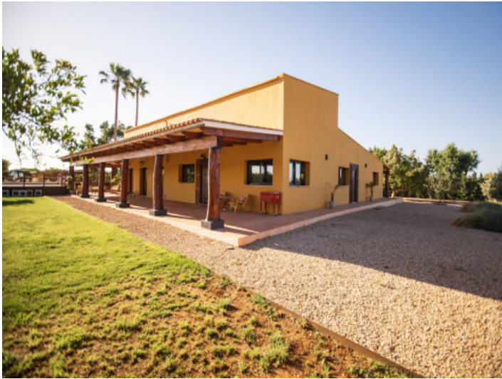
Ansicht auf die Finca