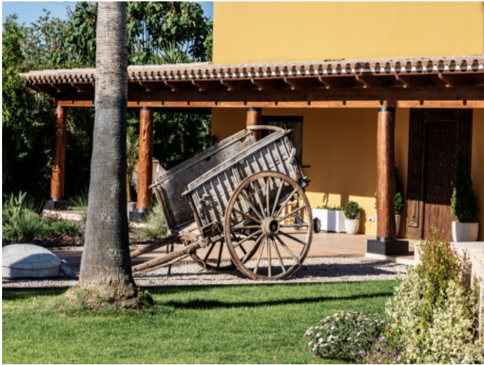
Finca und Garten