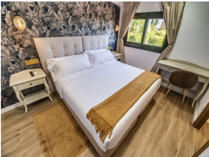
Eines von 12 Schlafzimmern