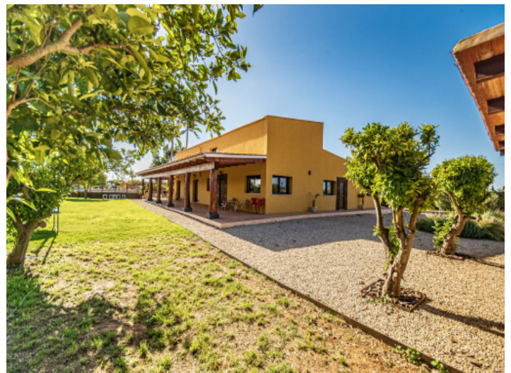
Ansicht auf das Haus

Alle Angaben nach bestem Wissen. Irrtum und Zwischenverkauf vorbehalten. Dieses Exposé ist eine Vorinformation, als Rechtsgrundlage gilt allein der notariell abgeschlossene Kaufvertrag.