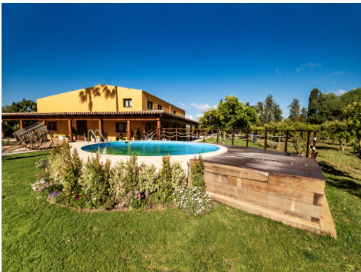
Pool und Garten