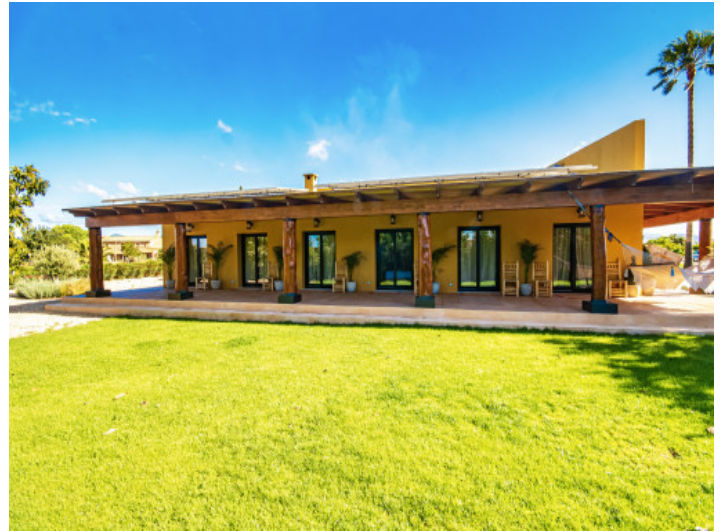
Ansicht auf die Finca