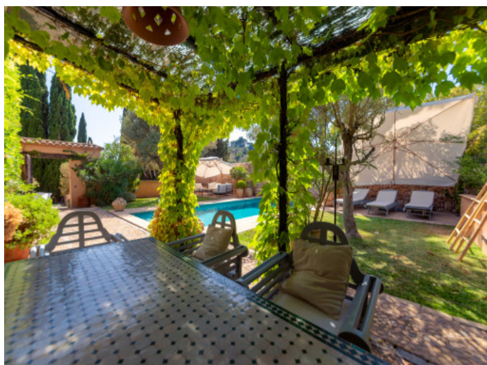
Terrasse im Garten