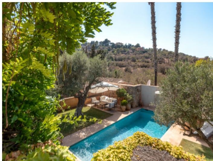
Romantischer Garten mit Pool