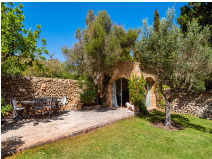
Sehr gepflegter Garten