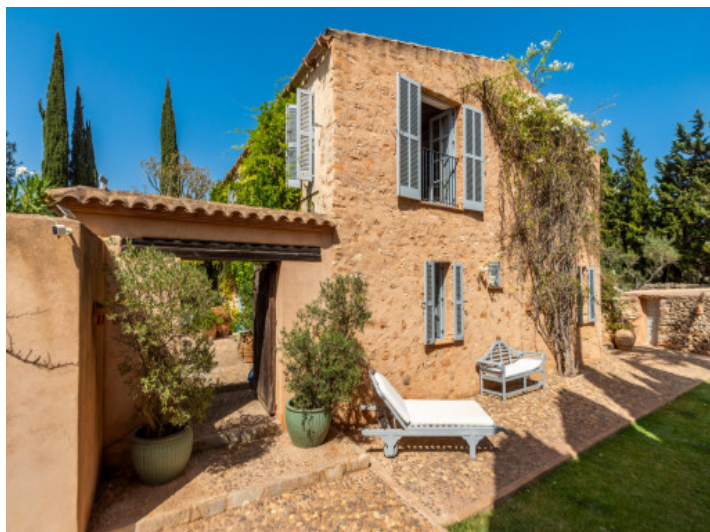
Fassade dieser typischen mallorquinischen Finca