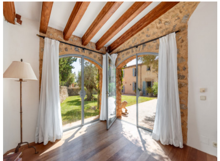
Wunderschöne Ansicht auf den Garten