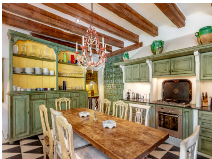
Küche im Landhausstil