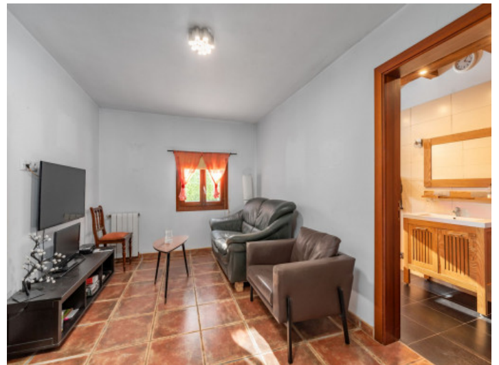
Schlafzimmer mit Badezimmer en Suite