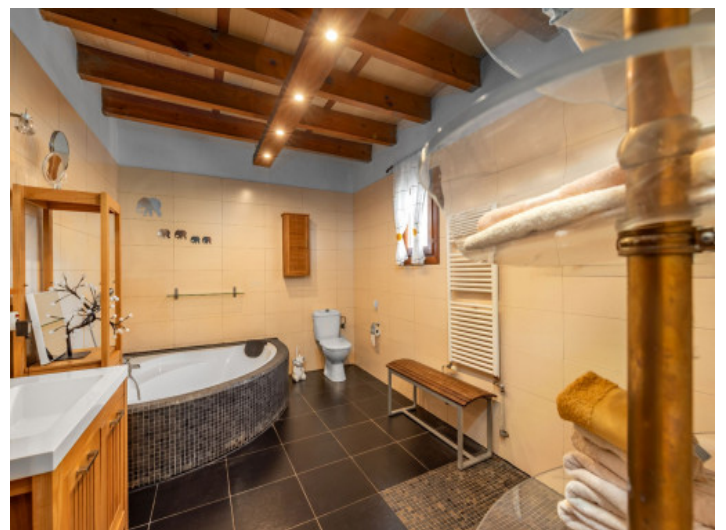
Ein weiteres Badezimmer

Alle Angaben nach bestem Wissen. Irrtum und Zwischenverkauf vorbehalten. Dieses Exposé ist eine Vorinformation, als Rechtsgrundlage gilt allein der notariell abgeschlossene Kaufvertrag.