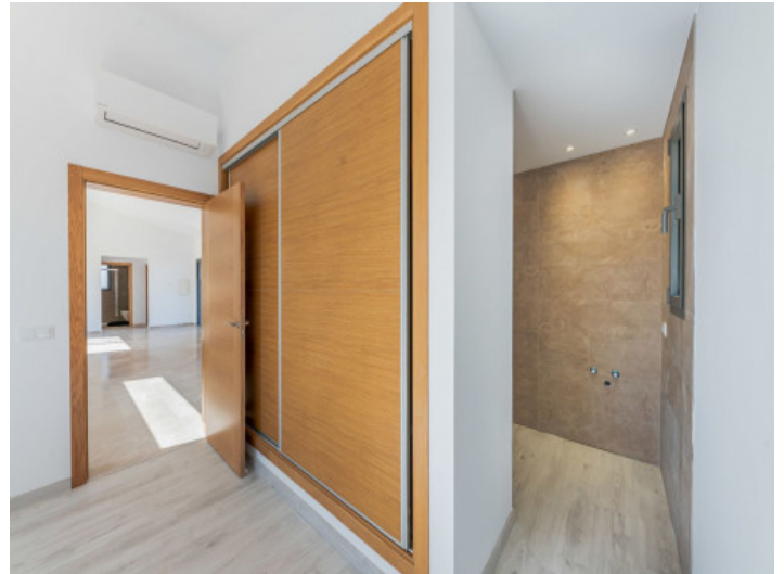
Schlafzimmer mit Bad en Suite