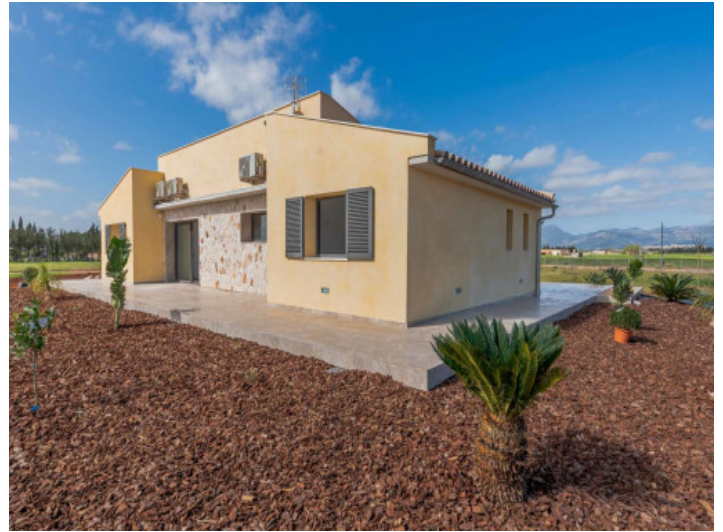
Frontansicht auf die Finca