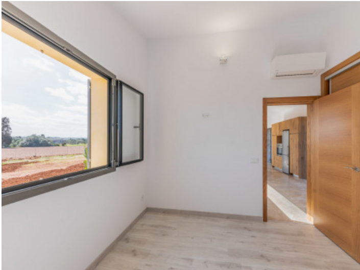
Schlafzimmer im Erdgeschoss