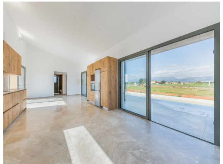
Heller Wohn- und Essbereich