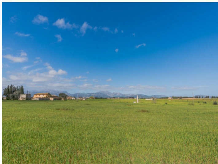
Blick auf das Tramuntana Gebirge