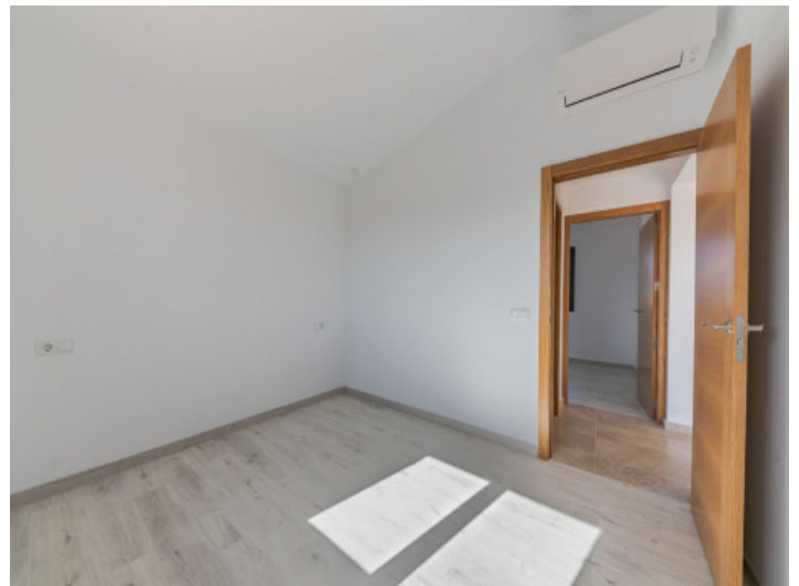
Zwei weitere Schlafzimmer befinden sich im Obergeschoss