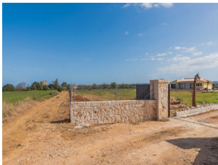
Einfahrt zur Finca