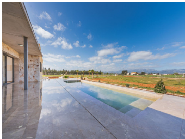
Pool und Terrasse