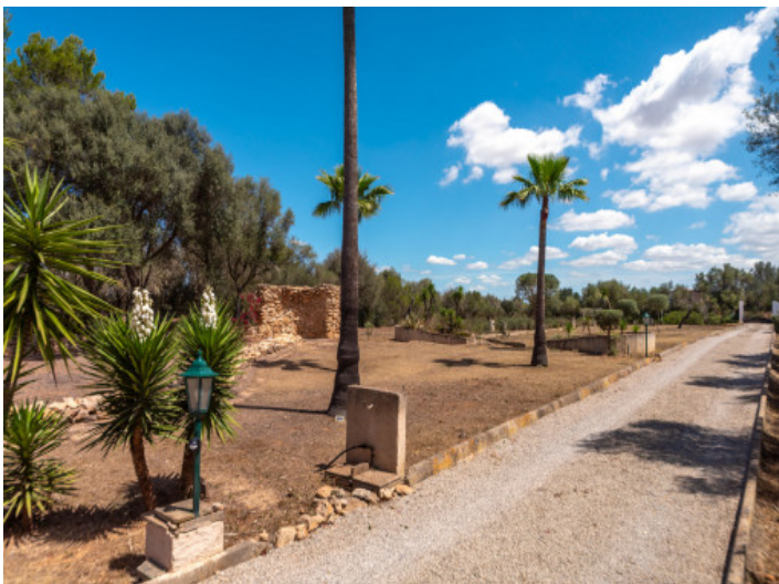
Zugang zur Finca

Alle Angaben nach bestem Wissen. Irrtum und Zwischenverkauf vorbehalten. Dieses Exposé ist eine Vorinformation, als Rechtsgrundlage gilt allein der notariell abgeschlossene Kaufvertrag.