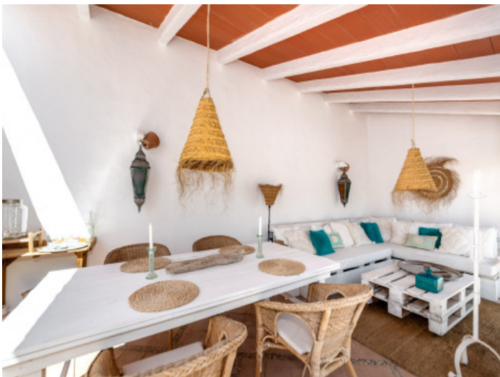
Terrasse und Loungebereich