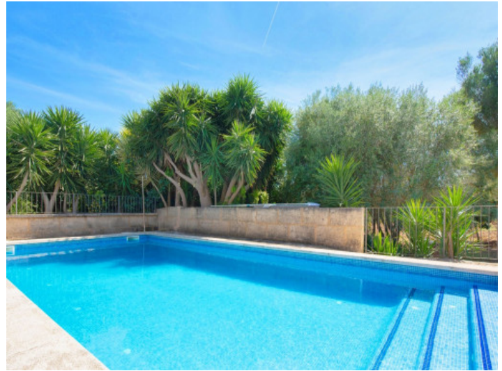
Bequeme Einstiegstreppe in den Pool