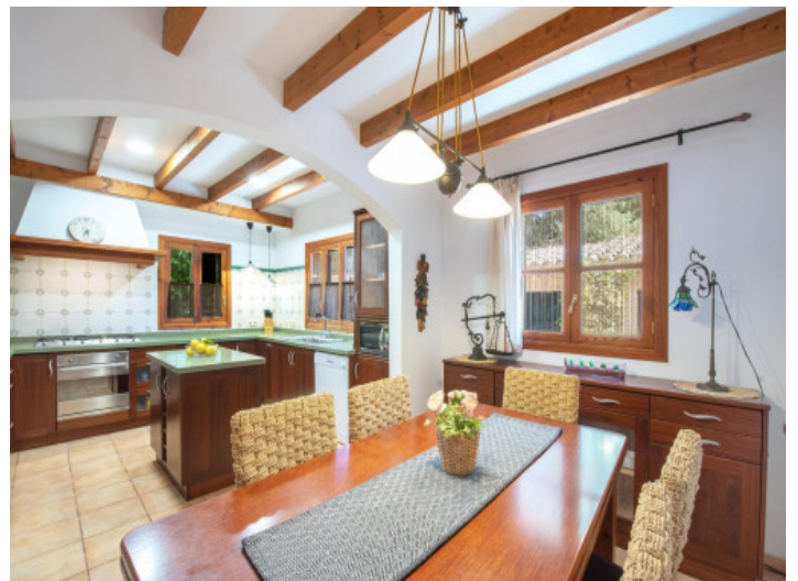
Küche im Landhausstil

Alle Angaben nach bestem Wissen. Irrtum und Zwischenverkauf vorbehalten. Dieses Exposé ist eine Vorinformation, als Rechtsgrundlage gilt allein der notariell abgeschlossene Kaufvertrag.