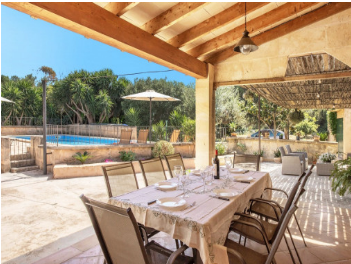
Überdachte Terrasse am Pool