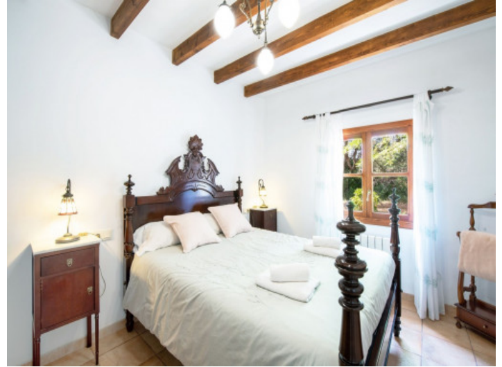
Eines von 6 Schlafzimmern