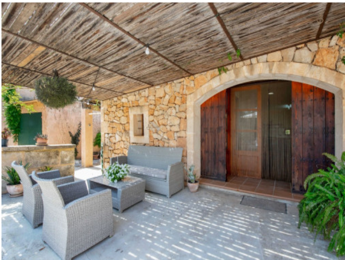
Typisch mallorquinische Finca