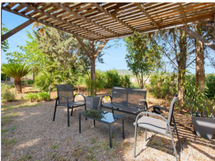
Schattige Sitzcke im Garten