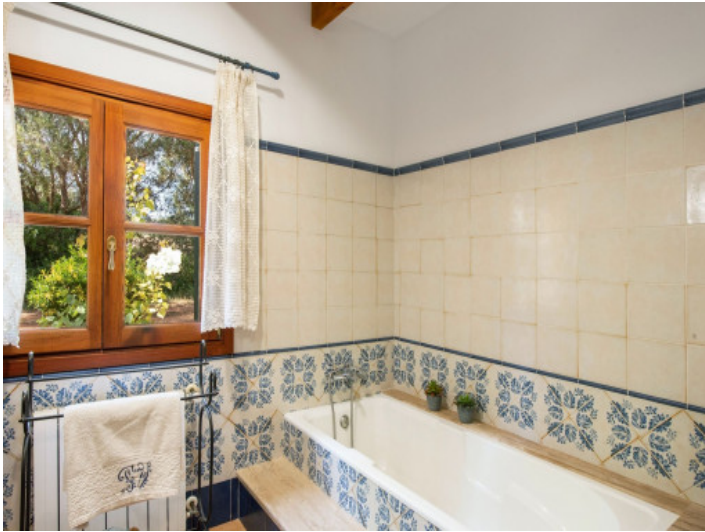
Eines von 3 Badezimmer