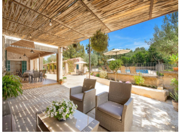
Gemütliche überdachte Terrasse