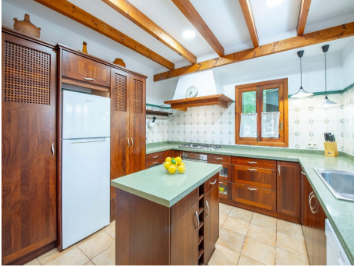
Küche im Haupthaus