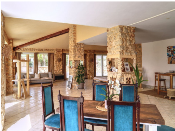
Wohn und Essbereich