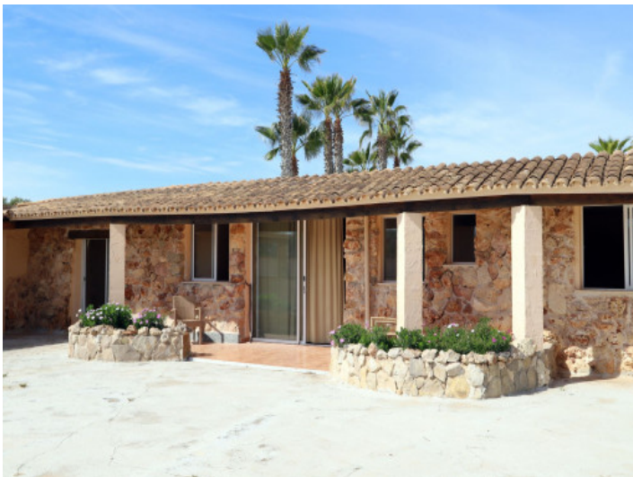
Anbau mit vielen Möglichkeiten