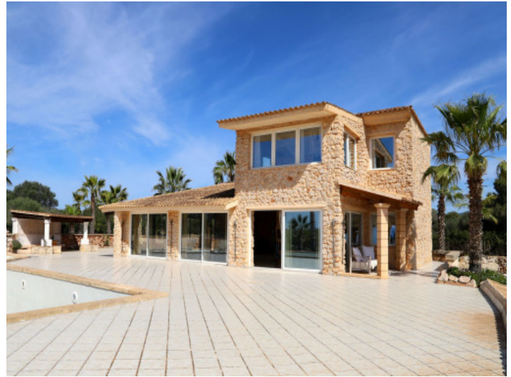
Ansicht auf die Finca