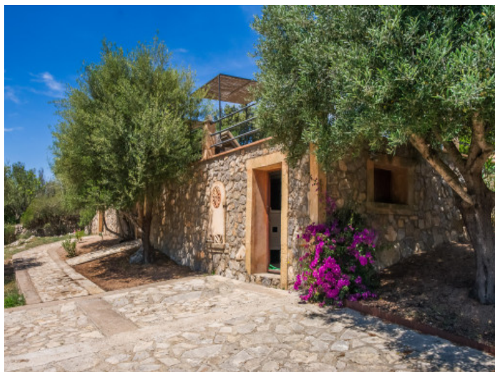
Maschinenraum unter dem Pool