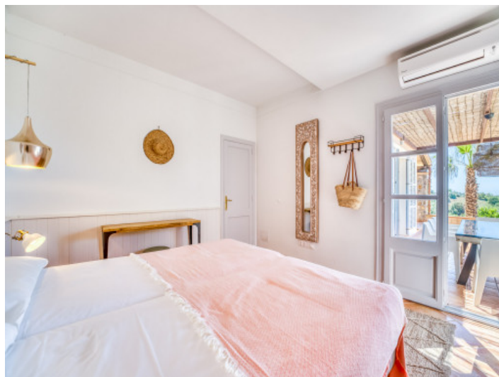
2. Schlafzimmer Erdgeschoß