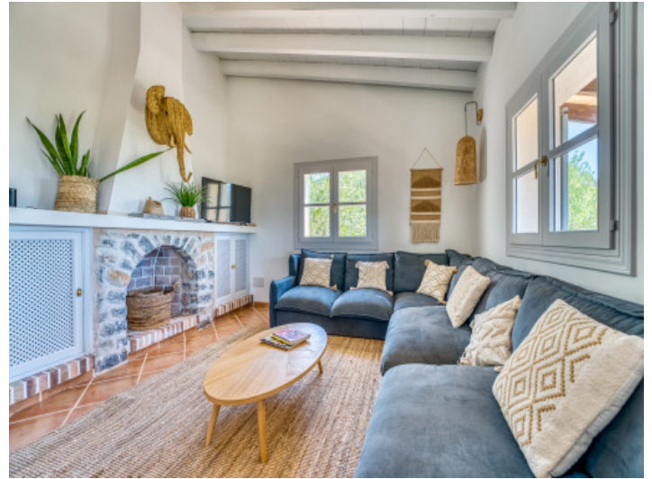
Gemütlicher Wohnbereich mit Kamin