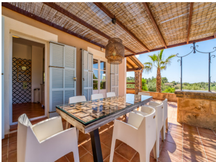
Essbereich auf der Terrasse