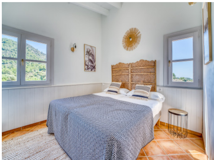
4. Schlafzimmer im 1. Stock