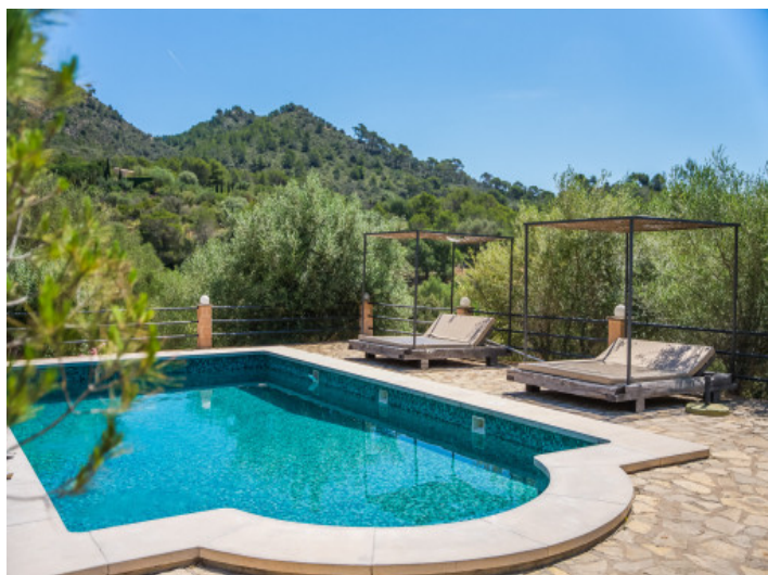
Poolbereich eingebettet in die Natur