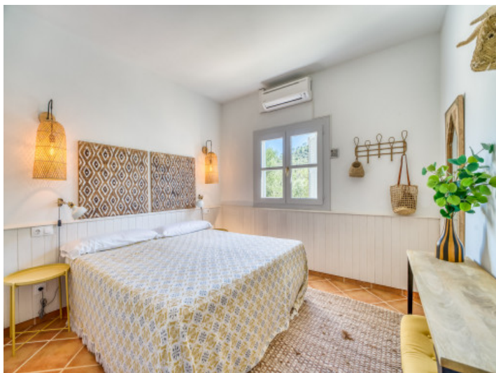
1. Schlafzimmer Erdgeschoß