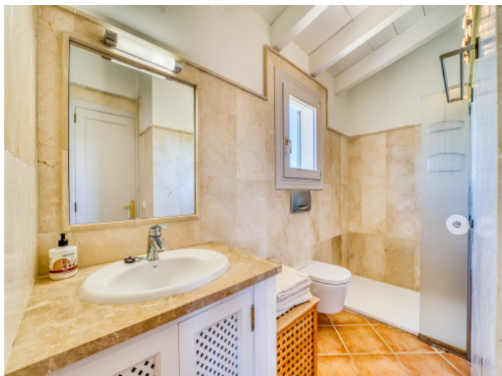
2. Badezimmer im 1. Stock