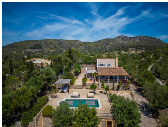
Ansicht auf die Finca

Alle Angaben nach bestem Wissen. Irrtum und Zwischenverkauf vorbehalten. Dieses Exposé ist eine Vorinformation, als Rechtsgrundlage gilt allein der notariell abgeschlossene Kaufvertrag.