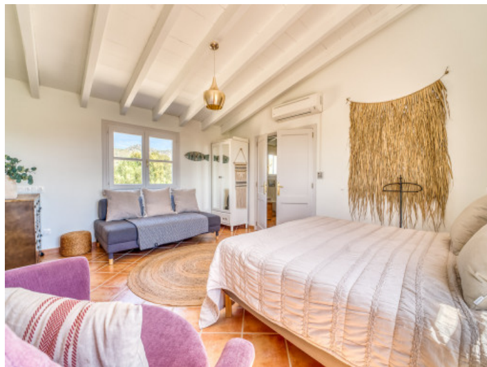
3. Schlafzimmer im 1. Stock

Alle Angaben nach bestem Wissen. Irrtum und Zwischenverkauf vorbehalten. Dieses Exposé ist eine Vorinformation, als Rechtsgrundlage gilt allein der notariell abgeschlossene Kaufvertrag.