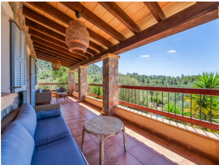
Terrasse vor dem Wohnzimmer