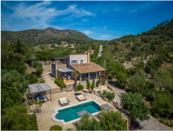
Blick nach Südwesten