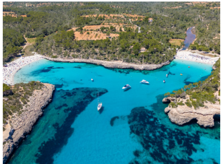
Cala Mondrago und Cala S'Almunia