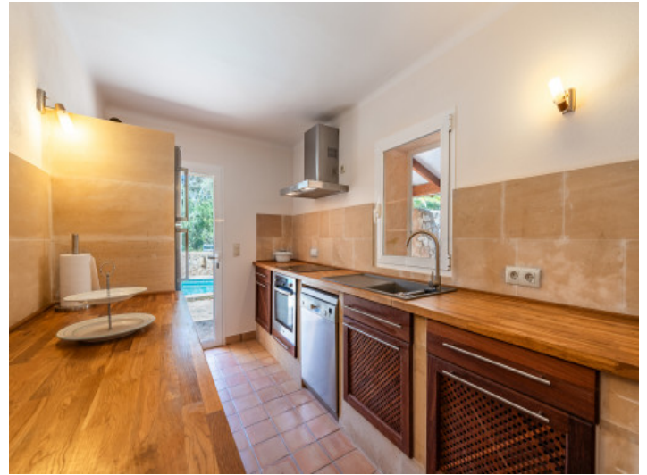
Küche mit Ausgang zum Poolbereich