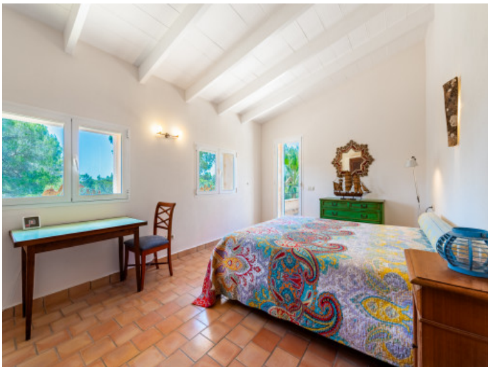
Schlafzimmer mit privater Terrasse