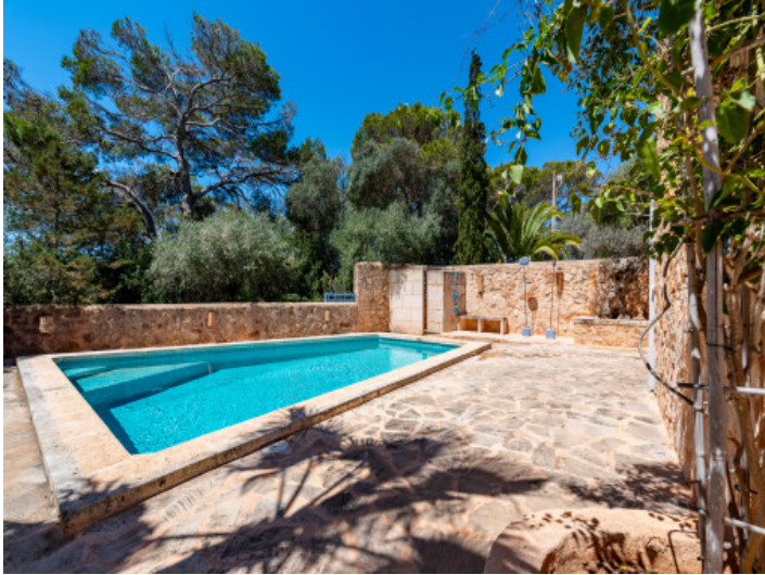
Sehr schöner Poolbereich