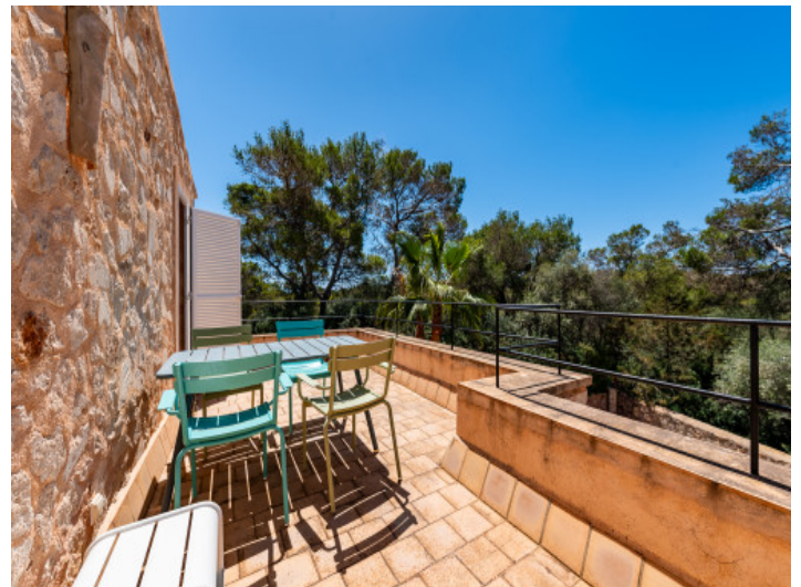
Terrasse vom Schlafzimmer