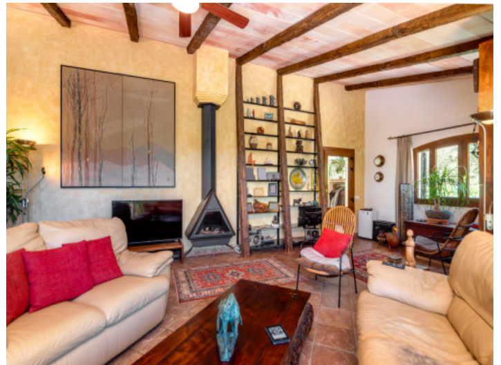
Wohnbereich mit Kamin

Alle Angaben nach bestem Wissen. Irrtum und Zwischenverkauf vorbehalten. Dieses Exposé ist eine Vorinformation, als Rechtsgrundlage gilt allein der notariell abgeschlossene Kaufvertrag.