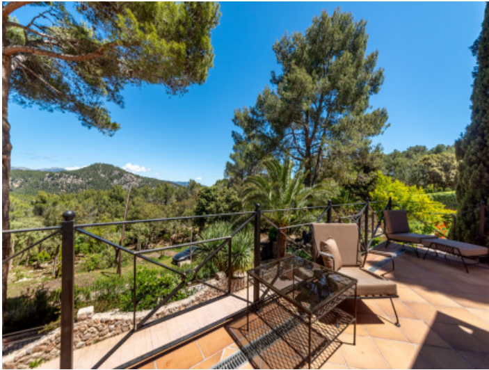
Traumblick auf die Natur