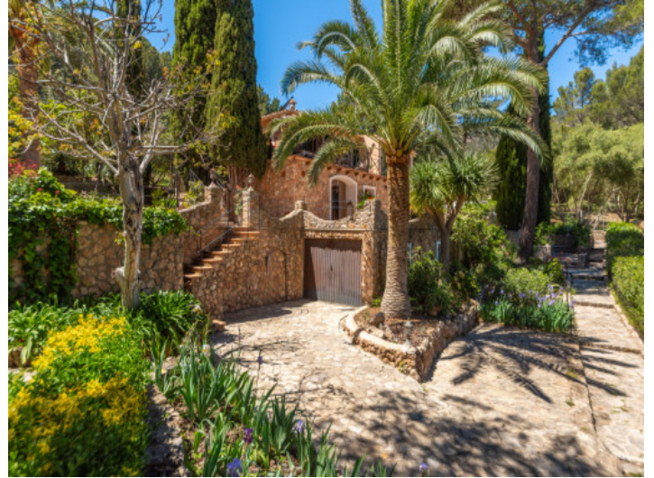
Gewachsener mediterraner Garten