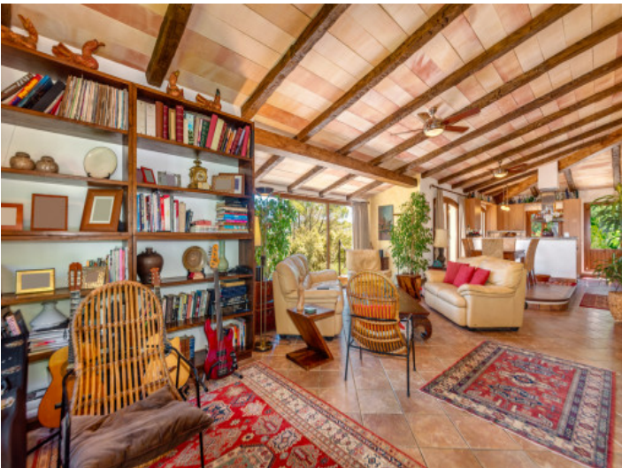
Wohn und Essbereich