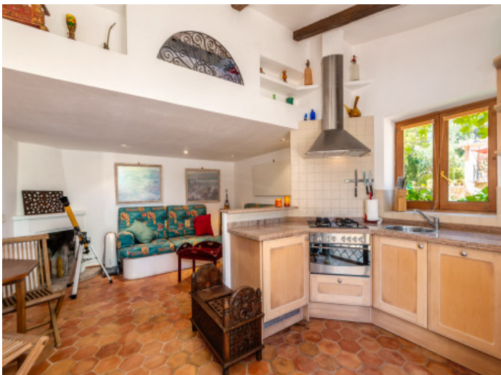
Küche im Gästehaus