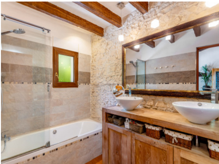
Eines von 4 Badezimmern