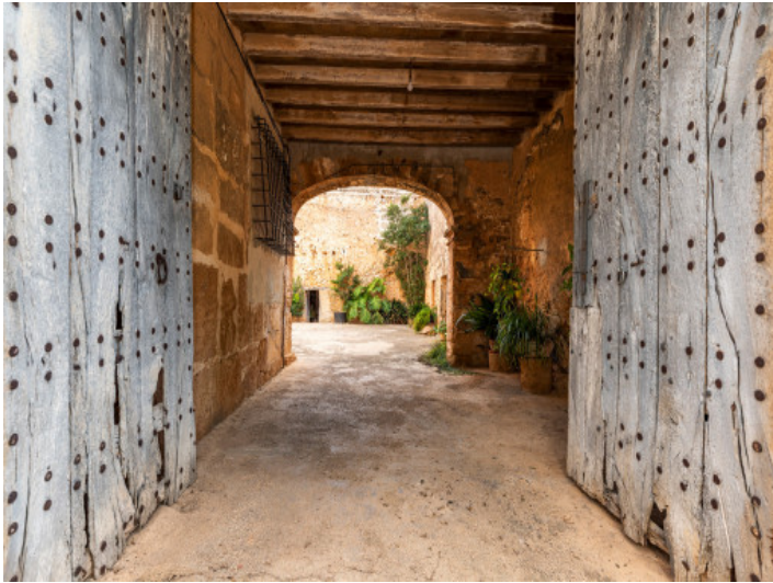
Zugangstor zum Innenhof