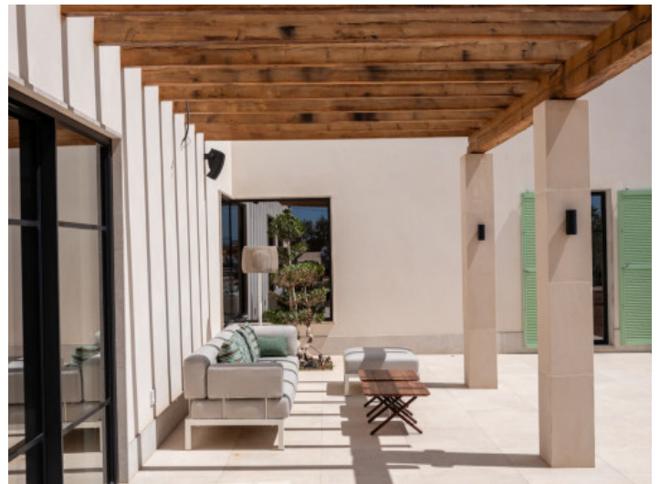
Elegante und hochwertige Finca