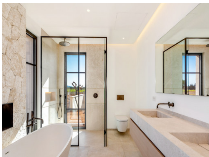
Bad en Suite