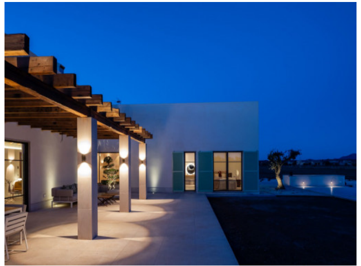
Terrasse und Gartenbereich