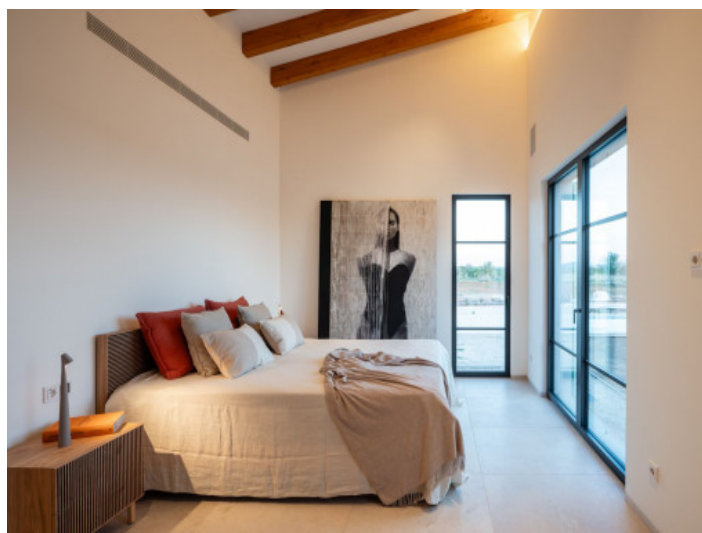
Eines von 3 komfortablen Schlafzimmern