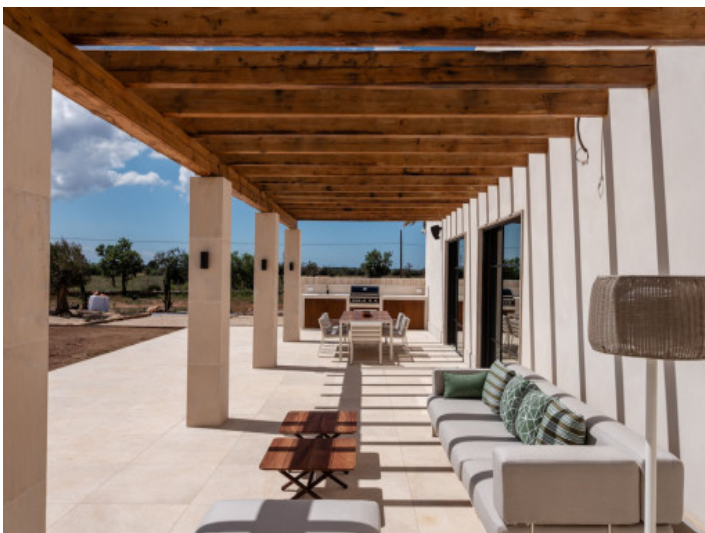
Veranda mit BBQ