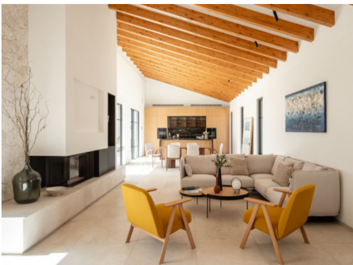
Heller Wohn und Essbereich mit Kamin