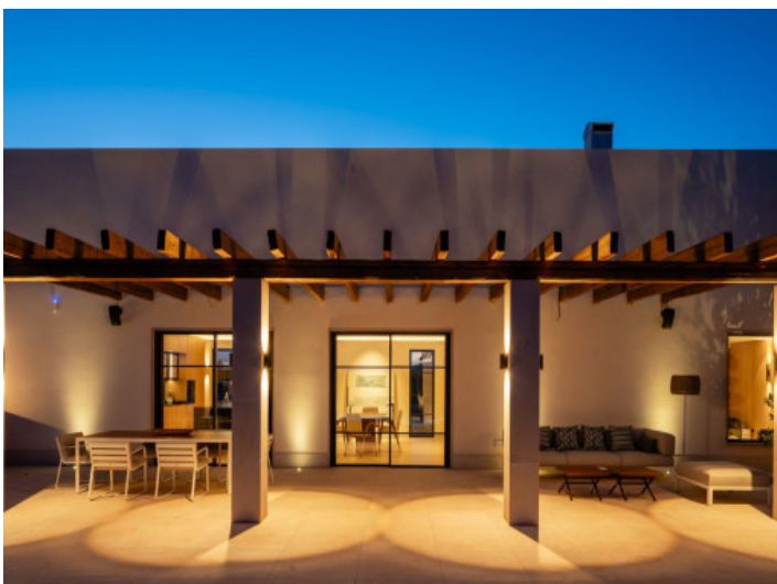
Ansicht auf die Finca

Alle Angaben nach bestem Wissen. Irrtum und Zwischenverkauf vorbehalten. Dieses Exposé ist eine Vorinformation, als Rechtsgrundlage gilt allein der notariell abgeschlossene Kaufvertrag.