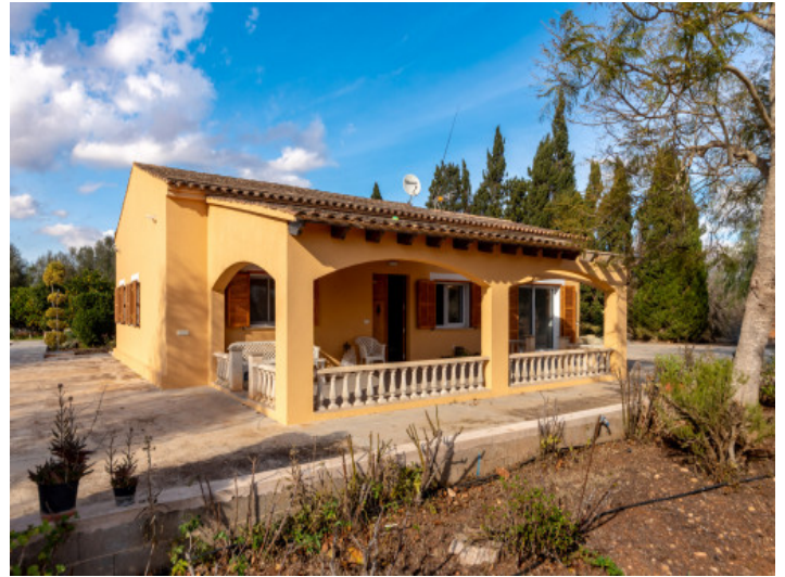
Fincansicht mit großer Terrasse