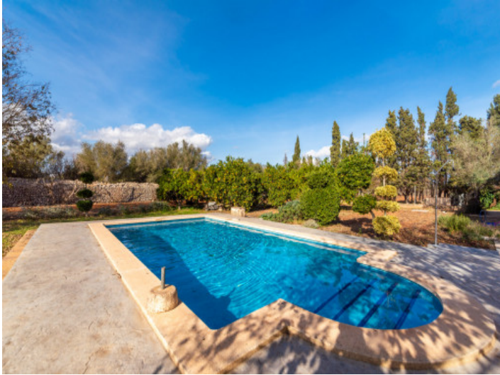
Pool und Obstgarten