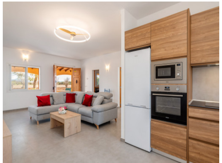
Offener, heller Wohn- Küchenbereich