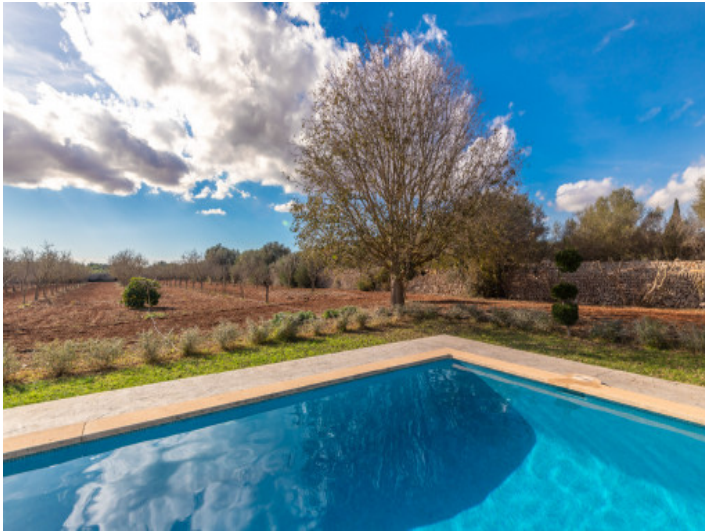
Blick in den Garten vom Pool