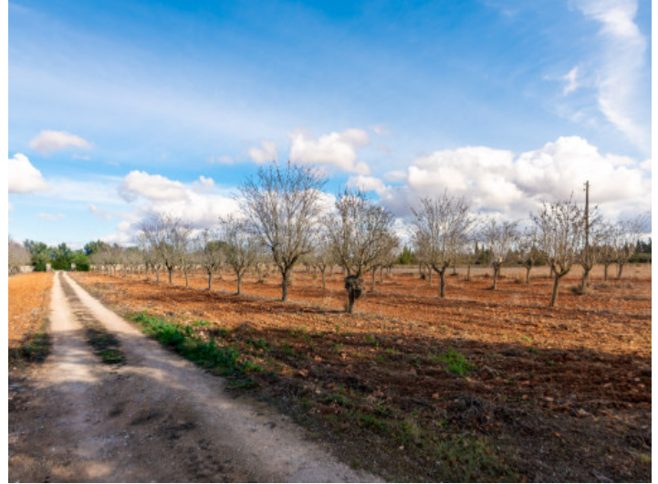
Zufahrt zur Finca