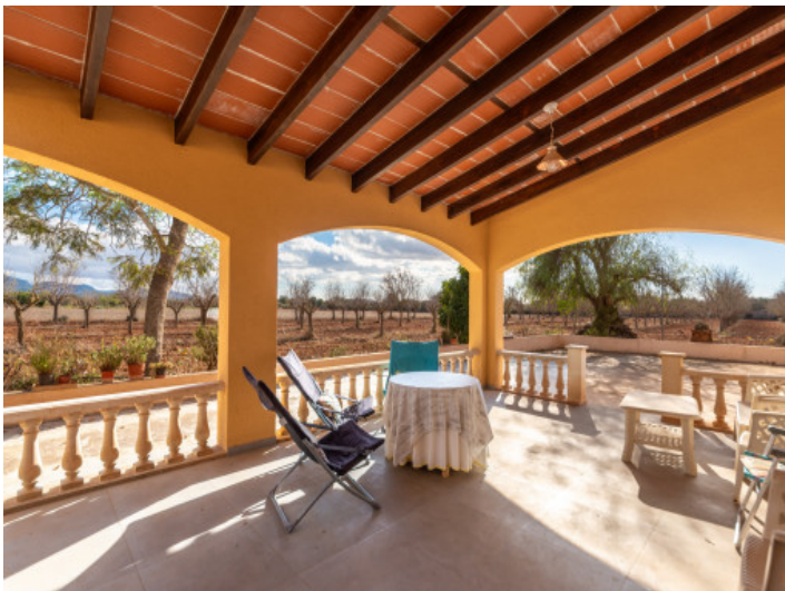
Große, überdachte Veranda