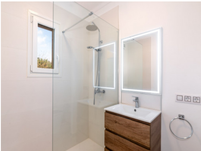
Badezimmer mit Tageslicht