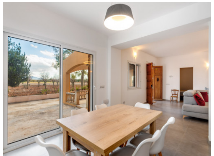
Essbereich mit Terrassenzugang

Alle Angaben nach bestem Wissen. Irrtum und Zwischenverkauf vorbehalten. Dieses Exposé ist eine Vorinformation, als Rechtsgrundlage gilt allein der notariell abgeschlossene Kaufvertrag.