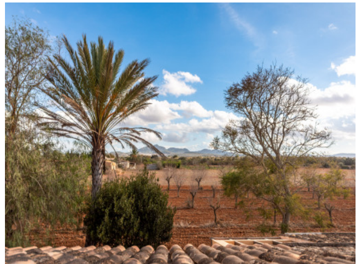
Herrlicher Blick über die Landschaft