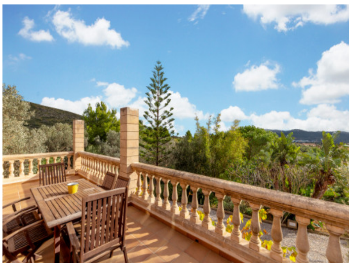
Einmaliger Landschaftsblick vom Balkon aus