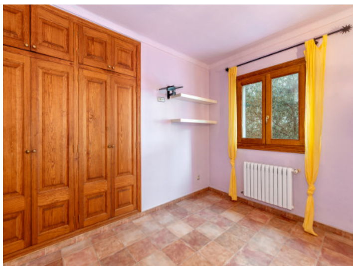
Schlafzimmer mit Einbaukleiderschrank