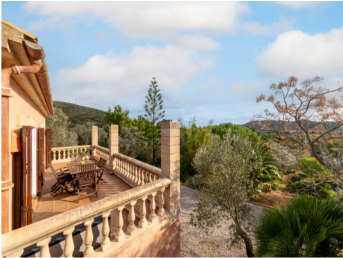
Blick über den Garten