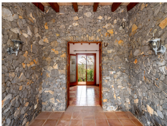
Eingangsbereich der Finca

Alle Angaben nach bestem Wissen. Irrtum und Zwischenverkauf vorbehalten. Dieses Exposé ist eine Vorinformation, als Rechtsgrundlage gilt allein der notariell abgeschlossene Kaufvertrag.