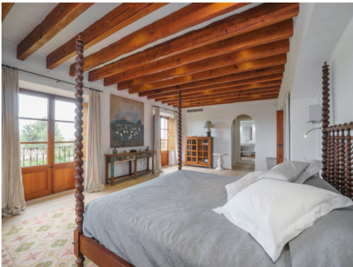
Zweites Schlafzimmer mit Badezimmer en Suite