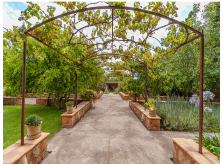
Ansicht des Gartens