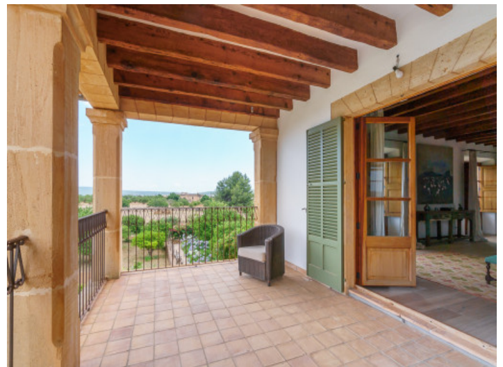
Balkon des Schlafzimmers

Alle Angaben nach bestem Wissen. Irrtum und Zwischenverkauf vorbehalten. Dieses Exposé ist eine Vorinformation, als Rechtsgrundlage gilt allein der notariell abgeschlossene Kaufvertrag.