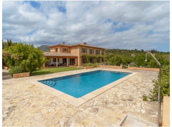
Großer, privater Poolbereich