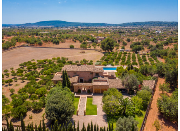
Ansicht aus der Vogelperspektive