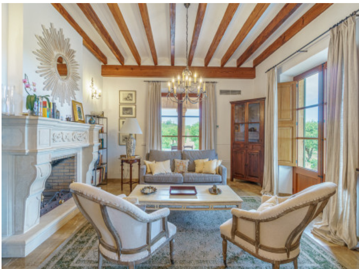
Gemütlicher Wohnbereich mit Kamin