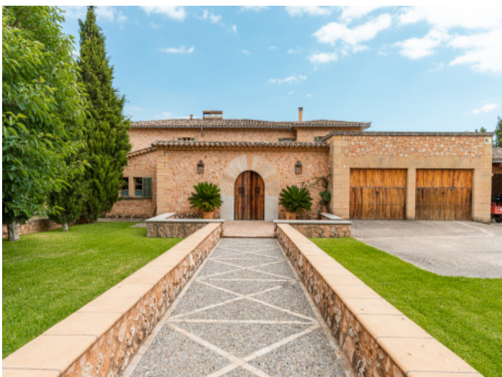
Außenansicht der Finca