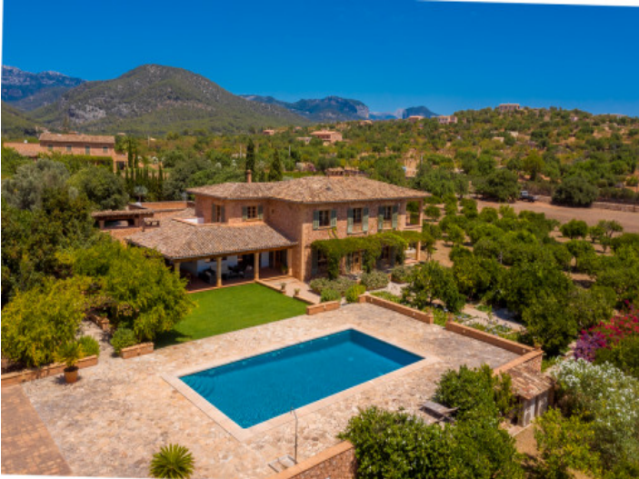
Ansicht aus der Vogelperspektive