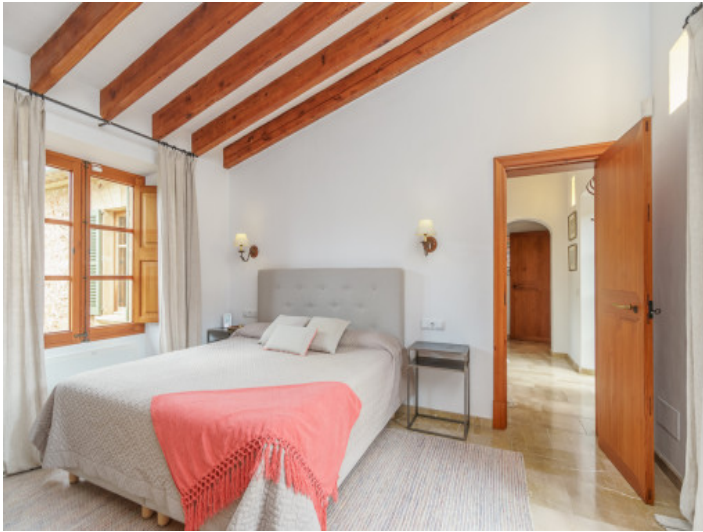
Hauptschlafzimmer mit Badezimmer en Suite