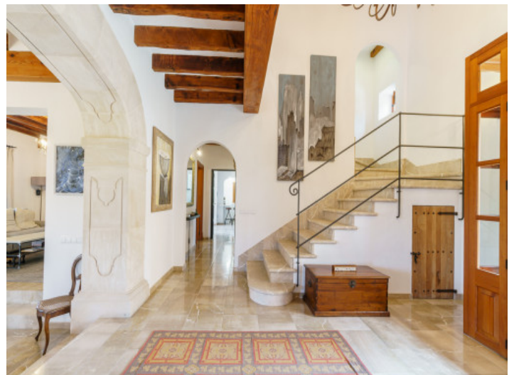
Eingangsbereich der Finca

Alle Angaben nach bestem Wissen. Irrtum und Zwischenverkauf vorbehalten. Dieses Exposé ist eine Vorinformation, als Rechtsgrundlage gilt allein der notariell abgeschlossene Kaufvertrag.