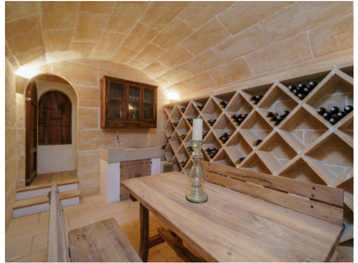
Weinkeller mit Gewölbedecke