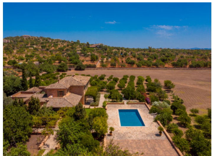
Ansicht aus der Vogelperspektive

Alle Angaben nach bestem Wissen. Irrtum und Zwischenverkauf vorbehalten. Dieses Exposé ist eine Vorinformation, als Rechtsgrundlage gilt allein der notariell abgeschlossene Kaufvertrag.