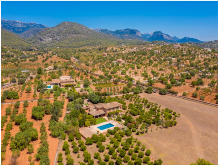
Ansicht aus der Vogelperspektive