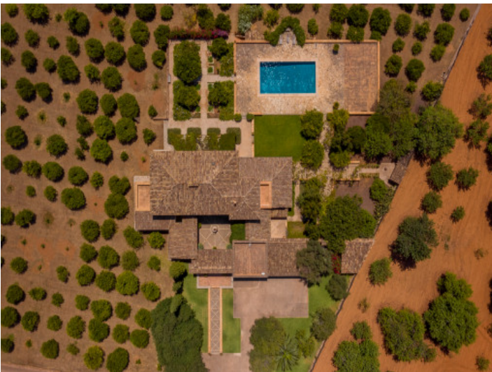
Ansicht aus der Vogelperspektive