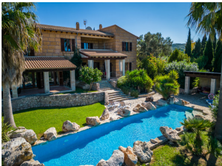
Mediterraner Garten mit Pool