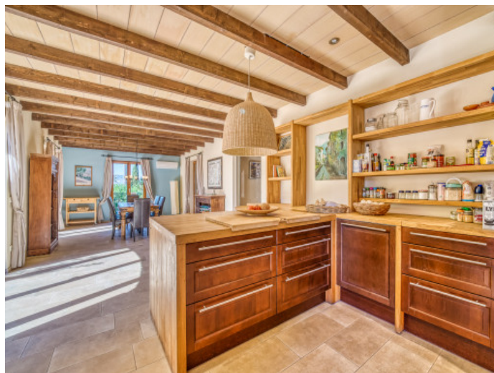
Offene Küche und Essbereich