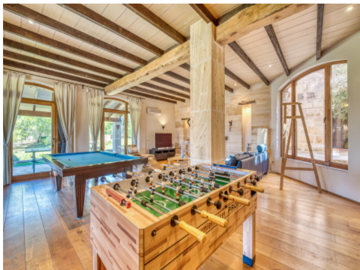
Wohnbereich mit Kicker und Billardtisch