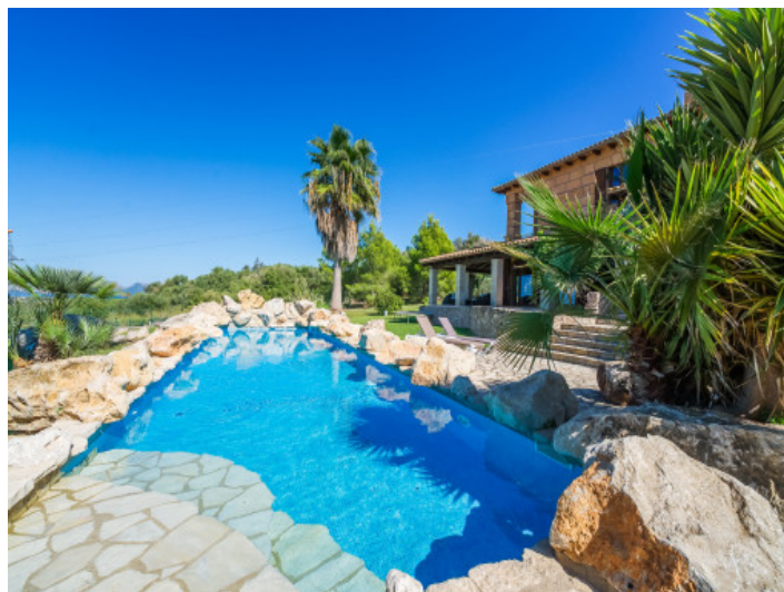
Mediterrane Finca mit Swimmingpool und Tennisplatz in Alcudia