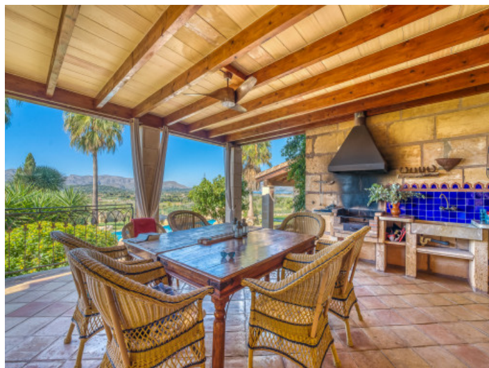
Überdachte Terrasse mit Sommerküche