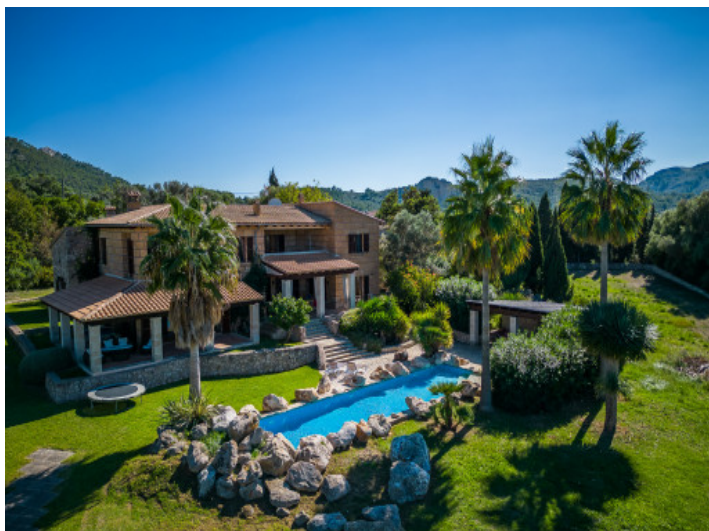
Blick auf die Finca