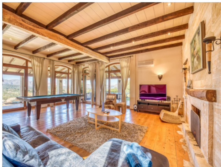
Wohnbereich mit bodentiefen Fenstern