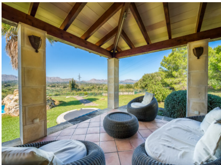
Überdachte Terrasse mit Loungebereich