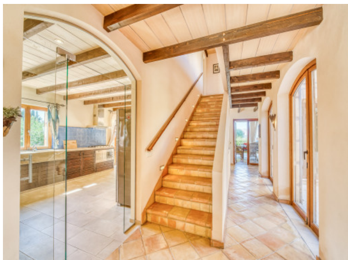
Flur der Finca