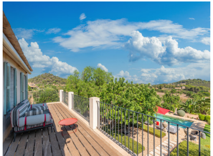
Balkon mit Poolblick