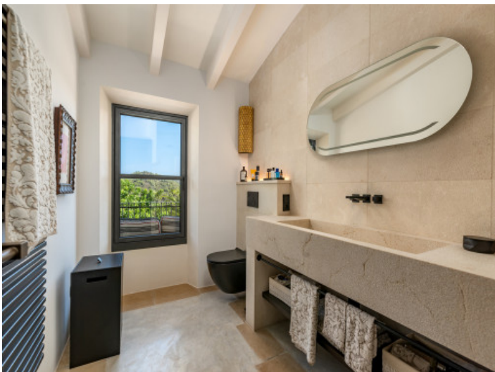
Badezimmer mit Blick in den Garten