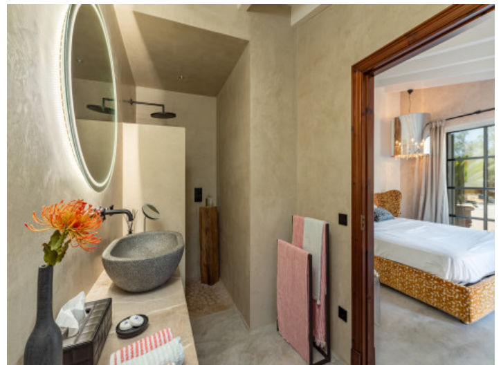
En Suite Badezimmer

Alle Angaben nach bestem Wissen. Irrtum und Zwischenverkauf vorbehalten. Dieses Exposé ist eine Vorinformation, als Rechtsgrundlage gilt allein der notariell abgeschlossene Kaufvertrag.