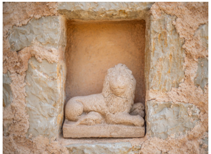
Hausfassade mit Details

Alle Angaben nach bestem Wissen. Irrtum und Zwischenverkauf vorbehalten. Dieses Exposé ist eine Vorinformation, als Rechtsgrundlage gilt allein der notariell abgeschlossene Kaufvertrag.