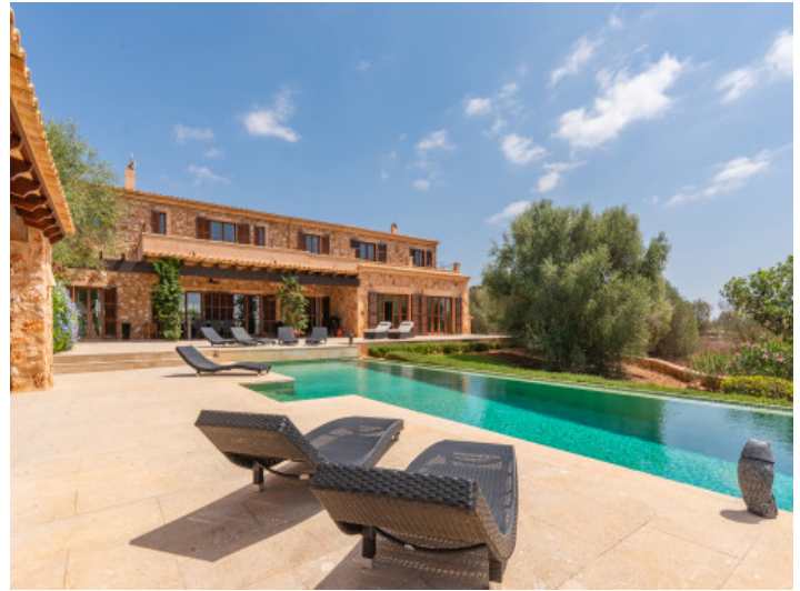
Außenansicht und Pool