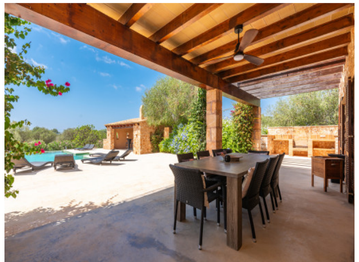
Überdachter Essbereich im Freien

Alle Angaben nach bestem Wissen. Irrtum und Zwischenverkauf vorbehalten. Dieses Exposé ist eine Vorinformation, als Rechtsgrundlage gilt allein der notariell abgeschlossene Kaufvertrag.