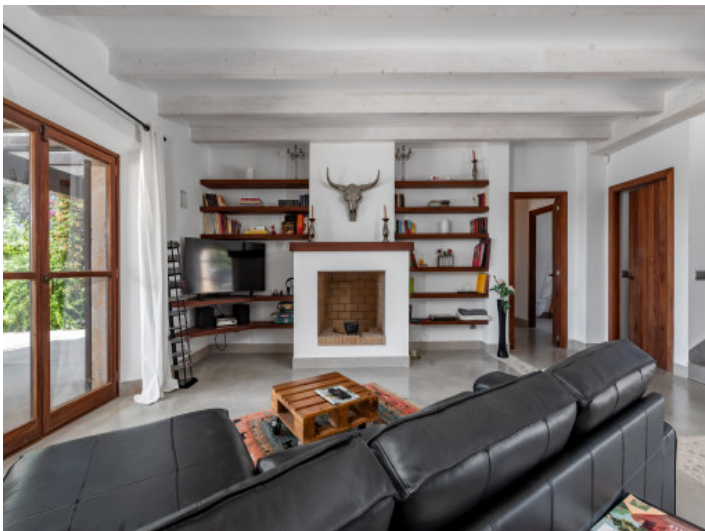
Wohnbereich mit Terrassenzugang