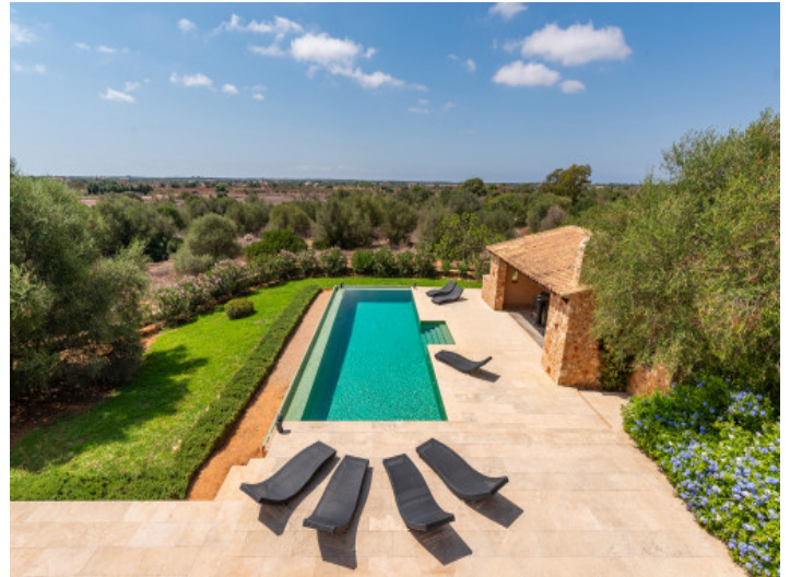
Blick über die Landschaft