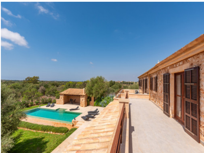
Obere Terrasse mit Weitblick