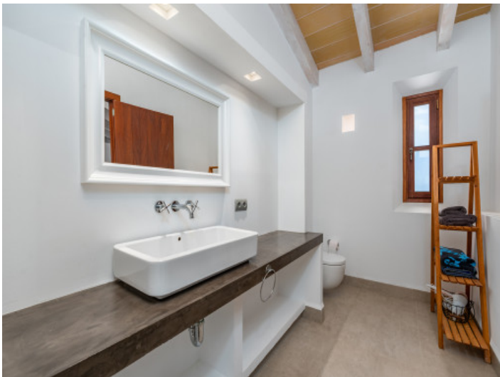
Eines von 5 Badezimmern