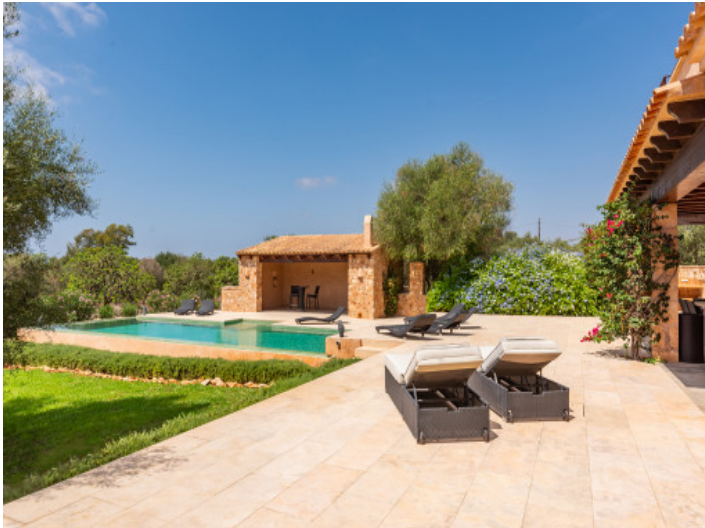
Sehr gepflegter Poolbereich