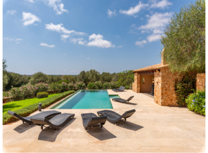
Von Natur umgebener Poolbereich