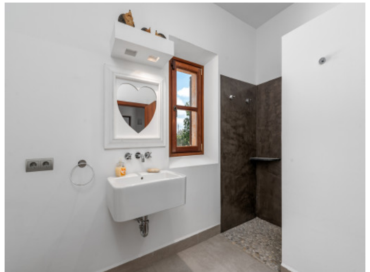
Eines von 5 Badezimmern