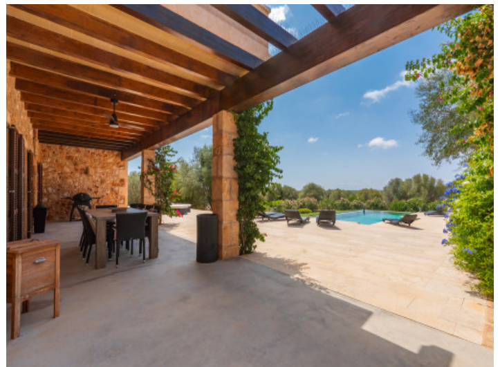
Weitläufige überdachte Terrasse

Alle Angaben nach bestem Wissen. Irrtum und Zwischenverkauf vorbehalten. Dieses Exposé ist eine Vorinformation, als Rechtsgrundlage gilt allein der notariell abgeschlossene Kaufvertrag.