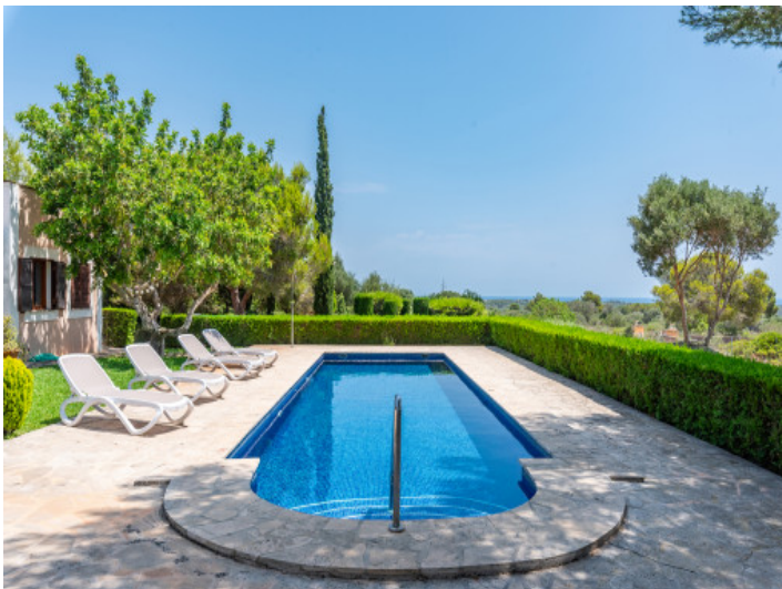
Der Poolbereich ist umgeben mit einer Natursteinterrasse