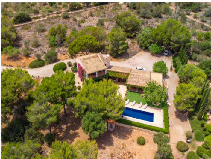
Die Finca aus der Vogelperspektive