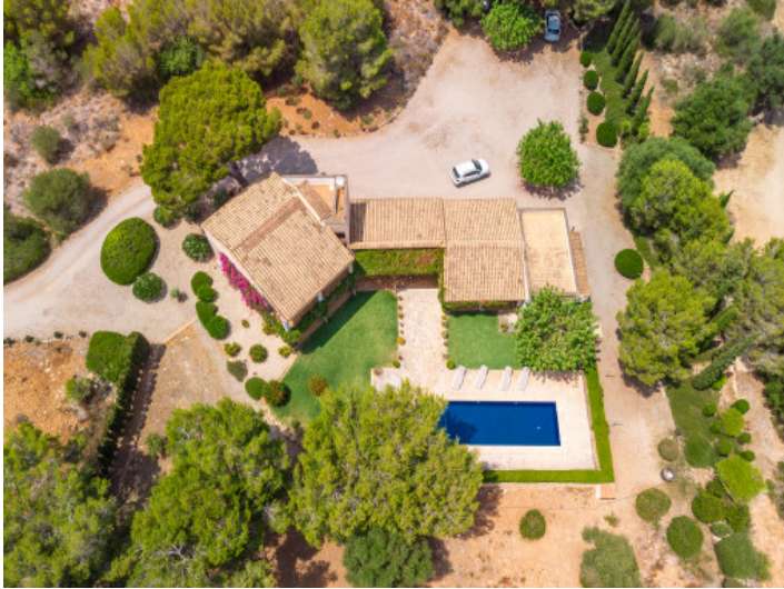
Die Finca aus der Vogelperspektive