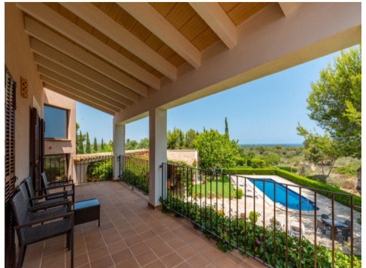
Meerblick vom Balkon

Alle Angaben nach bestem Wissen. Irrtum und Zwischenverkauf vorbehalten. Dieses Exposé ist eine Vorinformation, als Rechtsgrundlage gilt allein der notariell abgeschlossene Kaufvertrag.