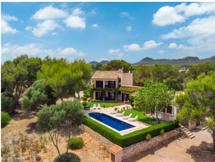
Die Finca aus der Vogelperspektive