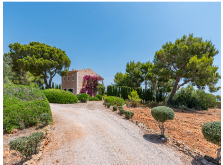
Auffahrt zur Finca