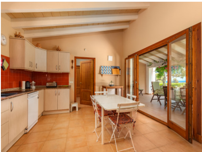
Küche mit Blick auf den Garten