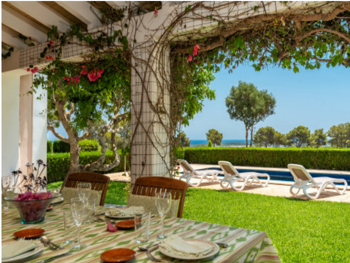
Essecke unter der schattigen Veranda