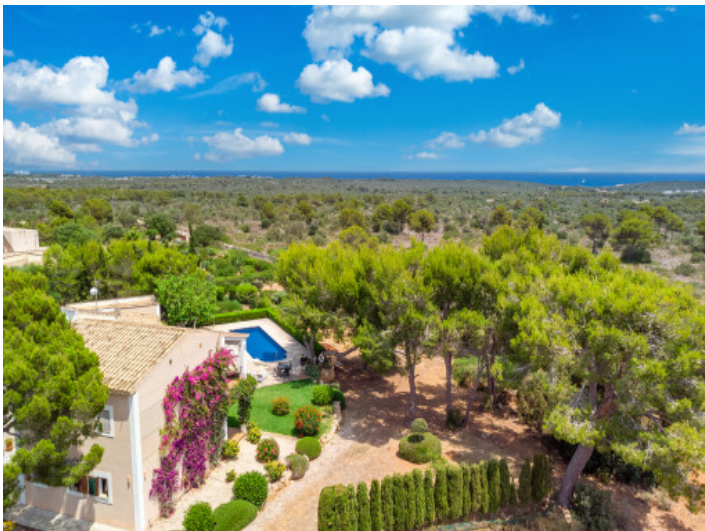
Die Finca aus der Vogelperspektive