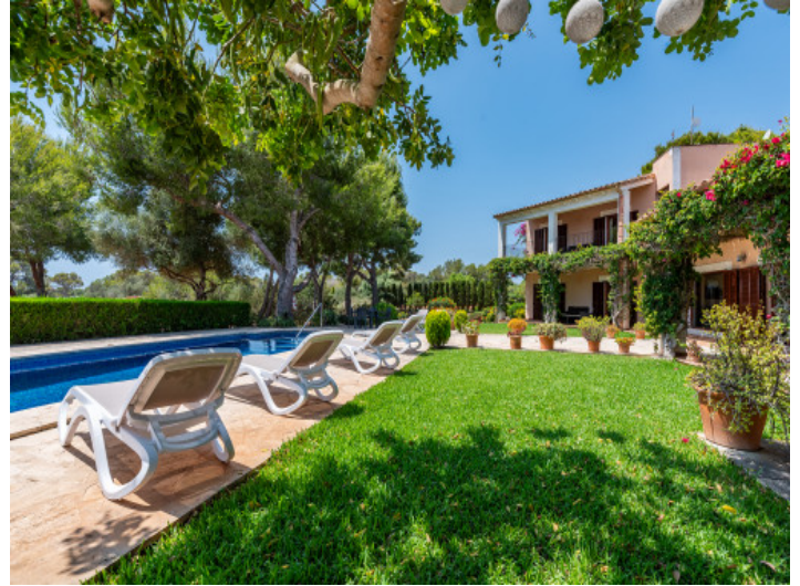
Garten und Poolbereich