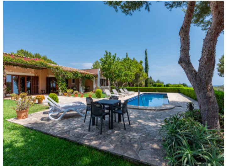
Gartenbereich und Pool