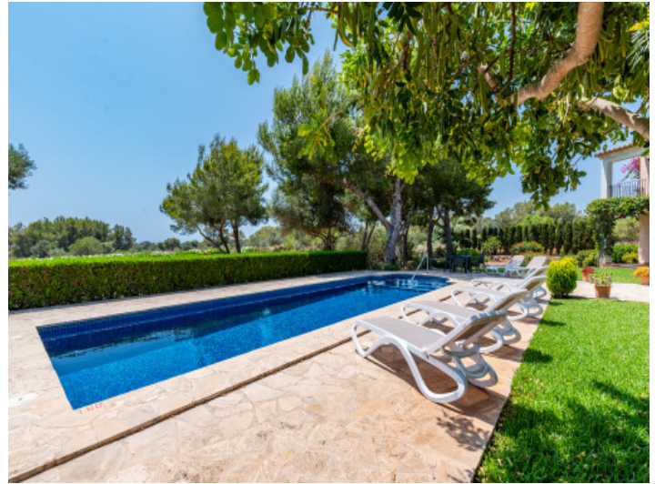
Poolbereich mit viel Platz für Sonnenliegen