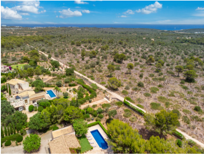
Blick zum Meer