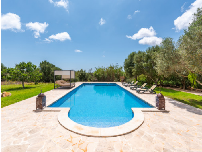
Sehr gepflegter Poolbereich