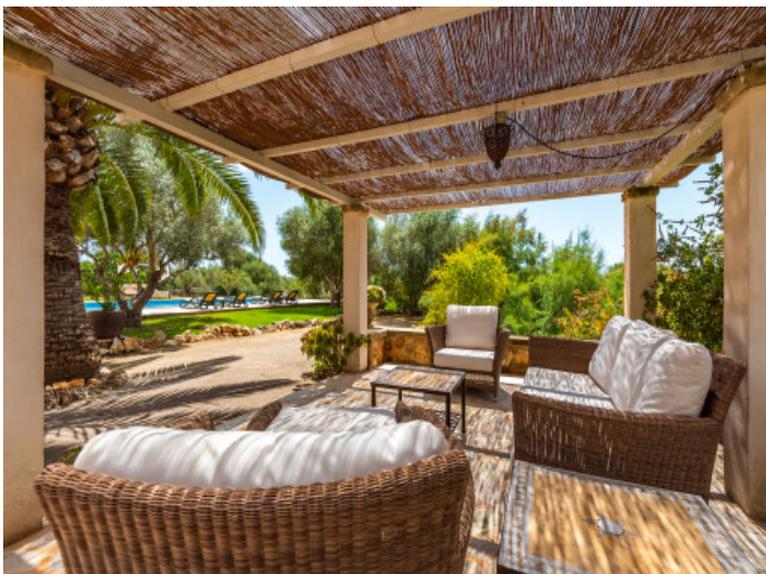
Schöne überdachte Terrasse