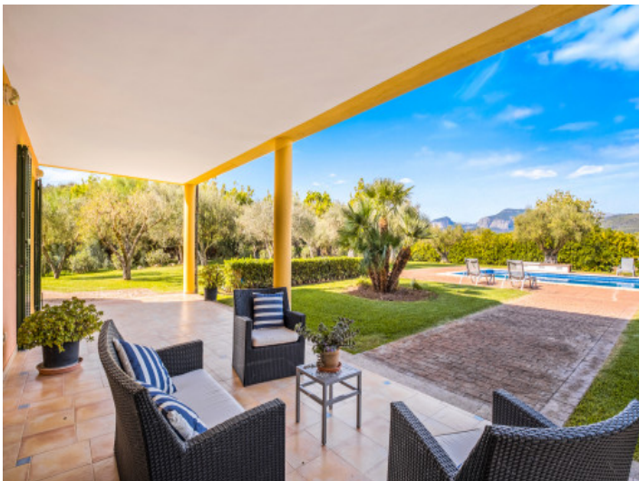
Überdachter Loungebereich auf der Terrasse