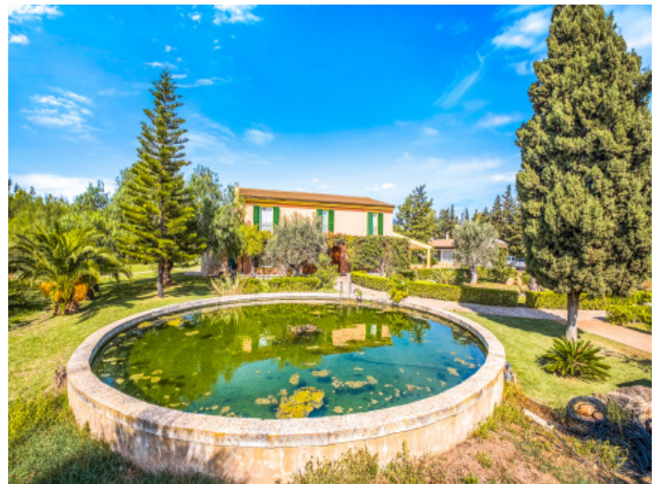
Wunderschön angelegter Garten mit Teich