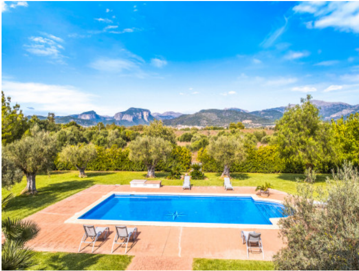
Traumhafter Panoramablick auf die Berge