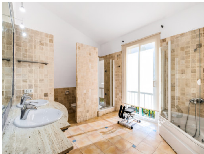
Modernes en Suite Badezimmer