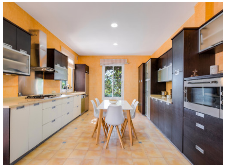
Große, moderne Küche

Alle Angaben nach bestem Wissen. Irrtum und Zwischenverkauf vorbehalten. Dieses Exposé ist eine Vorinformation, als Rechtsgrundlage gilt allein der notariell abgeschlossene Kaufvertrag.