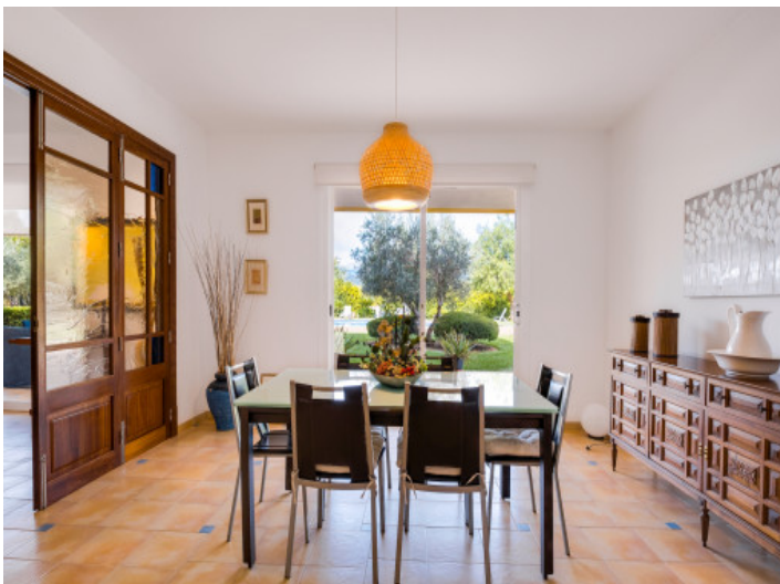
Heller Essbereich mit Terrassenzugang