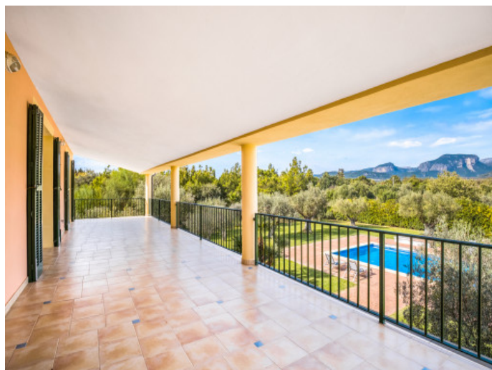
Überdachte obere Terrasse mit Bergblick

Alle Angaben nach bestem Wissen. Irrtum und Zwischenverkauf vorbehalten. Dieses Exposé ist eine Vorinformation, als Rechtsgrundlage gilt allein der notariell abgeschlossene Kaufvertrag.