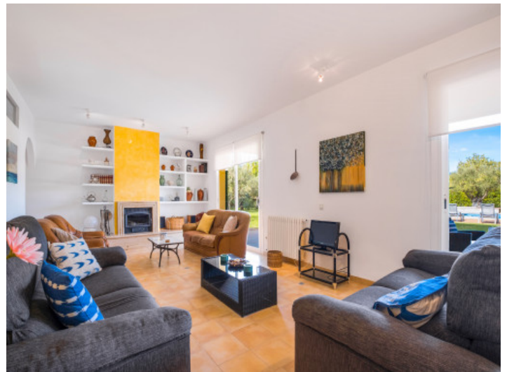
Großer, lichtdurchfluteter Wohnbereich