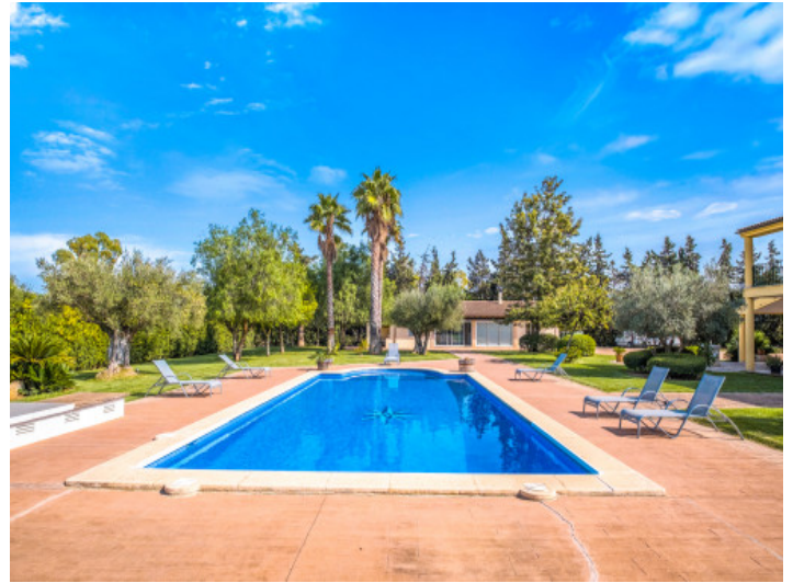
Luxuriöser, sehr privater Poolbereich