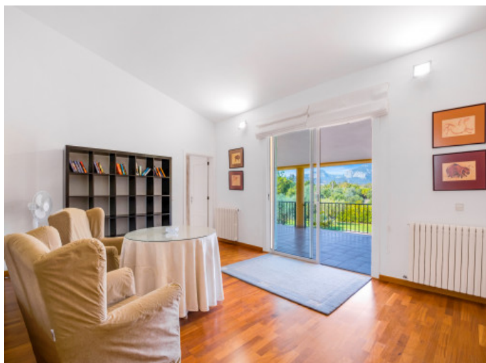
Weiteres Wohnzimmer im Obergeschoss