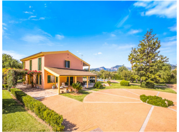
Weitläufiger Außenbereich mit Terrassen