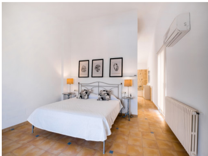
Schlafzimmer mit offener en Suite Badezimmer