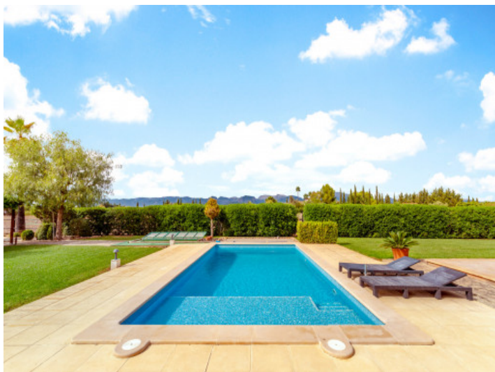
Poolbereich mit Weitblick