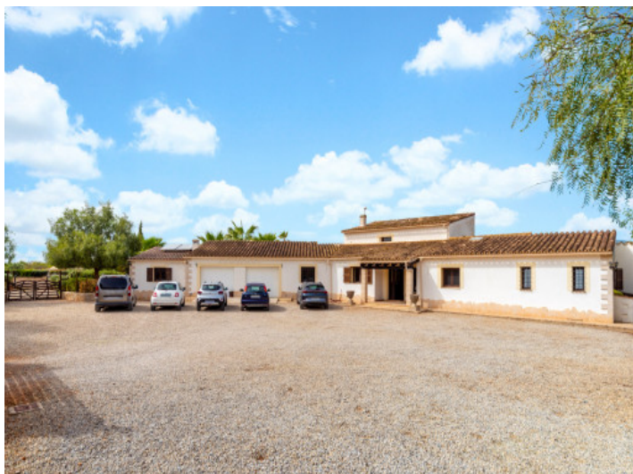
Großzügige Zufahrt zur Finca