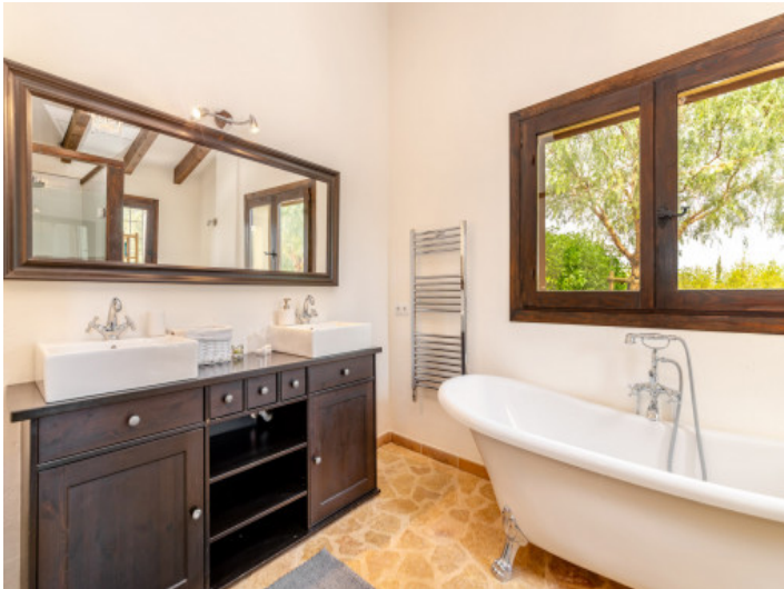
Badezimmer mit Wanne