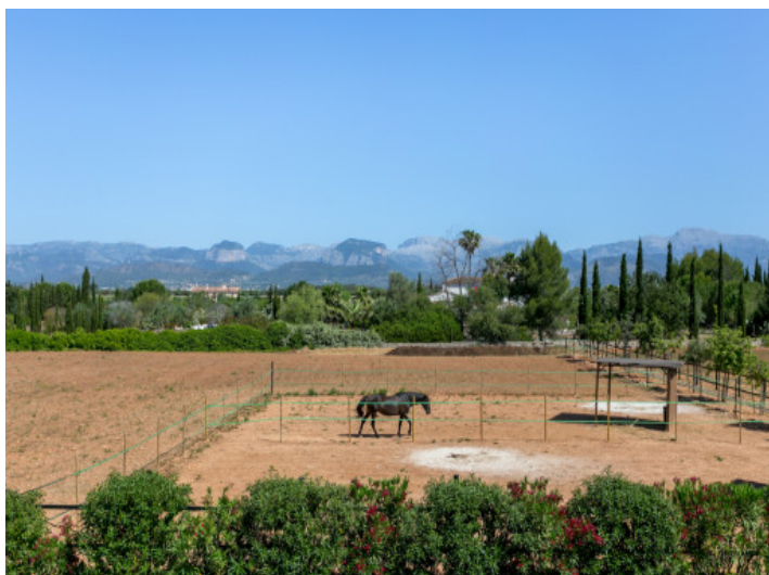
Pferdekoppel mit Bergblick