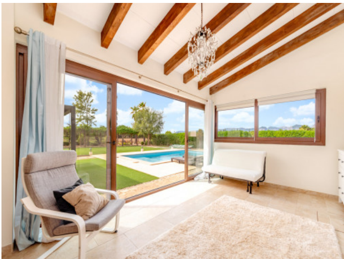
Heller Essbereich mit Panoramafenstern