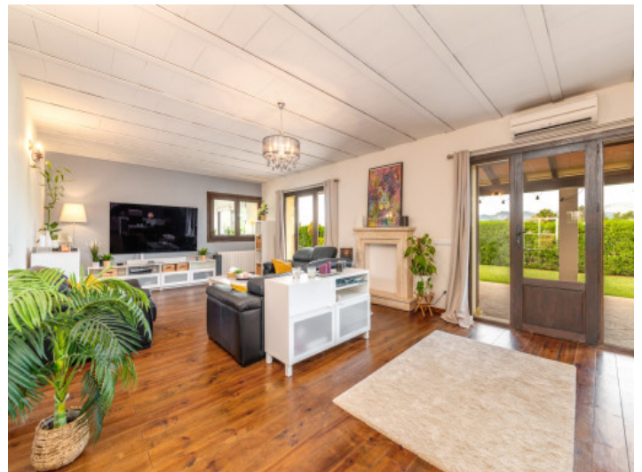
Alternative Ansicht des Wohnbereichs