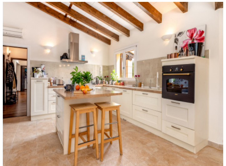
Moderne Küche mit Kochinsel

Alle Angaben nach bestem Wissen. Irrtum und Zwischenverkauf vorbehalten. Dieses Exposé ist eine Vorinformation, als Rechtsgrundlage gilt allein der notariell abgeschlossene Kaufvertrag.