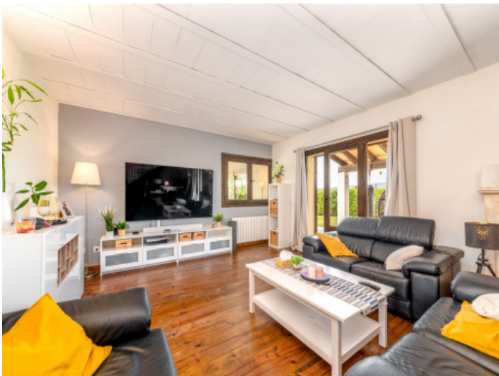
Ansicht des Wohnbereichs