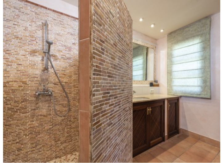
Badezimmer mit Dusche