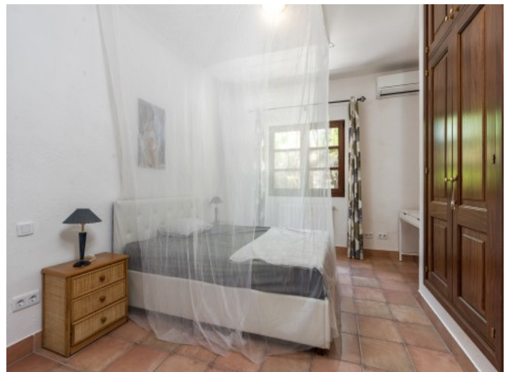
Eines von 4 Schlafzimmern

Alle Angaben nach bestem Wissen. Irrtum und Zwischenverkauf vorbehalten. Dieses Exposé ist eine Vorinformation, als Rechtsgrundlage gilt allein der notariell abgeschlossene Kaufvertrag.