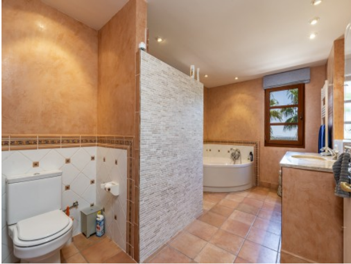
Badezimmer mit Badewanne