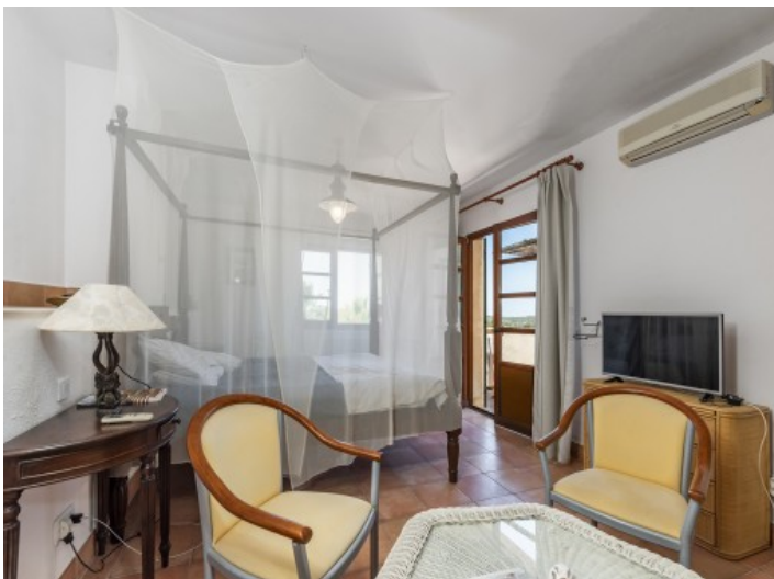
Eines von 4 Schlafzimmern