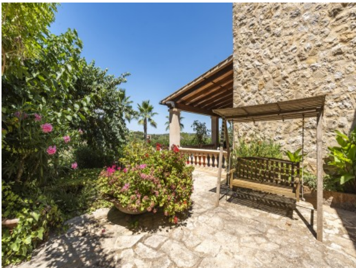
Charmante Sitzzecke im Garten