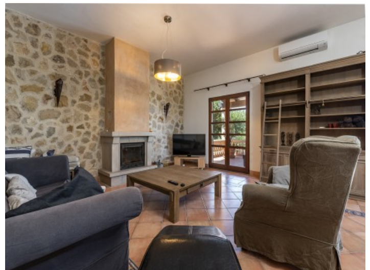
Wohnbereich mit Kamin

Alle Angaben nach bestem Wissen. Irrtum und Zwischenverkauf vorbehalten. Dieses Exposé ist eine Vorinformation, als Rechtsgrundlage gilt allein der notariell abgeschlossene Kaufvertrag.