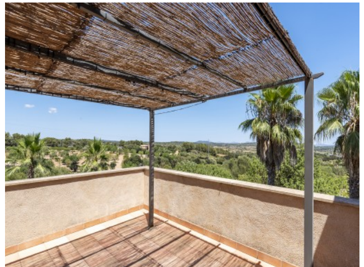
Balkon mit Weitblick