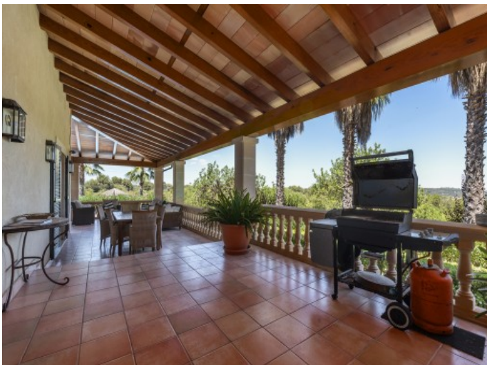
Überdachter Essbereich mit Grillecke