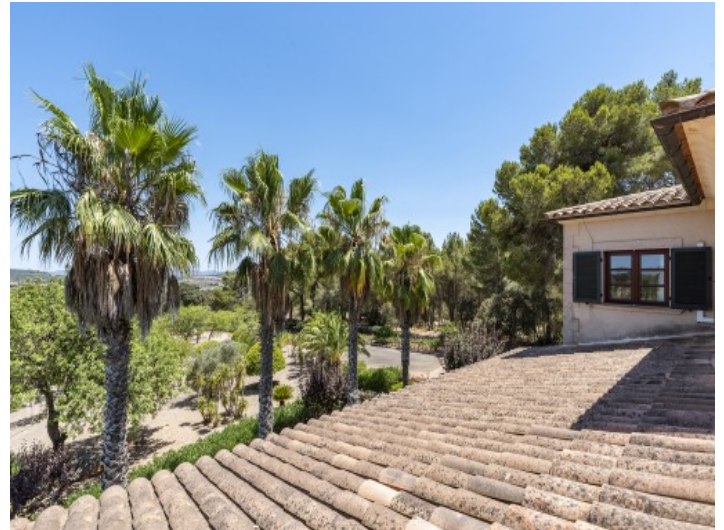
Blick vom Balkon