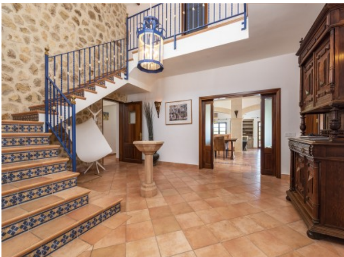
Eingangsbereich der Finca