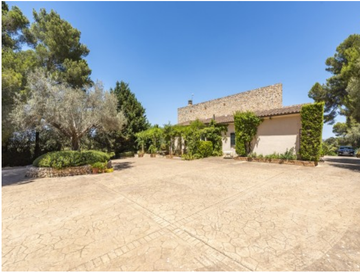
Auffahrt der Finca