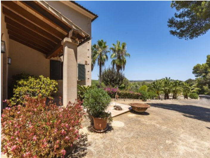
Auffahrt und Garten