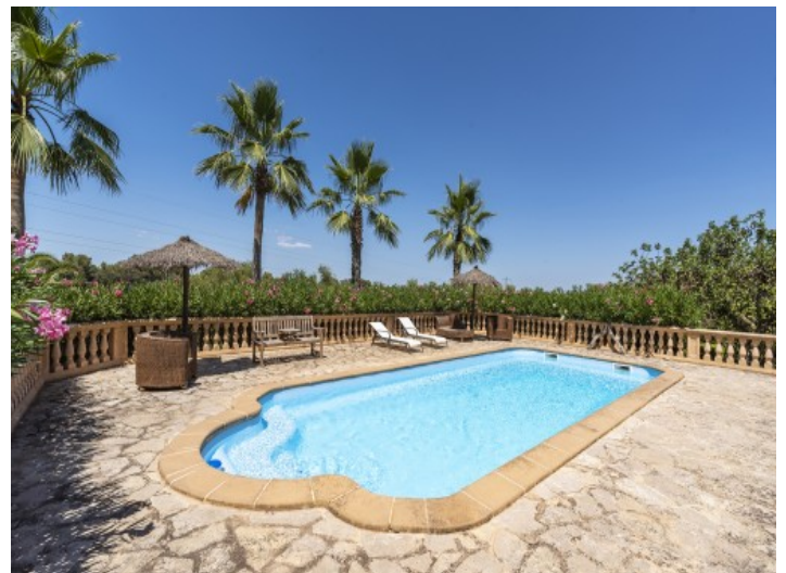
Alternative Ansicht des Pools

Alle Angaben nach bestem Wissen. Irrtum und Zwischenverkauf vorbehalten. Dieses Exposé ist eine Vorinformation, als Rechtsgrundlage gilt allein der notariell abgeschlossene Kaufvertrag.