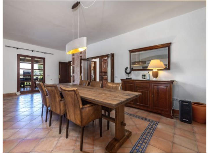
Ansicht des Essbereichs