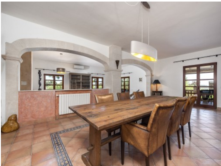
Ansicht des Essbereichs