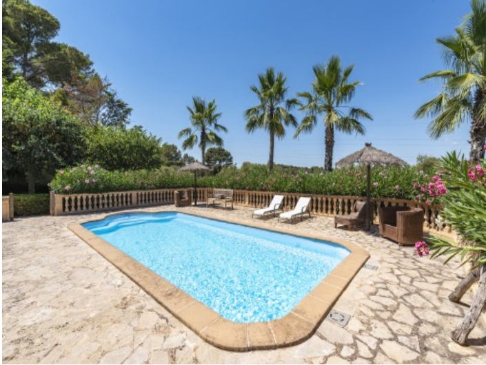
Sonniger Poolbereich der Finca