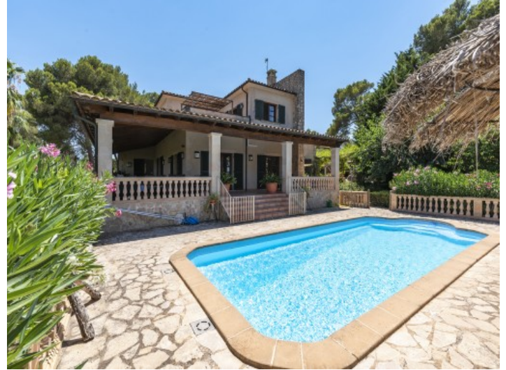
Außenansicht der Finca