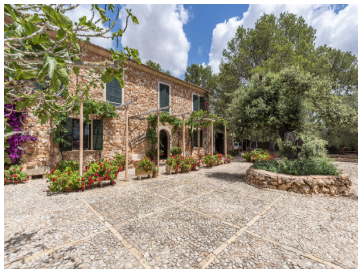
Natursteinfassade des Hauses

Alle Angaben nach bestem Wissen. Irrtum und Zwischenverkauf vorbehalten. Dieses Exposé ist eine Vorinformation, als Rechtsgrundlage gilt allein der notariell abgeschlossene Kaufvertrag.