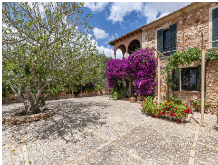
Außenansicht der Finca