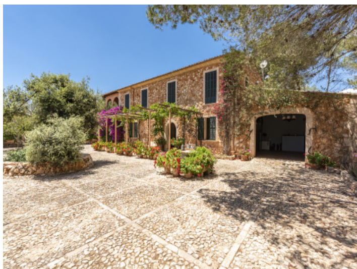
Romantische mallorquinische Finca