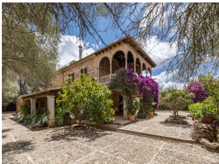
Fassade der Finca