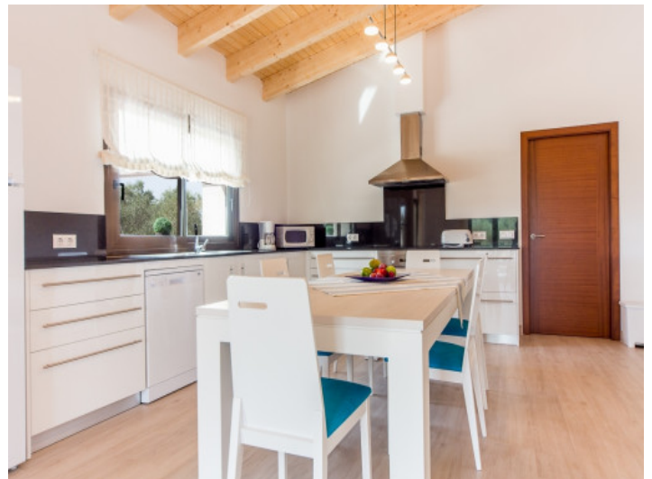
Moderne Küche mit Essbereich