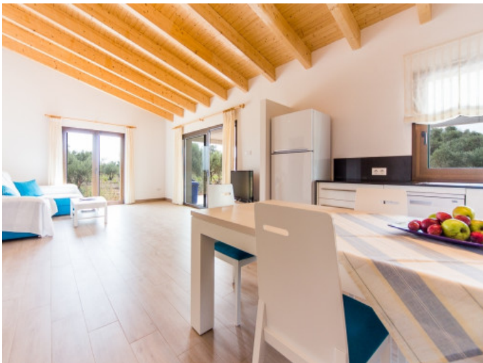
Großzügiges Wohn- und Esszimmer