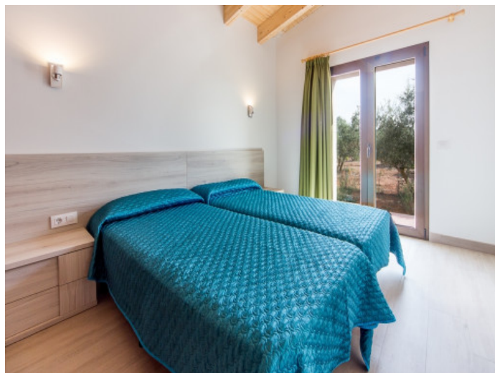
Eins von drei Doppelschlafzimmern