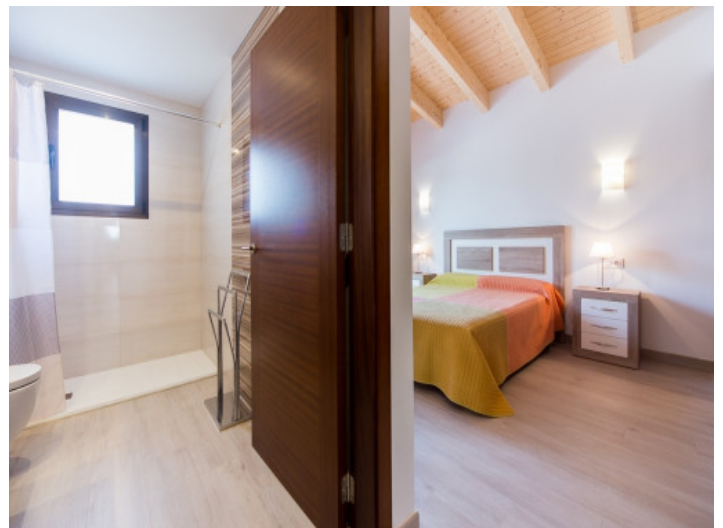
Hauptschlafzimmer mit Badezimmer en suite

Alle Angaben nach bestem Wissen. Irrtum und Zwischenverkauf vorbehalten. Dieses Exposé ist eine Vorinformation, als Rechtsgrundlage gilt allein der notariell abgeschlossene Kaufvertrag.