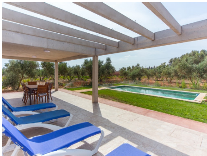
Loungebereich auf der Terrasse mit Blick auf den Pool

Alle Angaben nach bestem Wissen. Irrtum und Zwischenverkauf vorbehalten. Dieses Exposé ist eine Vorinformation, als Rechtsgrundlage gilt allein der notariell abgeschlossene Kaufvertrag.