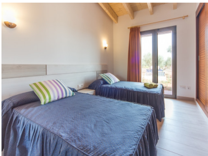
Doppelschlafzimmer mit bodentiefen Fenstern