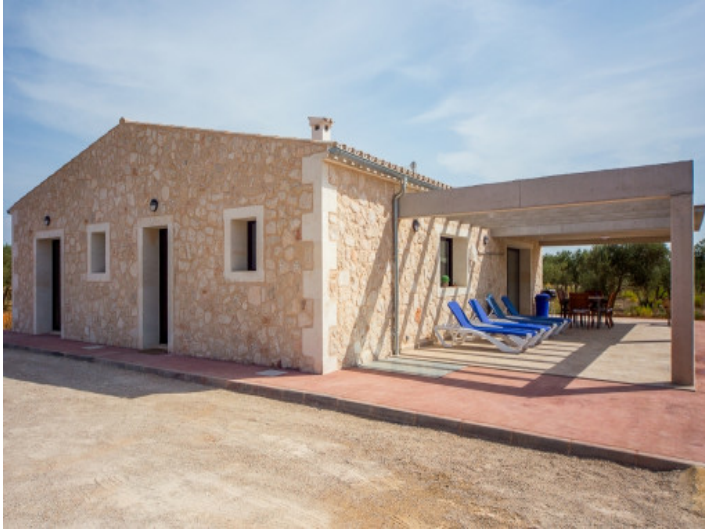
Mediterrane Elemente und moderne Ausstattung

Alle Angaben nach bestem Wissen. Irrtum und Zwischenverkauf vorbehalten. Dieses Exposé ist eine Vorinformation, als Rechtsgrundlage gilt allein der notariell abgeschlossene Kaufvertrag.