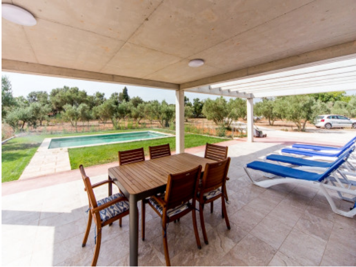
Überdachte Terrasse mit Essbereich