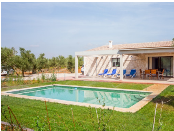
Großes Grundstück von 15.000 qm mit viel Privatsphäre