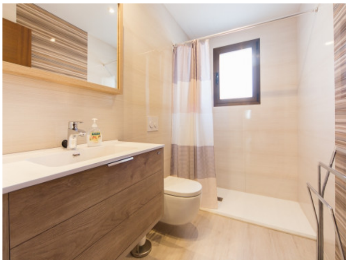
Helles Hauptbadezimmer mit großer Dusche