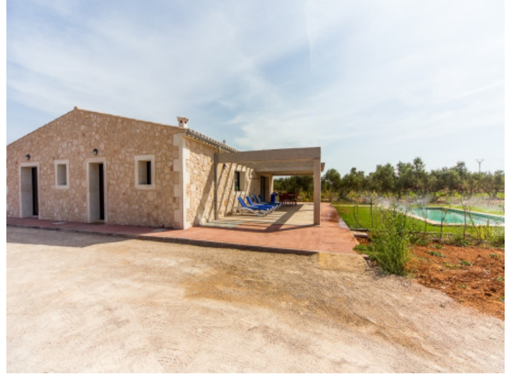
Zufahrt zur Finca