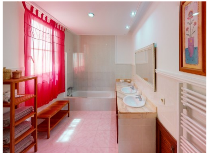
Badezimmer im Erdgeschoss