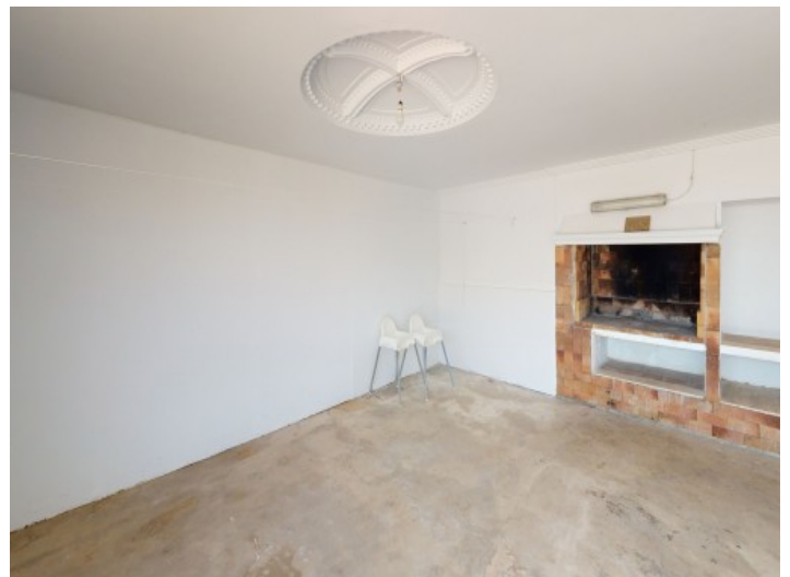
Grillbereich in der Garage

Alle Angaben nach bestem Wissen. Irrtum und Zwischenverkauf vorbehalten. Dieses Exposé ist eine Vorinformation, als Rechtsgrundlage gilt allein der notariell abgeschlossene Kaufvertrag.