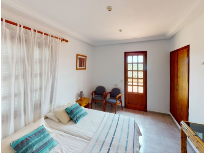
Zweites von drei Doppelschlafzimmern im Obergeschoss