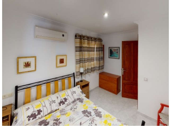
Drittes Schlafzimmer von insgesamt drei Schlafzimmern im Obergeschoss