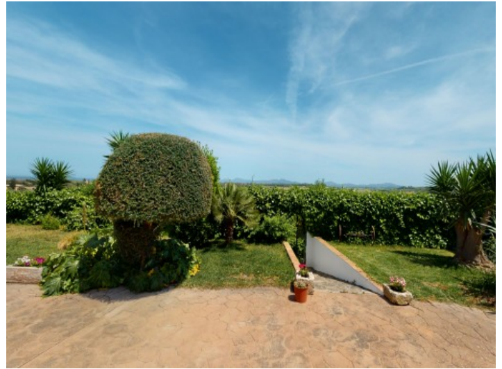
Panoramablick über das Umland von Muro

Alle Angaben nach bestem Wissen. Irrtum und Zwischenverkauf vorbehalten. Dieses Exposé ist eine Vorinformation, als Rechtsgrundlage gilt allein der notariell abgeschlossene Kaufvertrag.