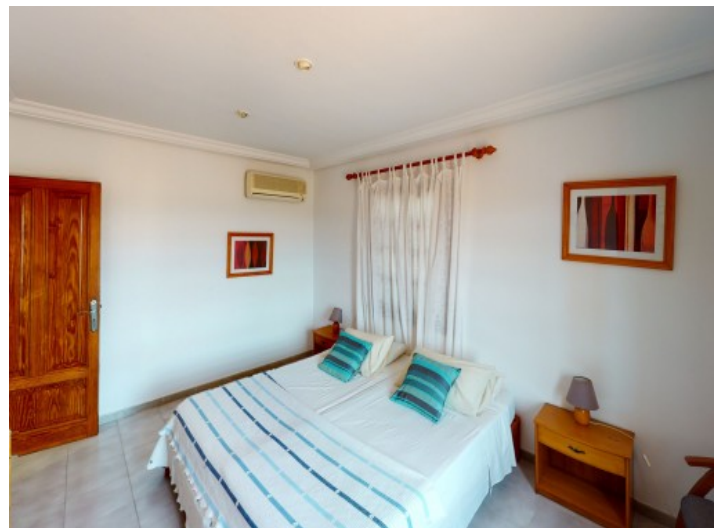
Eins von insgesamt drei Doppelschlafzimmern im Obergeschoss

Alle Angaben nach bestem Wissen. Irrtum und Zwischenverkauf vorbehalten. Dieses Exposé ist eine Vorinformation, als Rechtsgrundlage gilt allein der notariell abgeschlossene Kaufvertrag.