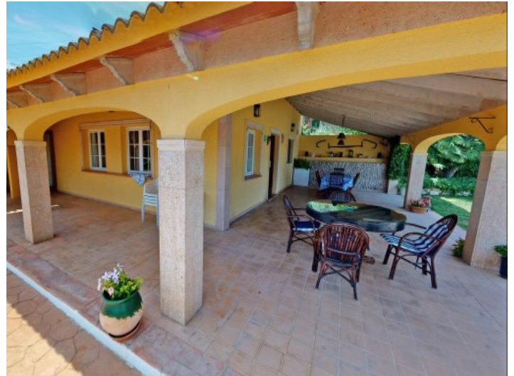
Großzügige überdachte Terrassen