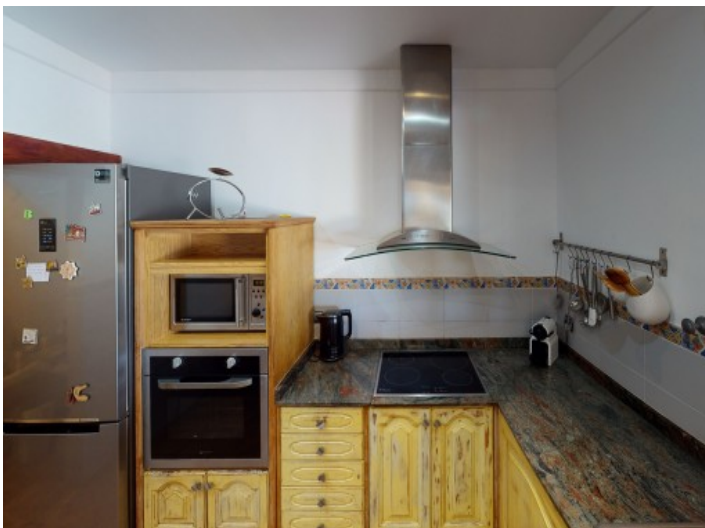
Komplett eingerichtete Küche