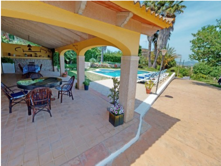
überdachte Terrasse mit Zugang auf die Sonnenterrasse und Pool