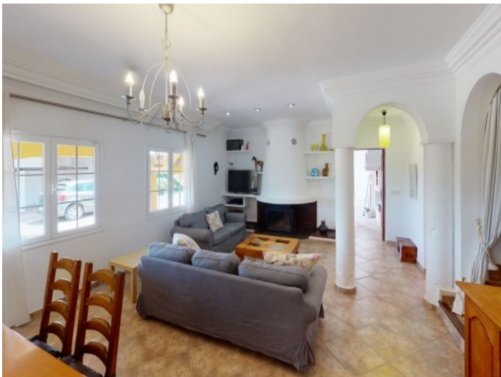
Blick in den Wohn- und Essbereich