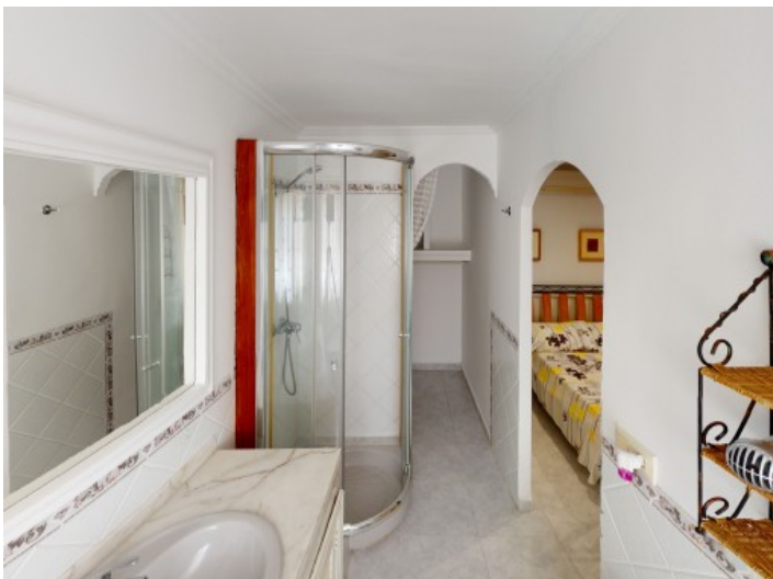
Badezimmer en Suite des Hauptschlafzimmers