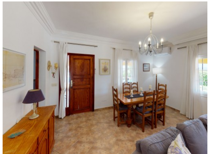
Essbereich und Eingang