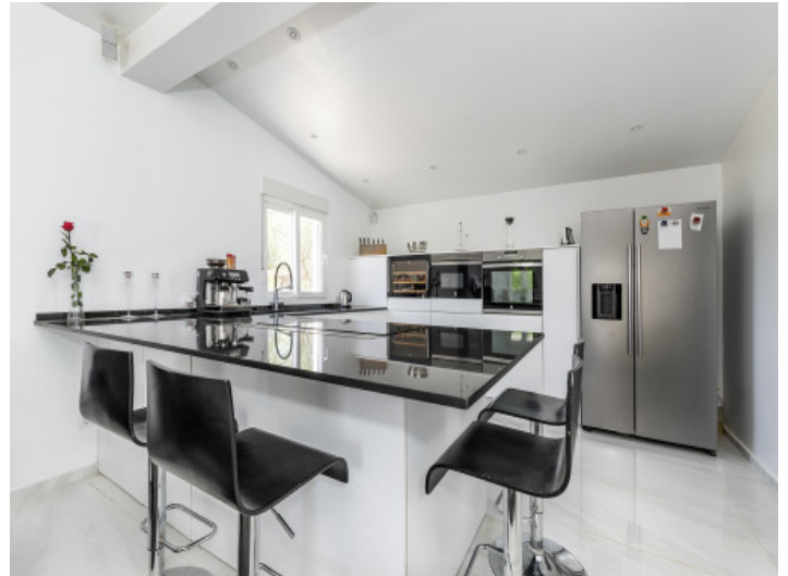
Moderne Küche in weiss