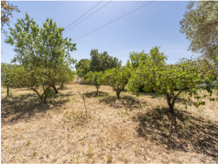
Grundstück mit verschiedenen Obstbäumen