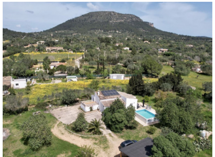
Blick von oben

Alle Angaben nach bestem Wissen. Irrtum und Zwischenverkauf vorbehalten. Dieses Exposé ist eine Vorinformation, als Rechtsgrundlage gilt allein der notariell abgeschlossene Kaufvertrag.