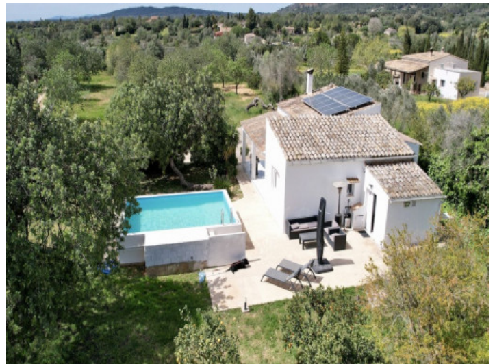
Blick von oben