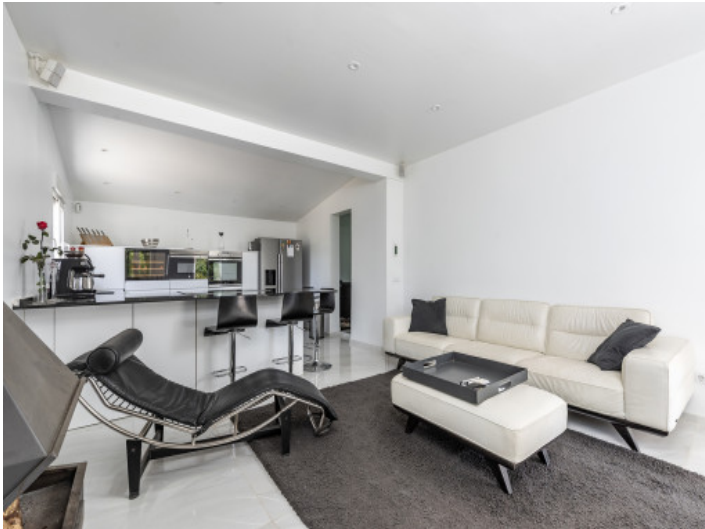
Heller, offener Wohnbereich