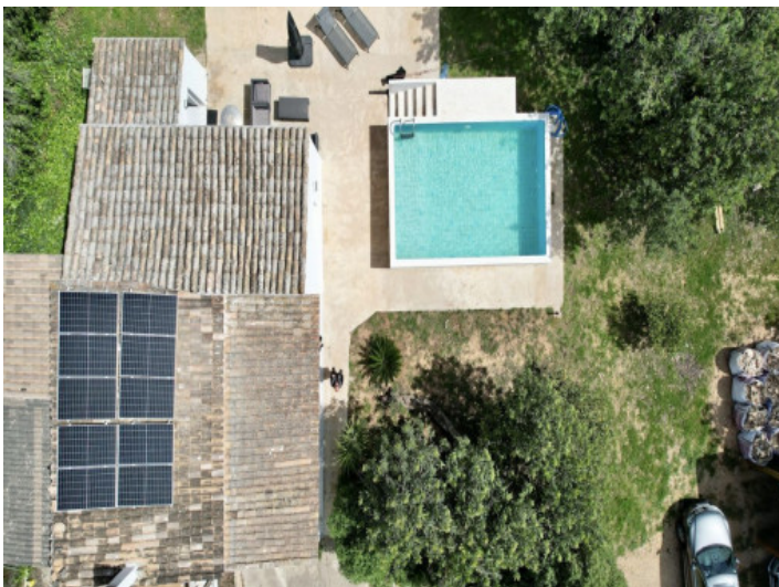
Blick von oben