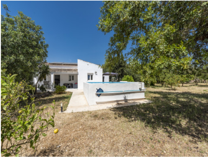
Ansicht der Finca mit Pool