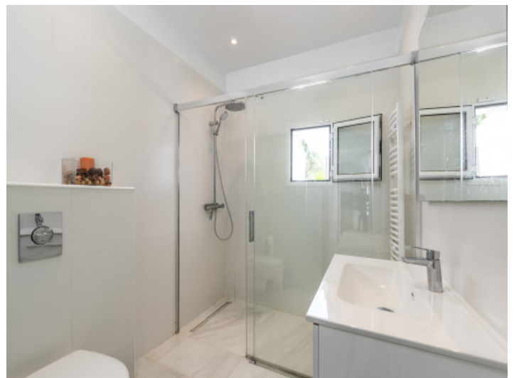
Duschbadezimmer mit Fenster