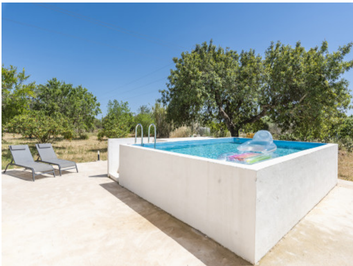
Pool und Sonnenterrasse