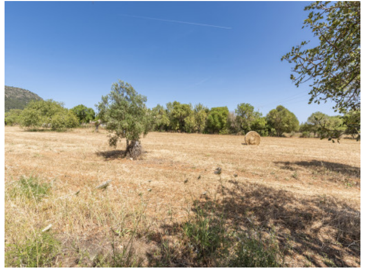
Blick über das Grundstück