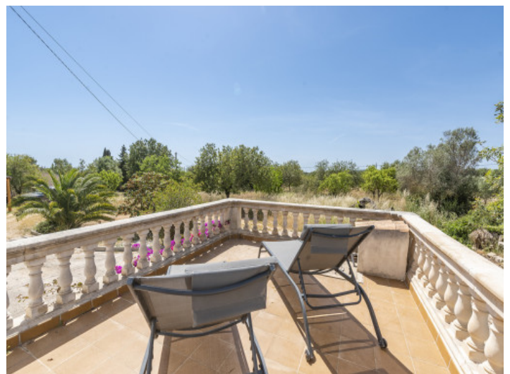
Obere Terrasse mit Blick über das Grundstück

Alle Angaben nach bestem Wissen. Irrtum und Zwischenverkauf vorbehalten. Dieses Exposé ist eine Vorinformation, als Rechtsgrundlage gilt allein der notariell abgeschlossene Kaufvertrag.