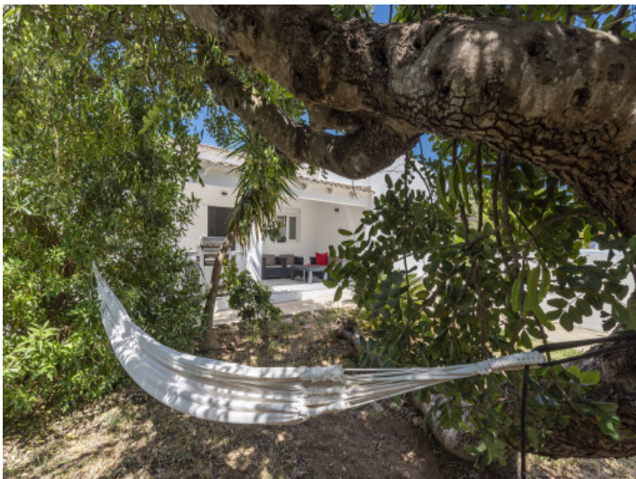
Idyllischer Garten mit natürlichen Schatten