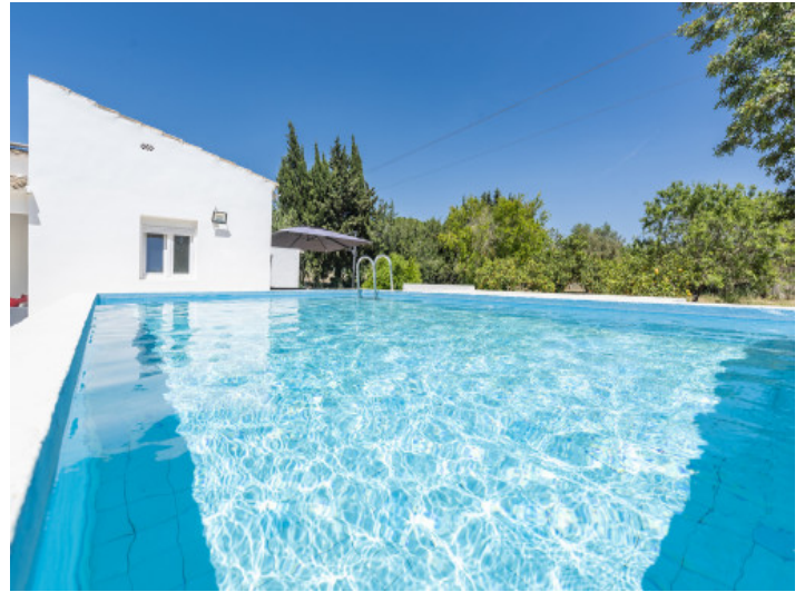
Sonniger 6 x 4 m Pool