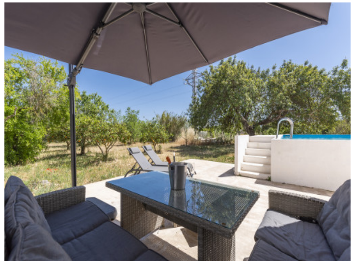
Loungebereich neben dem Pool