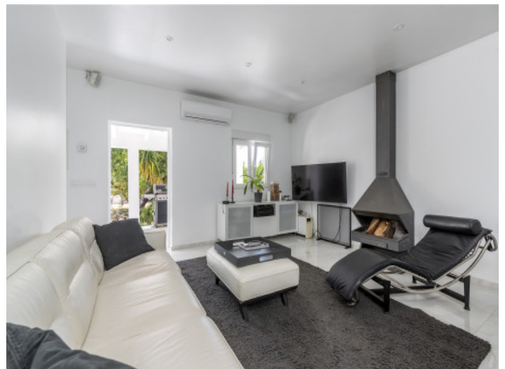
Wohnbereich mit Kamin

Alle Angaben nach bestem Wissen. Irrtum und Zwischenverkauf vorbehalten. Dieses Exposé ist eine Vorinformation, als Rechtsgrundlage gilt allein der notariell abgeschlossene Kaufvertrag.