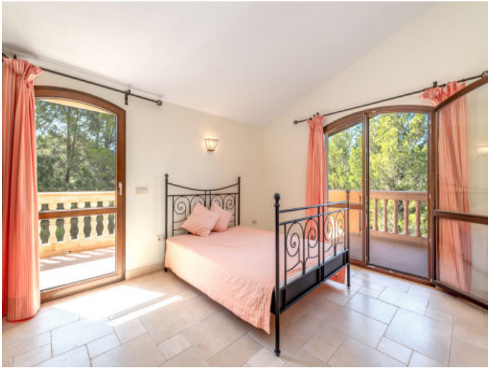
Eines von 6 Schlafzimmern