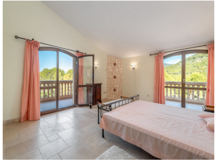
Eines von 6 Schlafzimmern