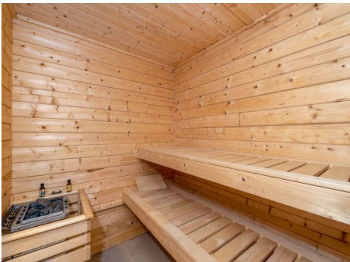
Eigener Sauna- und Spabereich