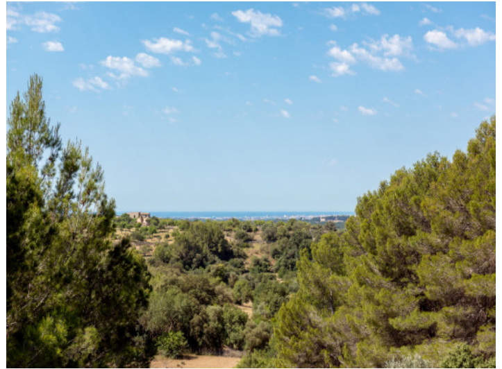
Wundervoller Panoramablick bis zum Meer