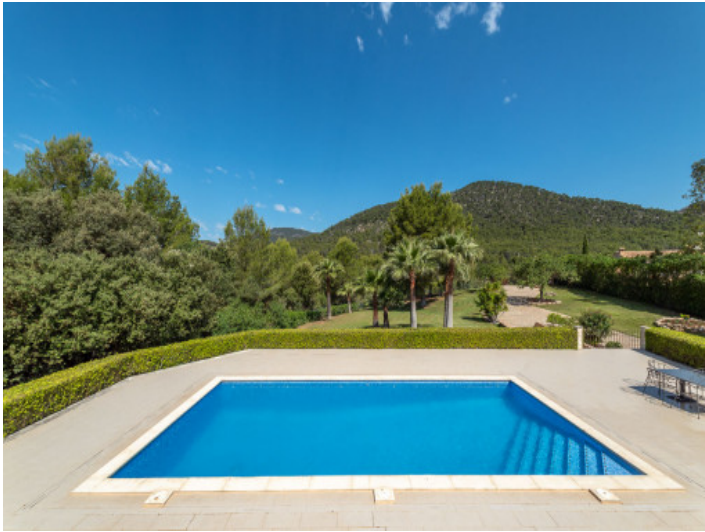
Pool in absoluter Privatsphäre