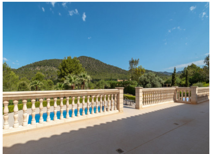
Große Terrasse mit Zugang zum Pool

Alle Angaben nach bestem Wissen. Irrtum und Zwischenverkauf vorbehalten. Dieses Exposé ist eine Vorinformation, als Rechtsgrundlage gilt allein der notariell abgeschlossene Kaufvertrag.