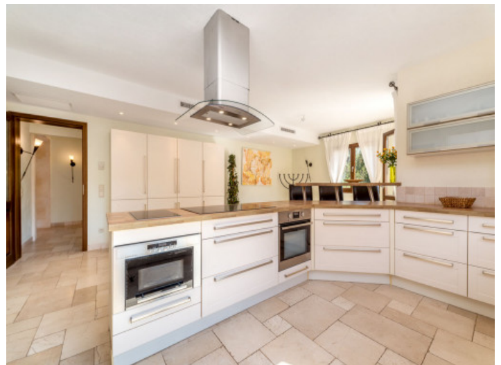
Große, moderne Küche

Alle Angaben nach bestem Wissen. Irrtum und Zwischenverkauf vorbehalten. Dieses Exposé ist eine Vorinformation, als Rechtsgrundlage gilt allein der notariell abgeschlossene Kaufvertrag.