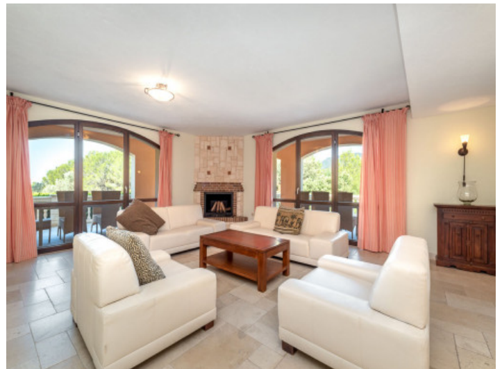
Großer Wohnbereich mit Kamin