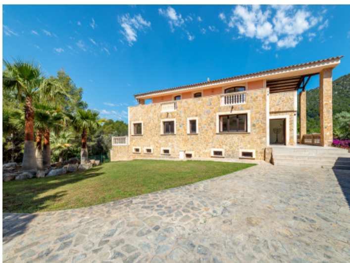
Außenansicht der Finca