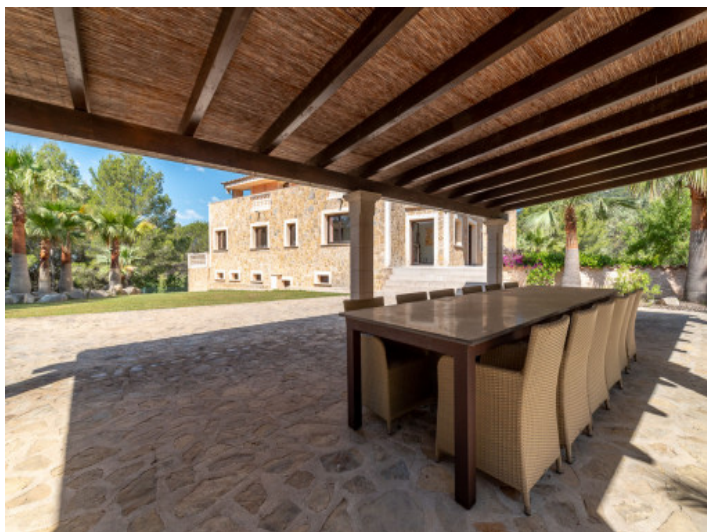
Überdachter Essbereich im Freien