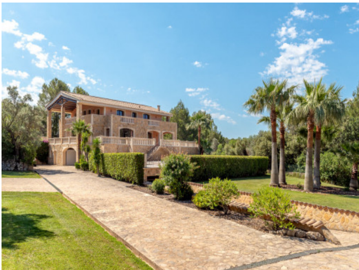
Zufahrt zur Finca