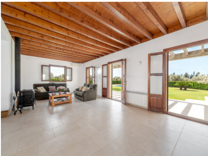
Wohnbereich mit Gartenzugang