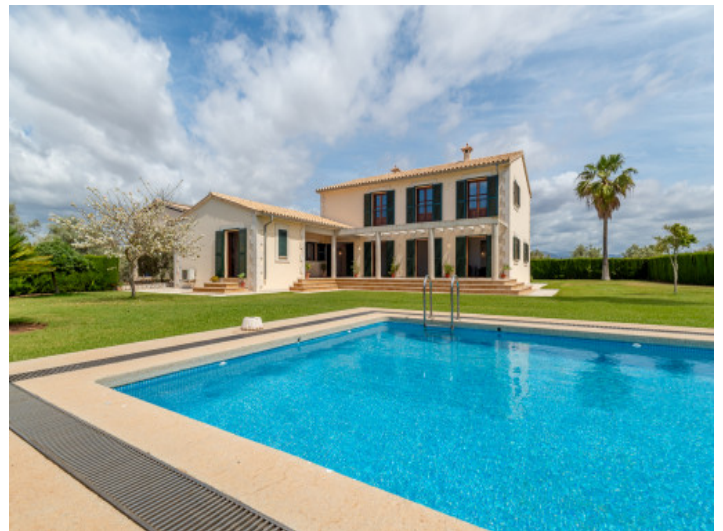
Außenansicht und Pool