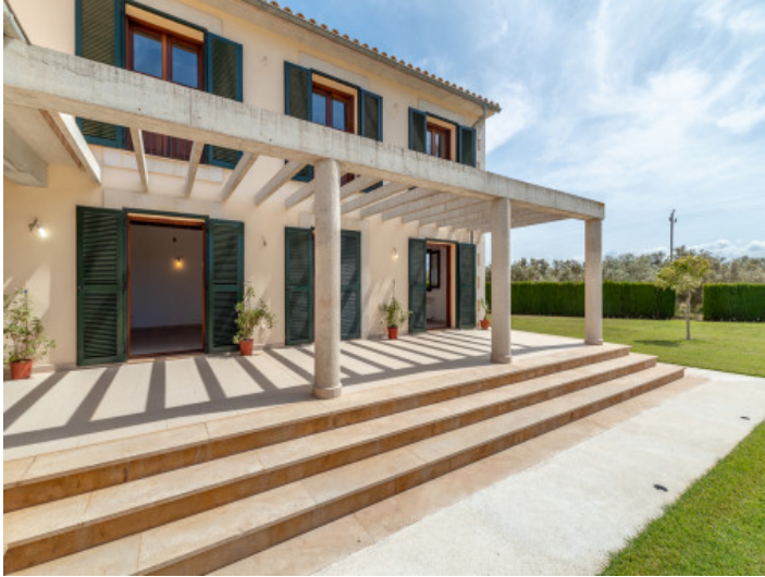
Ansicht der Terrasse