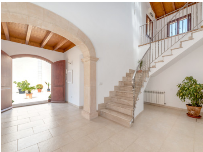
Große Eingangshalle mit Steinbogen