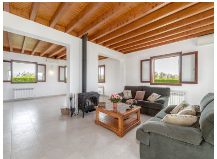
Großer Wohnbereich mit Kamin

Alle Angaben nach bestem Wissen. Irrtum und Zwischenverkauf vorbehalten. Dieses Exposé ist eine Vorinformation, als Rechtsgrundlage gilt allein der notariell abgeschlossene Kaufvertrag.