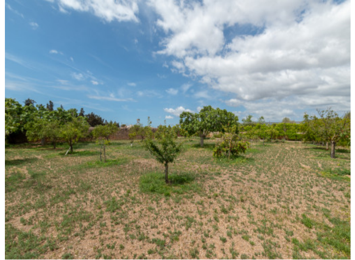
Großes Grundstück mit Obstbäumen