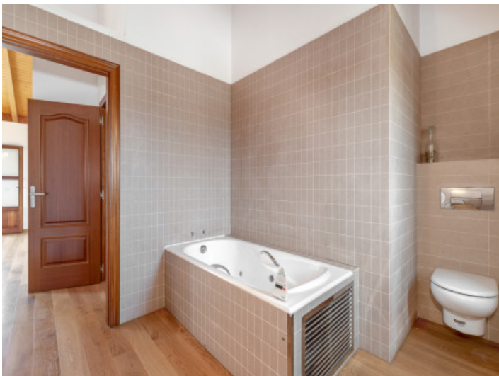
Badezimmer mit Wanne