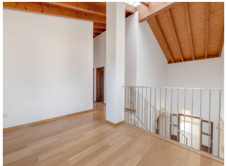
Moderne Galerie im Obergeschoss

Alle Angaben nach bestem Wissen. Irrtum und Zwischenverkauf vorbehalten. Dieses Exposé ist eine Vorinformation, als Rechtsgrundlage gilt allein der notariell abgeschlossene Kaufvertrag.