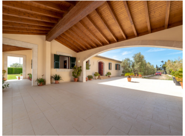
Große Frontterrasse und Zufahrt